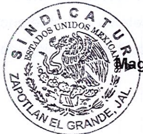
Magali Casillas Contreras Síndico Municipal