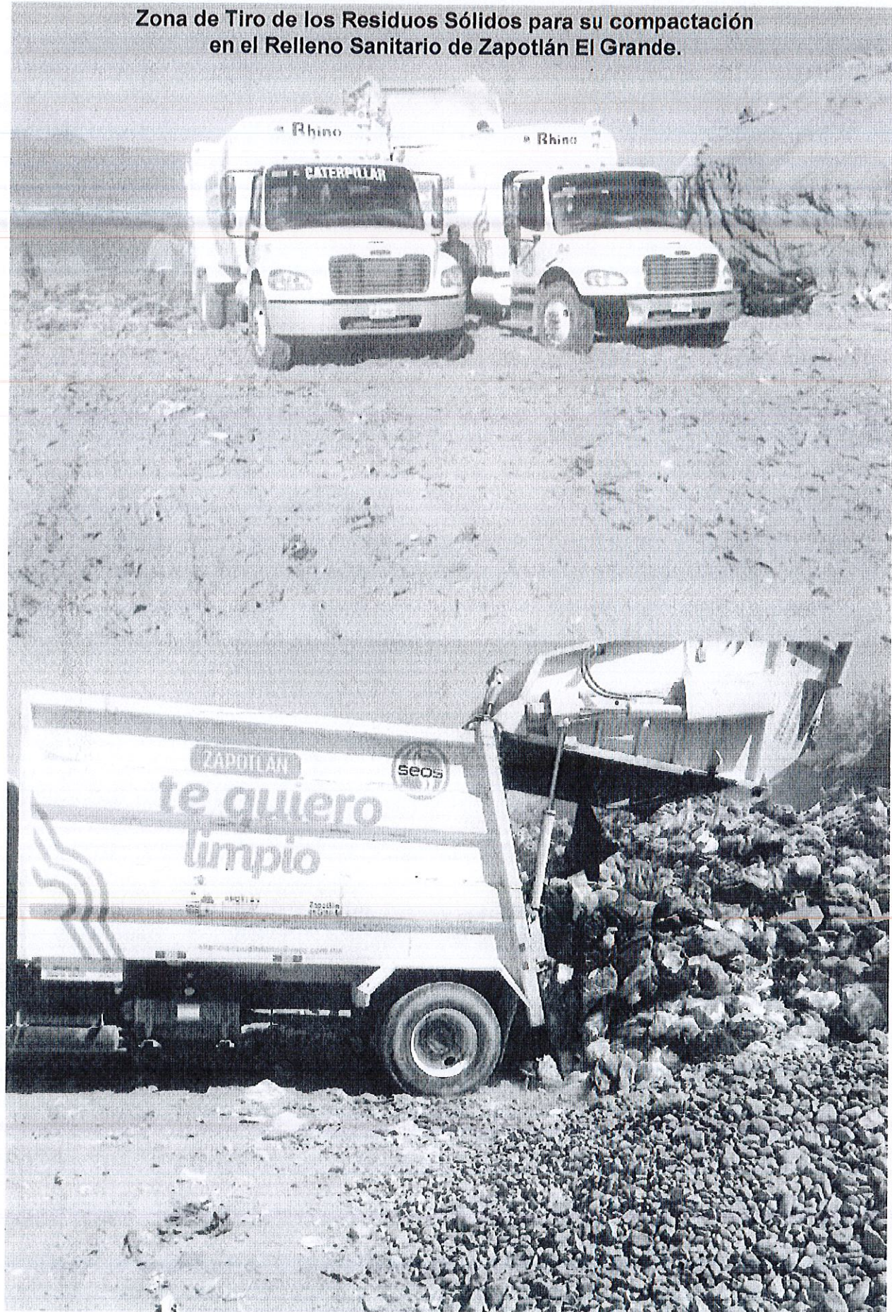
Zona de Tiro de los Residuos Sólidos para su compactación en el Relleno Sanitario de Zapotlán El Grande.