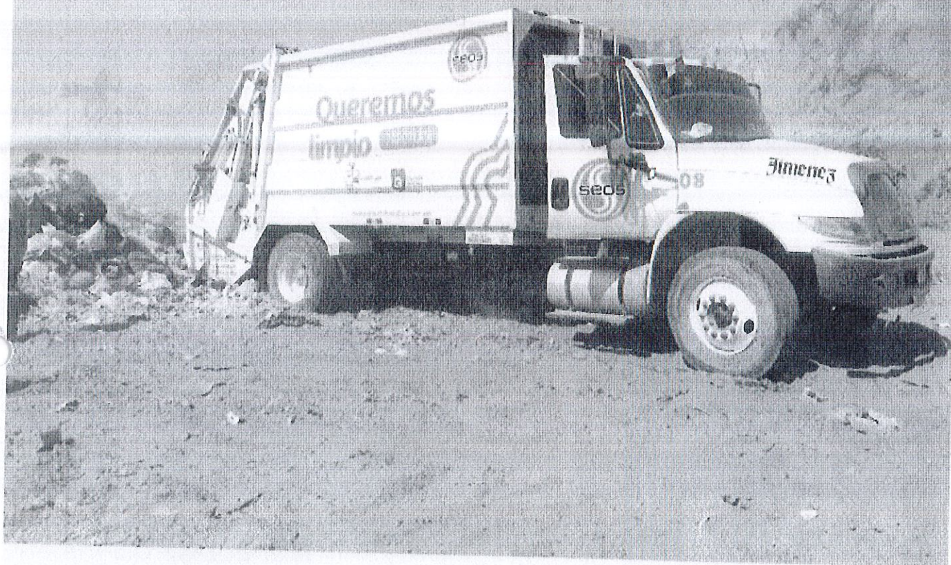
Zona de Tiro de los Residuos Sólidos para su compactación en el Relleno Sanitario de Zapotlán El Grande.