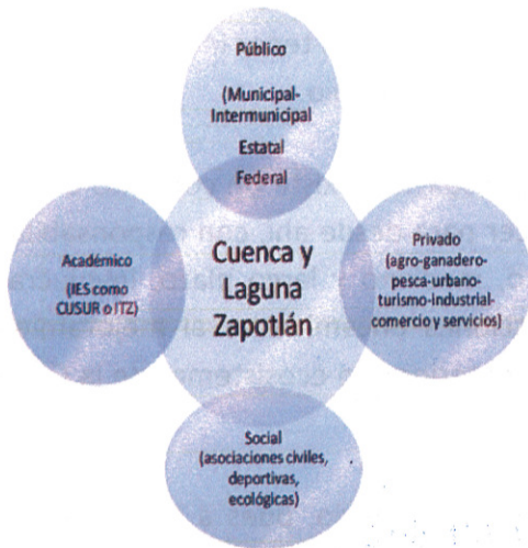
Ilustración 75. Principales sectores involucrados en la sustentabilidad de la cuenca.

Para lo anterior, se buscará la participación de diversos sectores involucrados en la sustentabilidad de la cuenca, tomando como referencia la siguiente ilustración contenida en el Plan Maestro de la cuenca endorreica de Zapotlán el Grande.