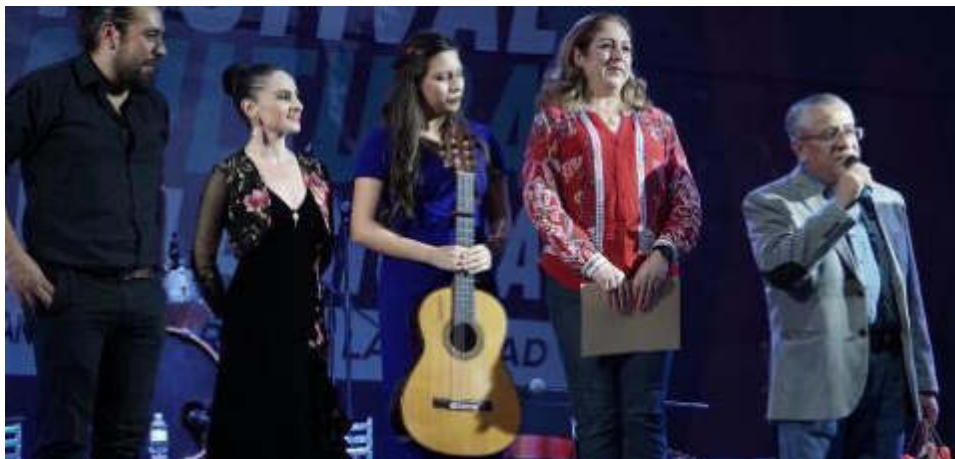
11 DE AGOSTO 2019