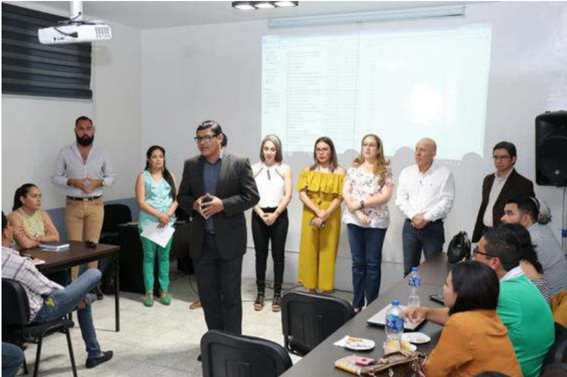
08 DE MARZO 2019. INICIO DEL DIPLOMADO DE TRANSPARENCIA