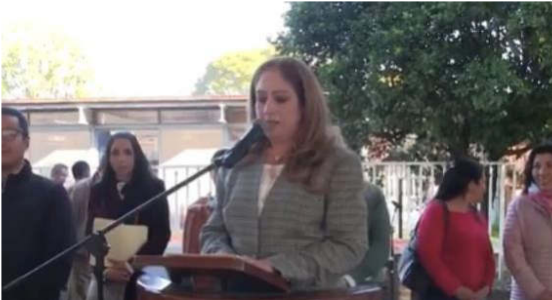
05 DE FEBRERO DE 2019