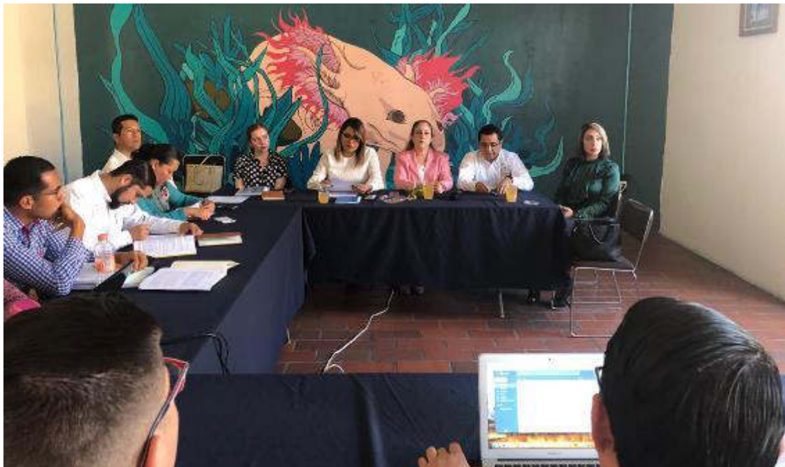
11 DE FEBRERO 2019