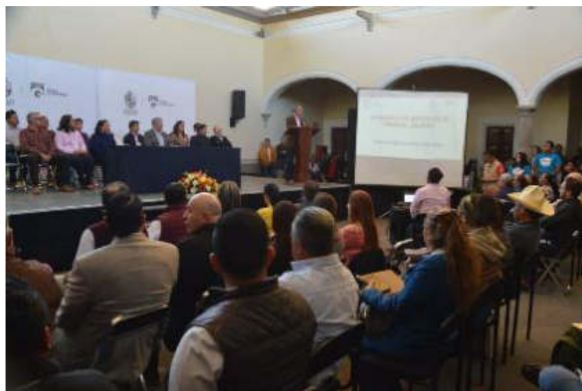
29 DE ENERO 2019 INSTALACION DE COMITÉ DE PLANEACION