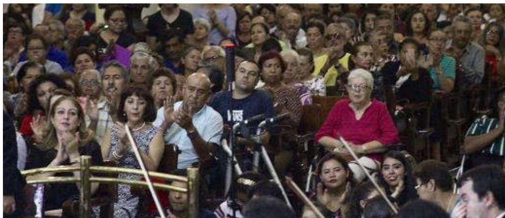
15 DE AGOSTO 2019