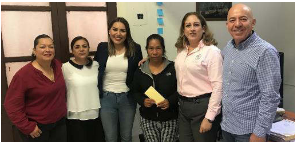
25 DE JULIO 2019