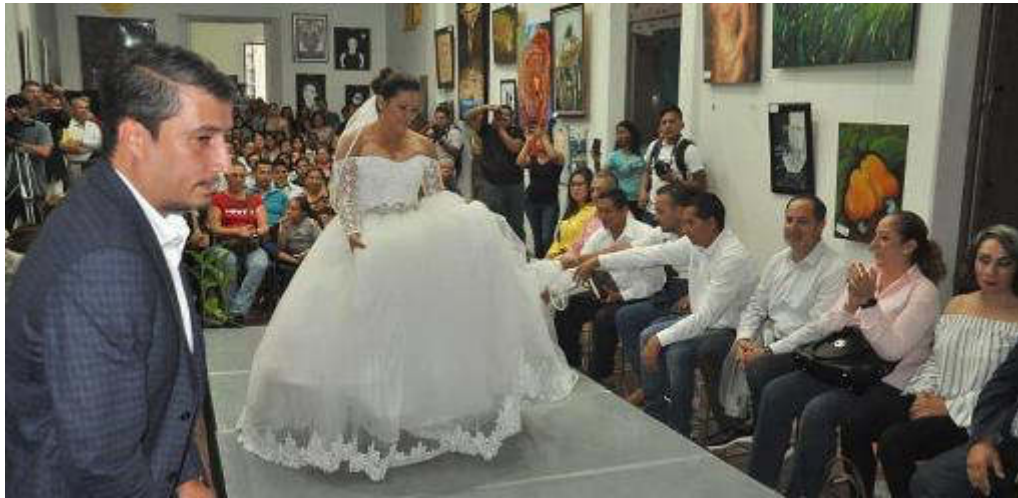
12 DE AGOSTO 2019