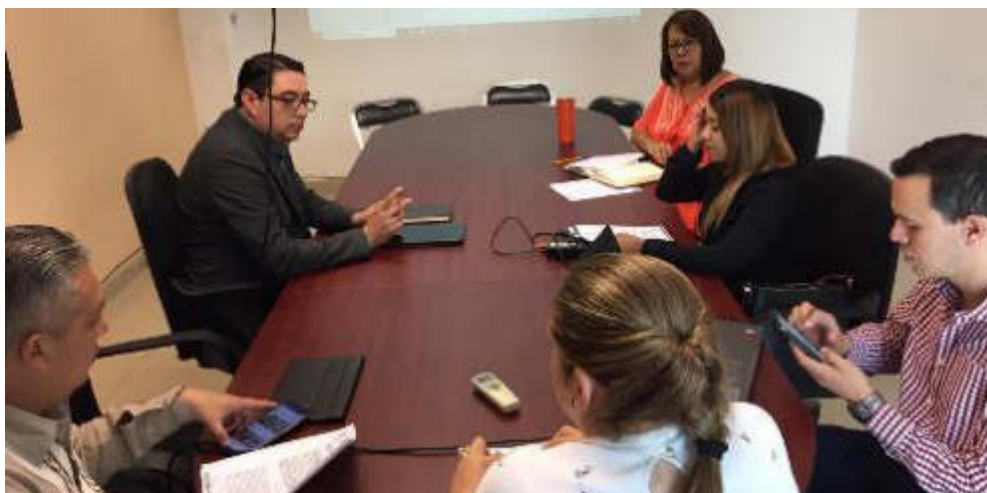
13 DE SEPTIEMBRE 201