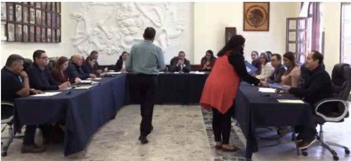
SESION EXTRAORDINARIA NO. 07