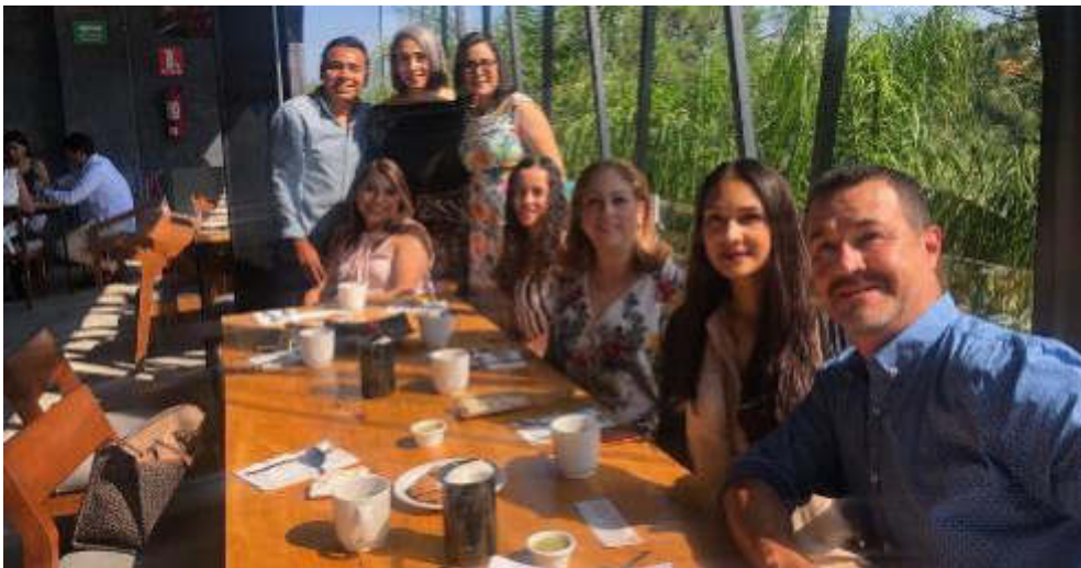
10 DE JULIO 2019