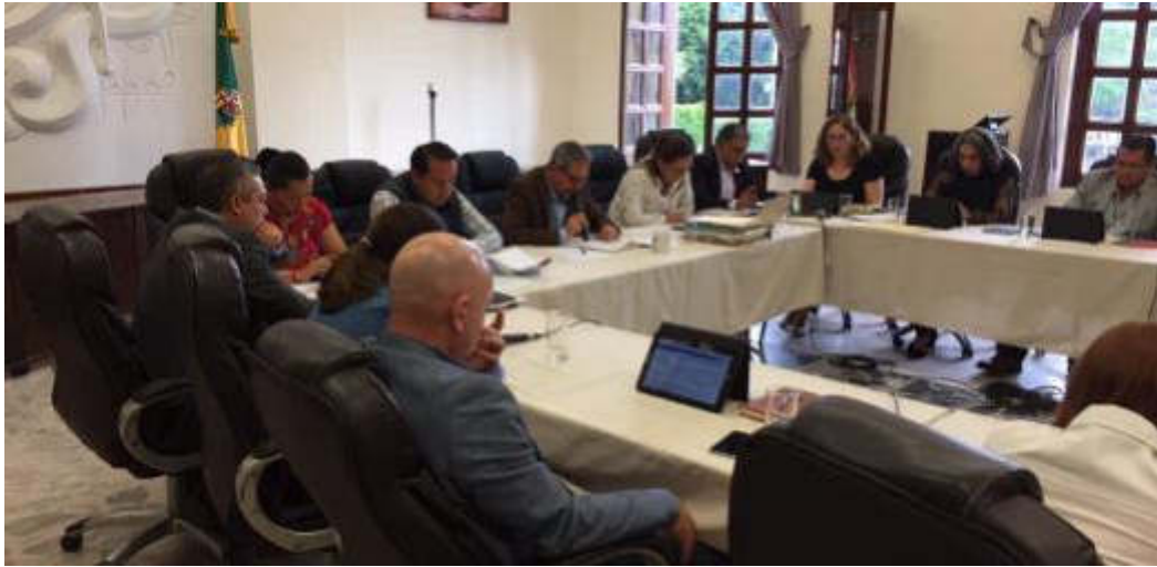
23 DE JULIO 2019