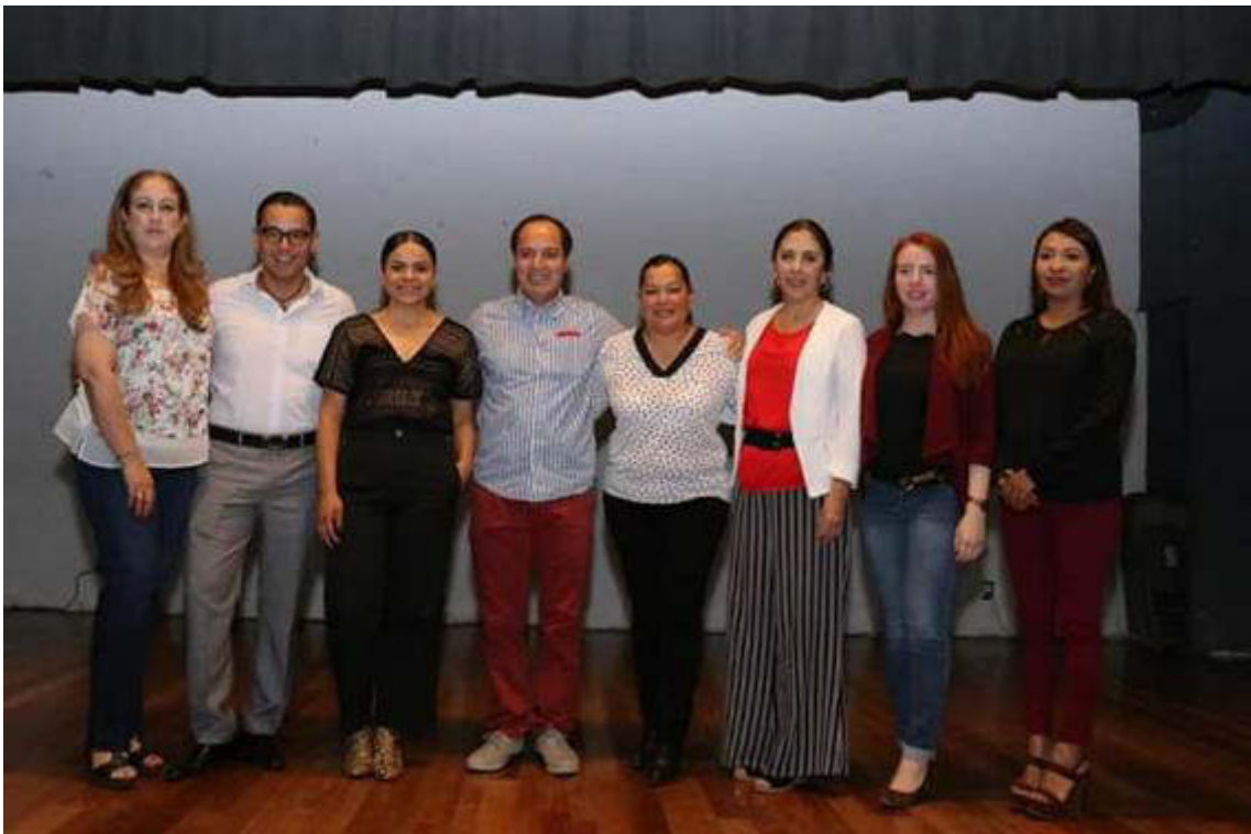
08 DE MARZO CONFERENCIA