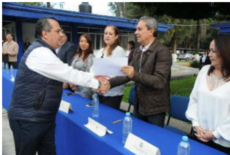
03 DE OCTUBRE 2018. ANIVERSARIO DEL NATALICIO DEL GRAL. GORDIANO GUZMAN.