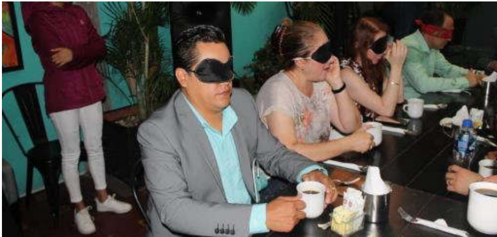
18 DE JULIO 2019