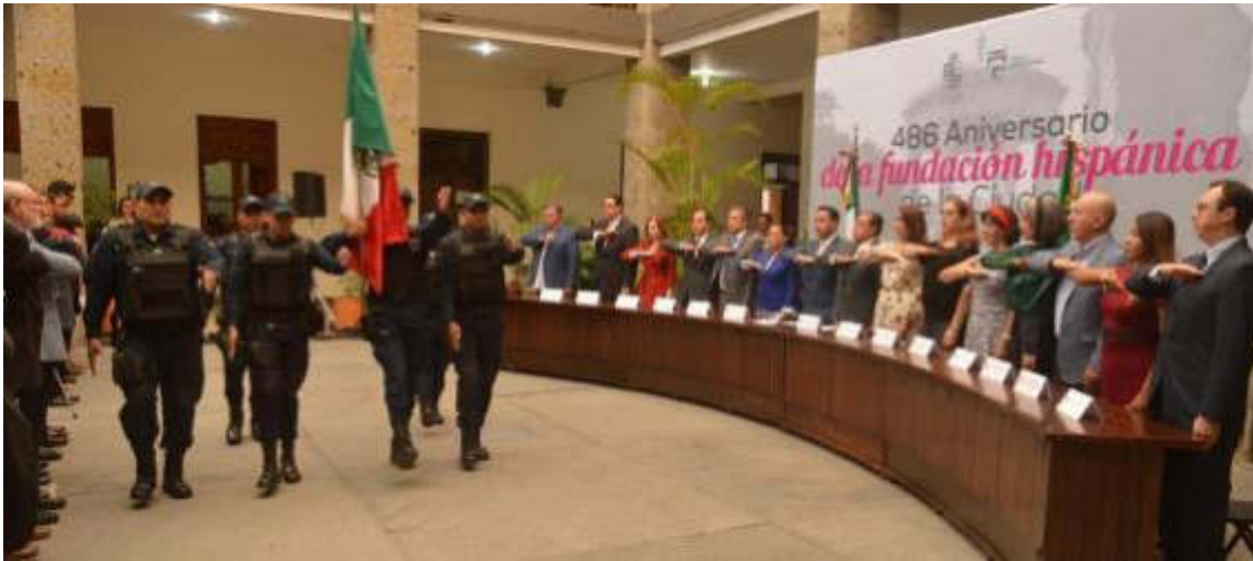
15 DE AGOSTO 2019