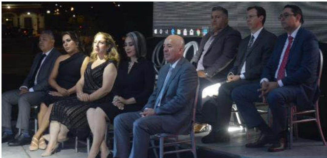
06 DE SEPTIEMBRE 2019