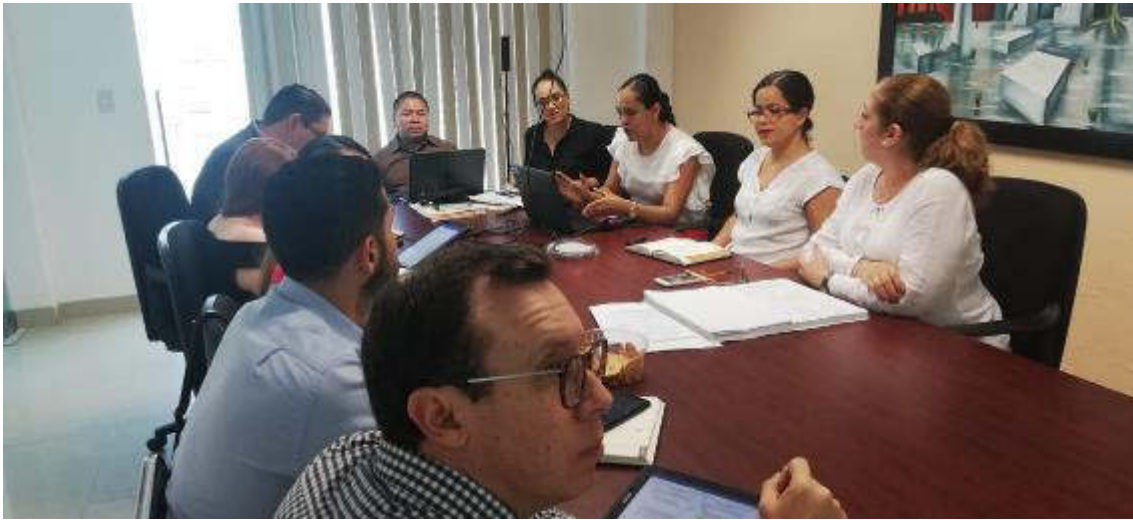
22 DE AGOSTO 2019