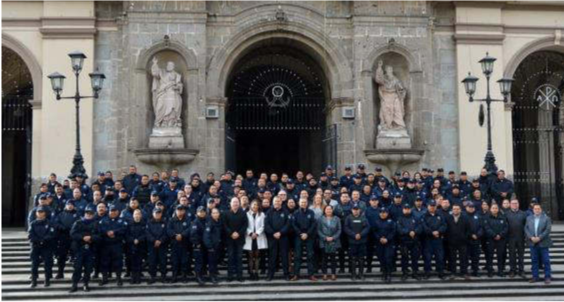
02 DE ENERO DIA DEL POLICIA