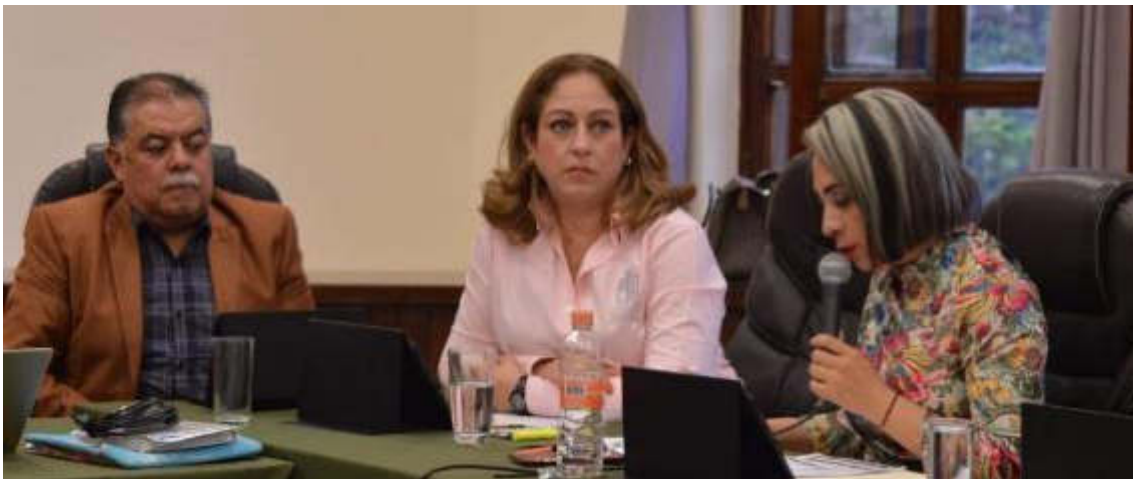
25 DE JULIO 2019