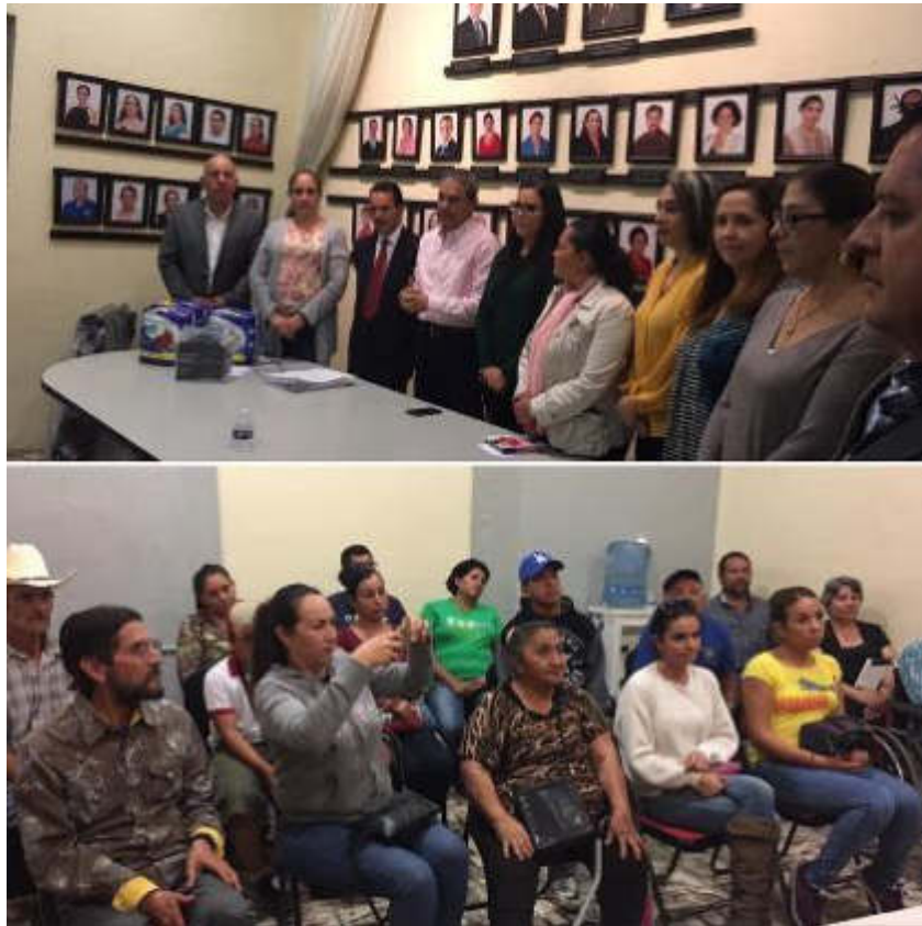
ENTREGA DE APOYOS OPD ESTACIONOMETROS 08 DE FEBRERO 2019