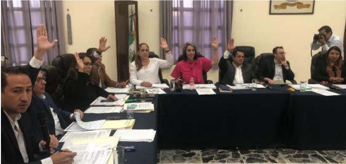
25 DE MARZO, SESION ORDINARIA 05