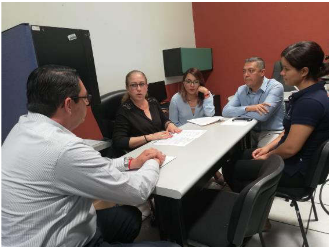
SESION NO. 05 EXTRAORDINARIA 22 DE MARZO DE 2019