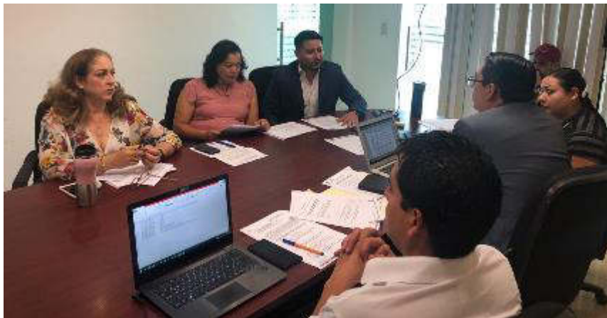
27 DE AGOSTO 2019