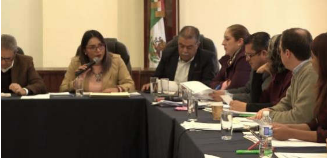
SESION ORDINARIA NO. 02