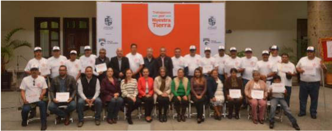
19 DE SEPTIEMBRE 2019