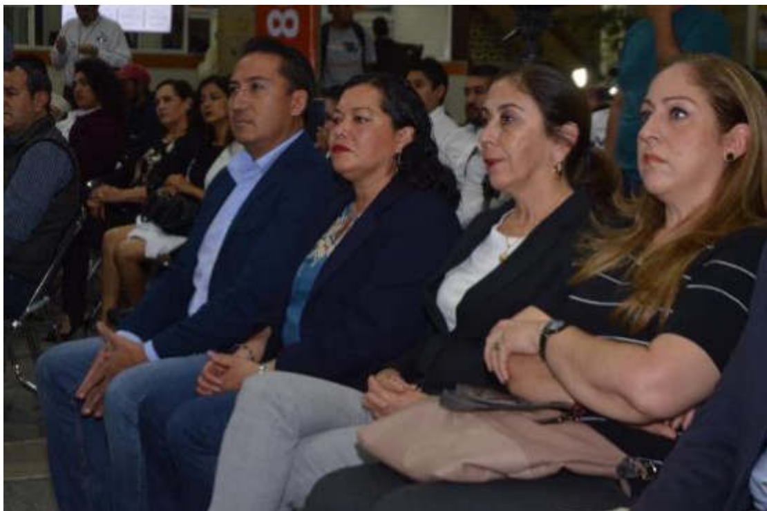
21 DE ENERO DE 2019. FIRMA DE CONVENIO HEMODIALISIS