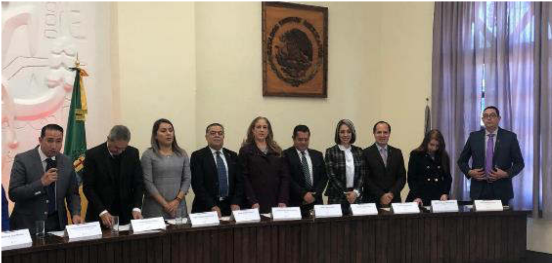
04 DE ENERO DE 2019. SESION SOLEMNE NO. 02