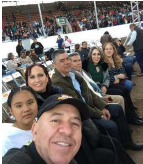
26 DE ENERO 2019 FUNCION DE BOX ESTELAR EN ZAPOTLAN