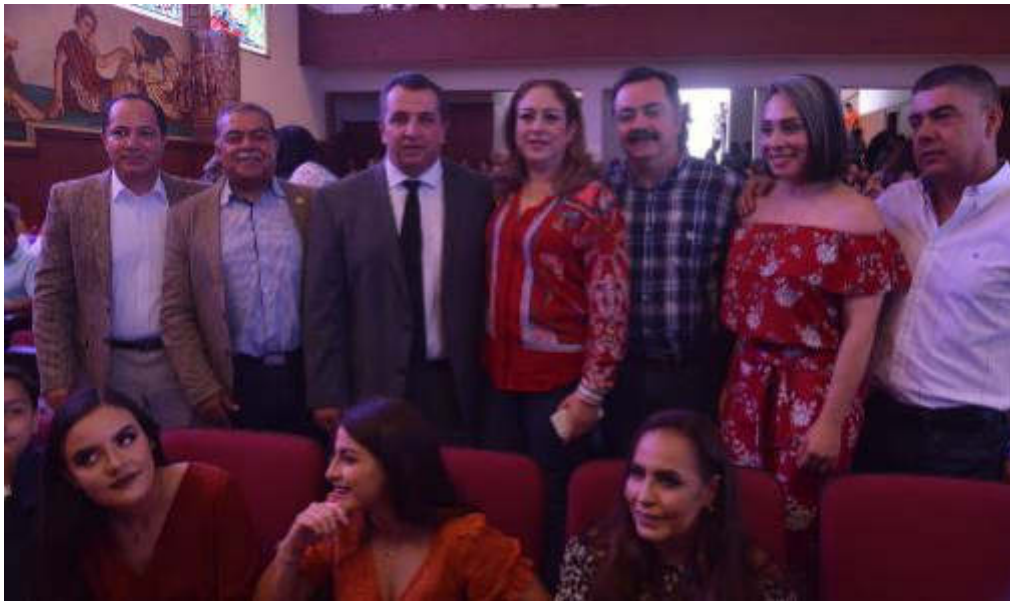
28 DE SEPTIEMBRE 2019