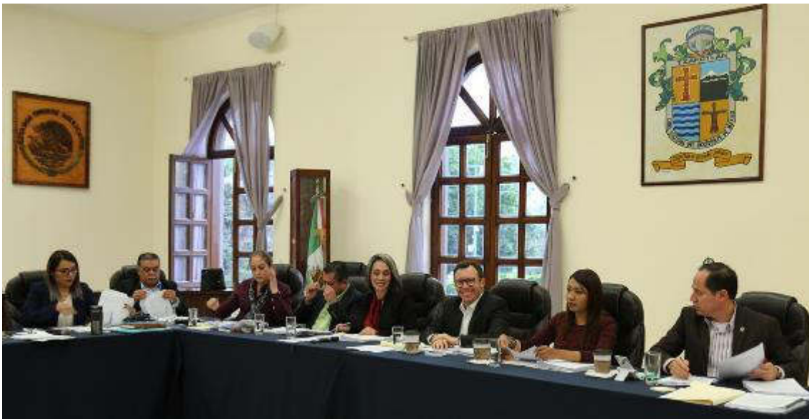
17 DE ENERO 2019 SESION ORDINARIA 03