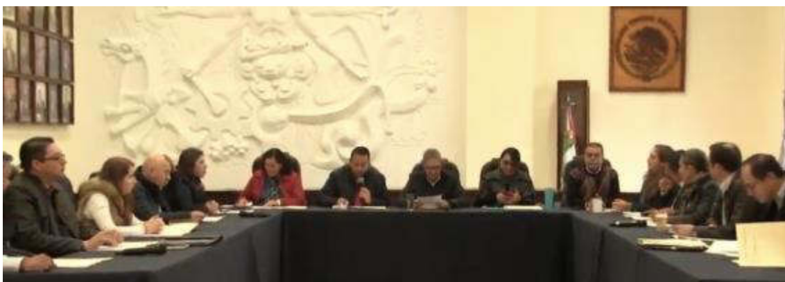
SESION EXTRAORDINARIA NO. 06