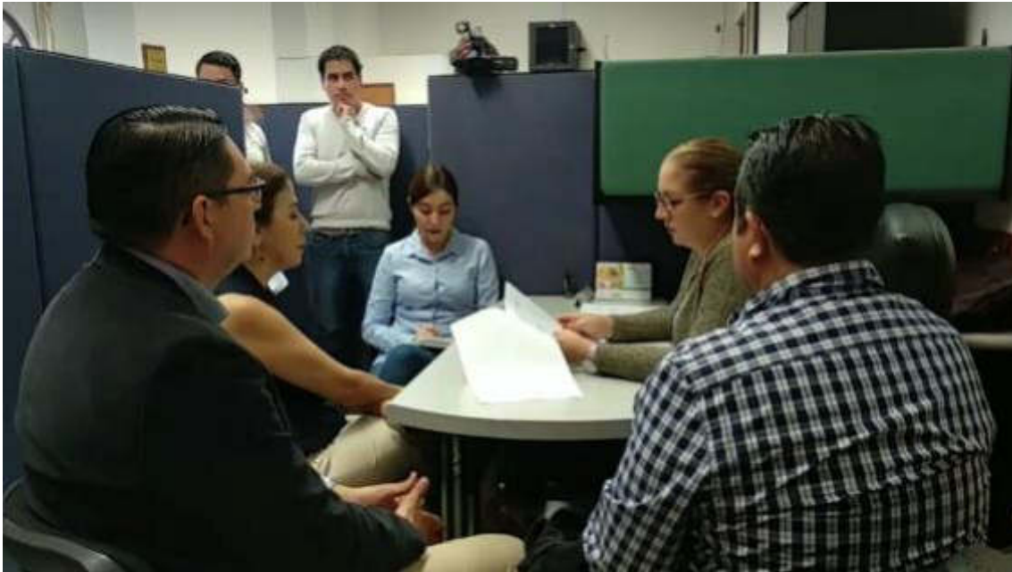
SESION 01 ORDINARIA

1. FORMAL INSTALACION DE LA COMISION EDILICIA PERMANENTE DE ESTACIONAMIENTOS PARA LA ADMINISTRACION PUBLICA MUNICIPAL 2018-2021