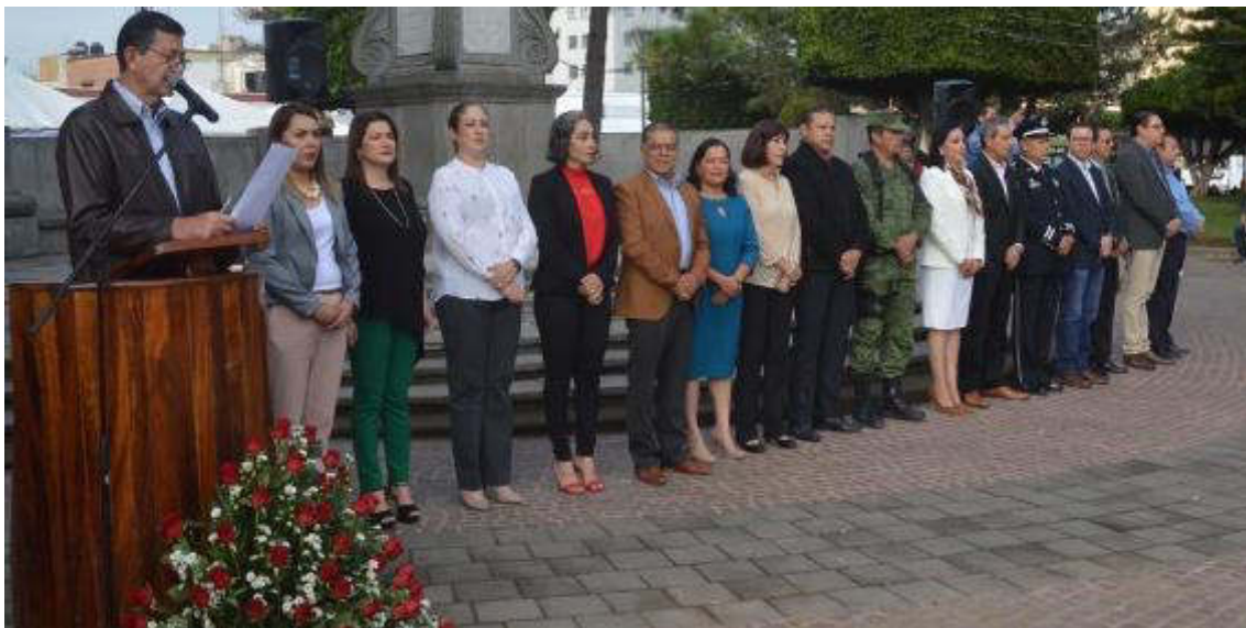
13 DE SEPTIEMBRE 2019