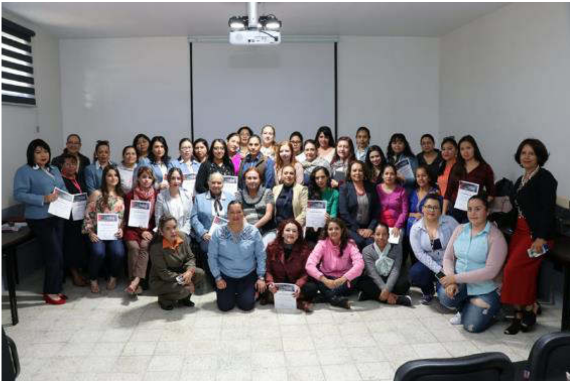
14 DE FEBRERO DE 2019. DOCUMENTAL CON EL INE