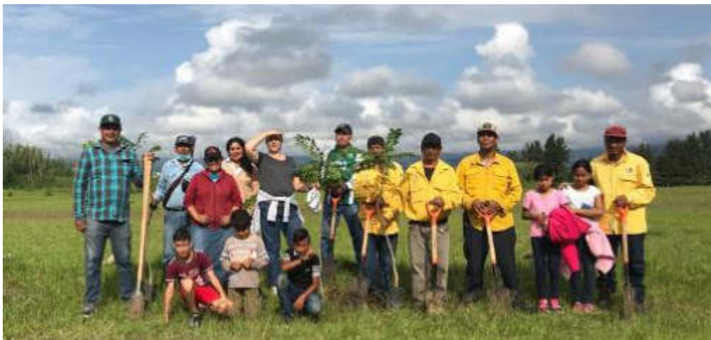
14 DE JULIO 2019