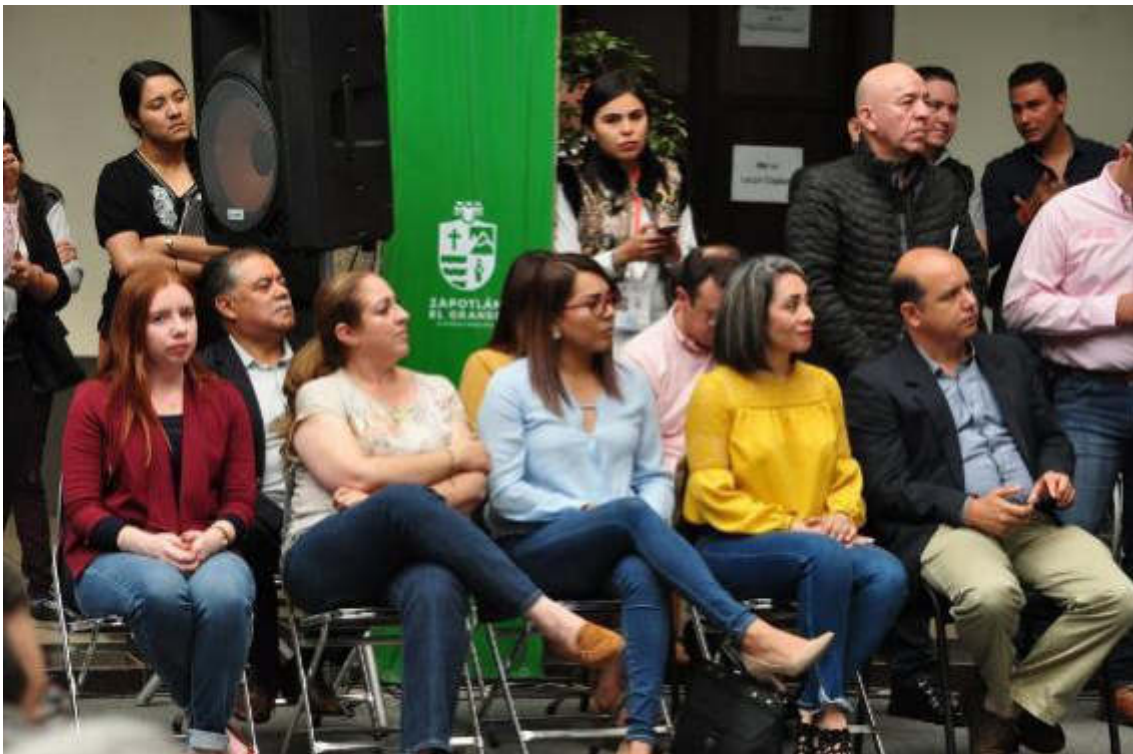
26 DE FEBRERO DE 2019. DIA NACIONAL POR LA INCLUSIÓN LABORAL