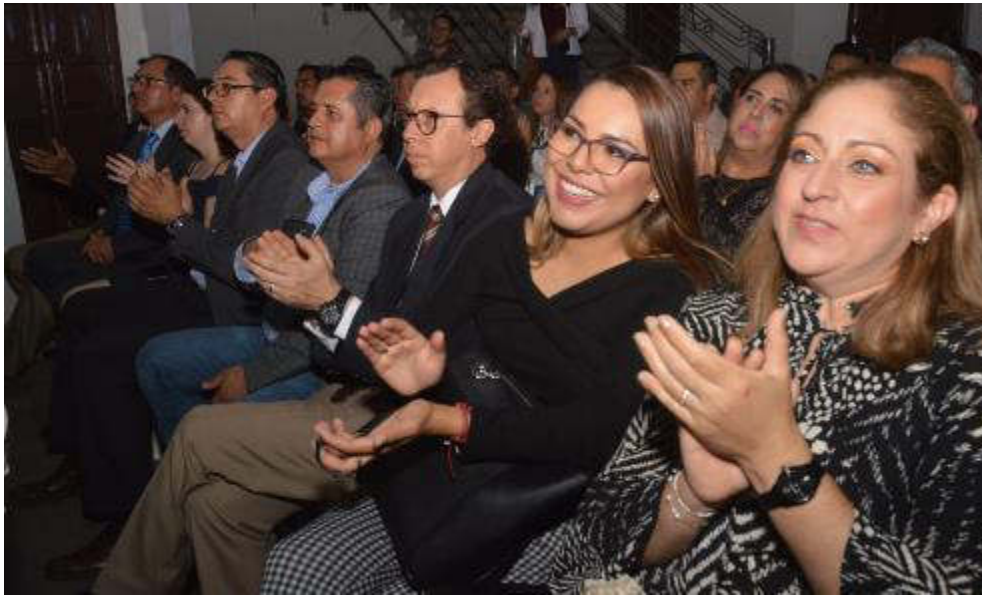
27 DE SEPTIEMBRE 2019