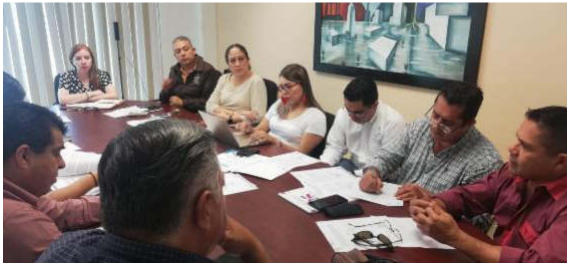
02 DE SEPTIEMBRE 2019