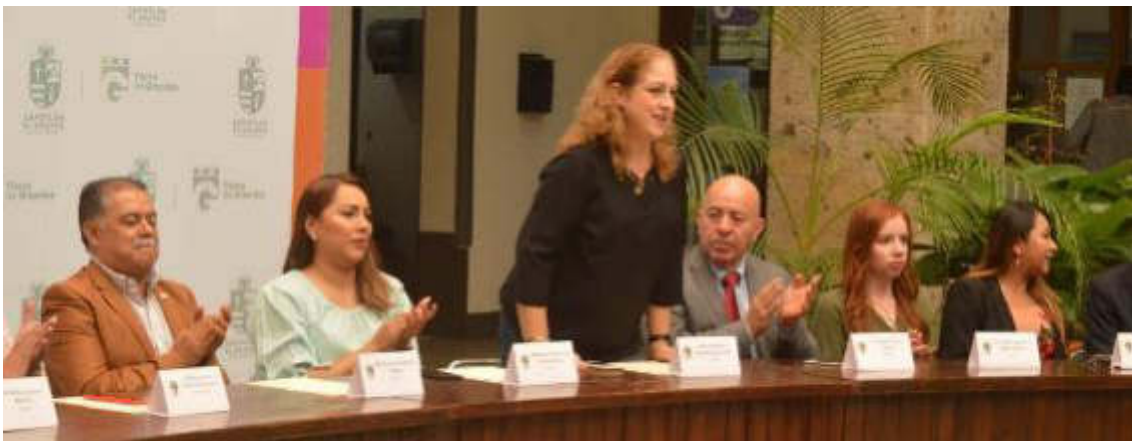
29 DE AGOSTO 2019