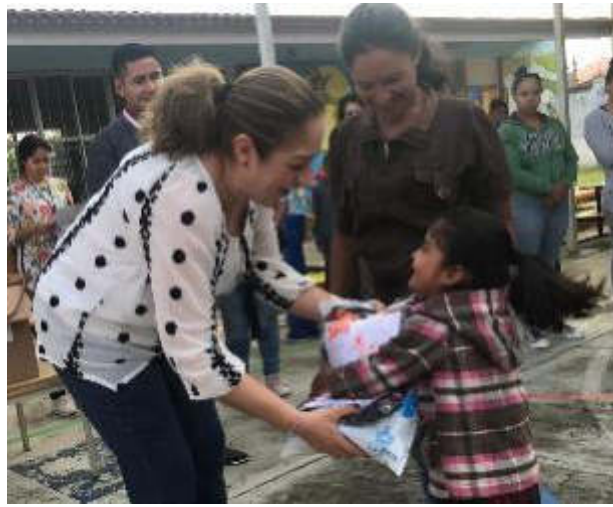
10 DE SEPTIEMBRE 2019