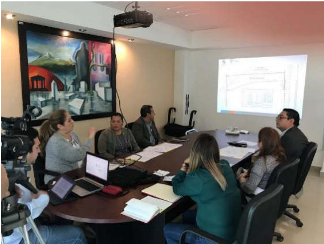
06 DE FEBRERO DE 2017