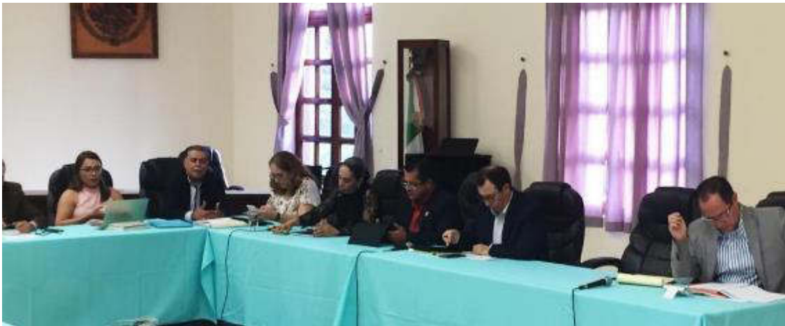
26 DE AGOSTO 2019