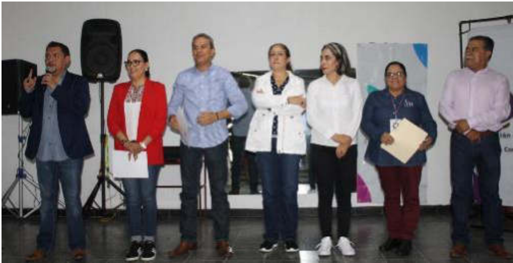
08 DE AGOSTO 2019