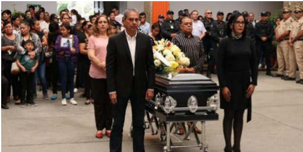
24 DE JULIO 2019