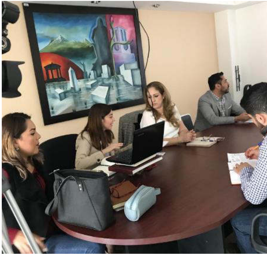
05 DE FEBRERO DE 2019.