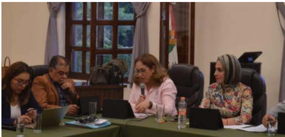
25 DE JULIO 2019