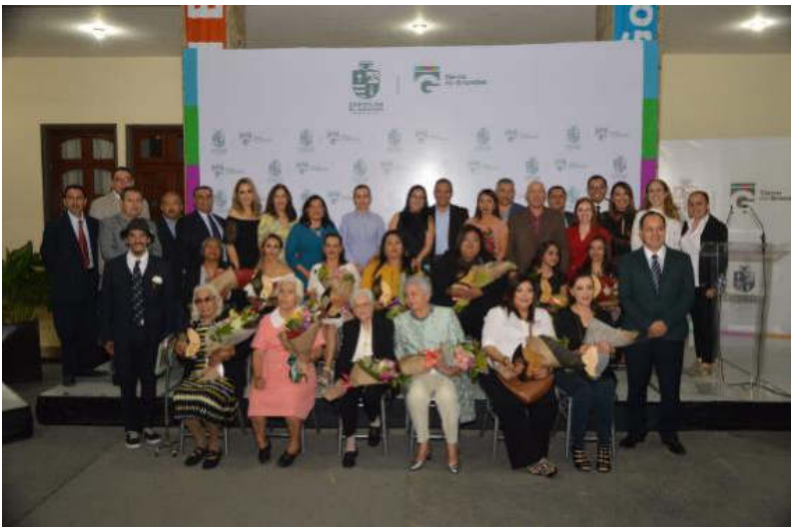
RECONOCIMIENTO A LA MUJER ZAPOTLENSE 12 DE MARZO DE 2019