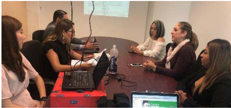
17 DE SEPTIEMBRE