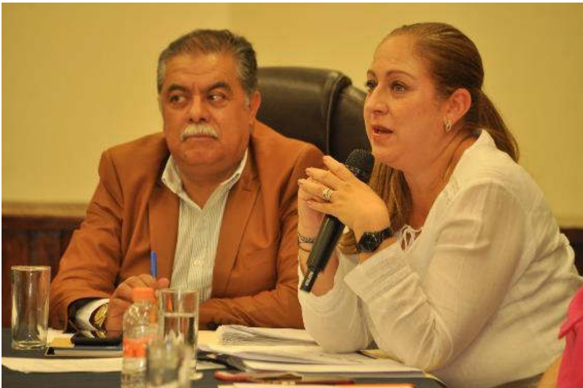
22 DE MARZO DE 2019