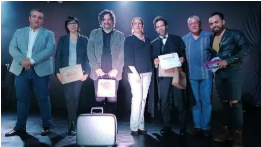
14 DE AGOSTO 2019