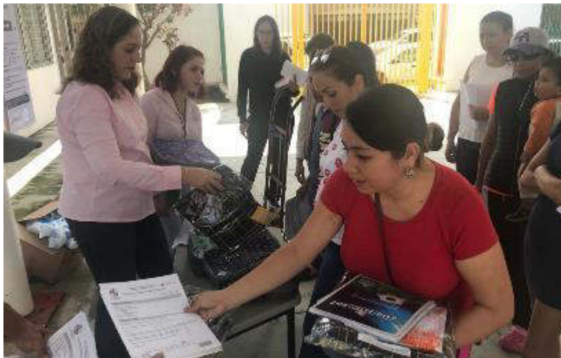
09 DE SEPTIEMBRE 2019