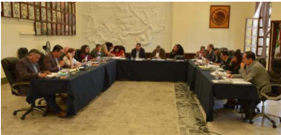
27 DE FEBRERO DE 2019 SESIONES ORDINARIA 04 Y EXTRAORDINARIA 11