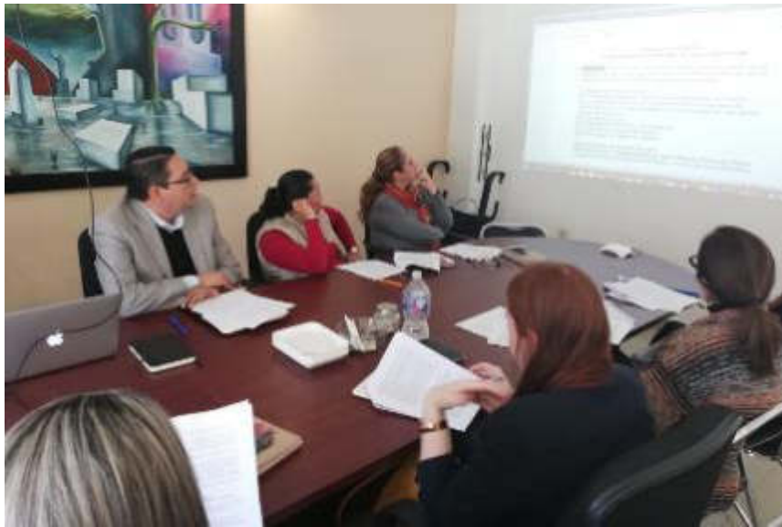
29 DE ENERO DE 2019