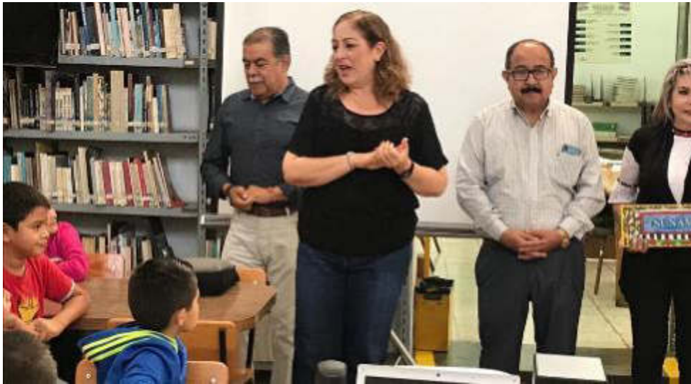
08 DE JULIO 2019