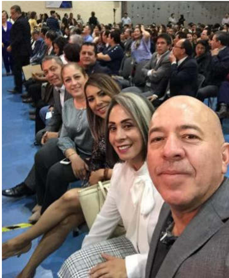
INFORME DEL RECTOR DEL CUSUR 24 DE ENERO DE 2017