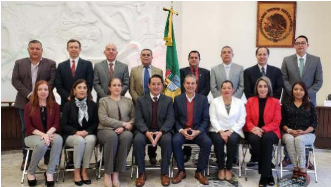
SESION SOLEMNE 03. 28 DE ENERO DE 2019