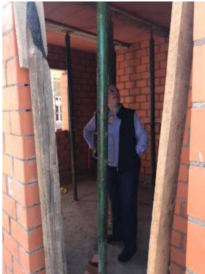
SUPERVICION DE OBRAS 09 DE ENERO 2019