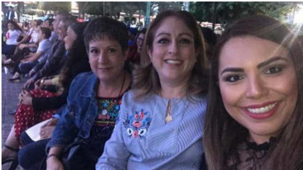
10 DE AGOSTO 2019