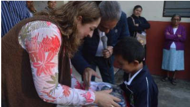
25 DE SEPTIEMBRE 2019