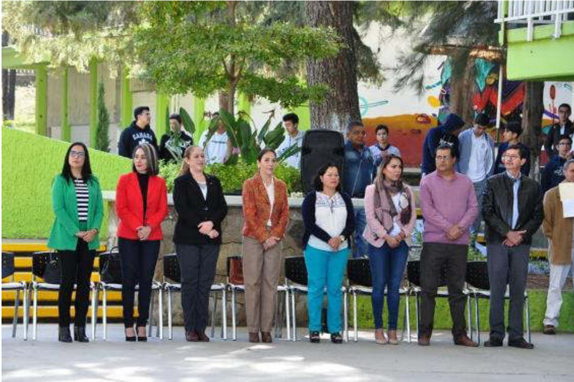
19 DE FEBRERO DE 2019 INAGURACION DEL DOMO DEL CBTIS 226