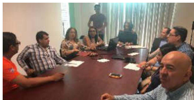
10 DE JULIO