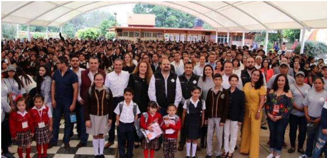
11 DE SEPTIEMBRE 2019