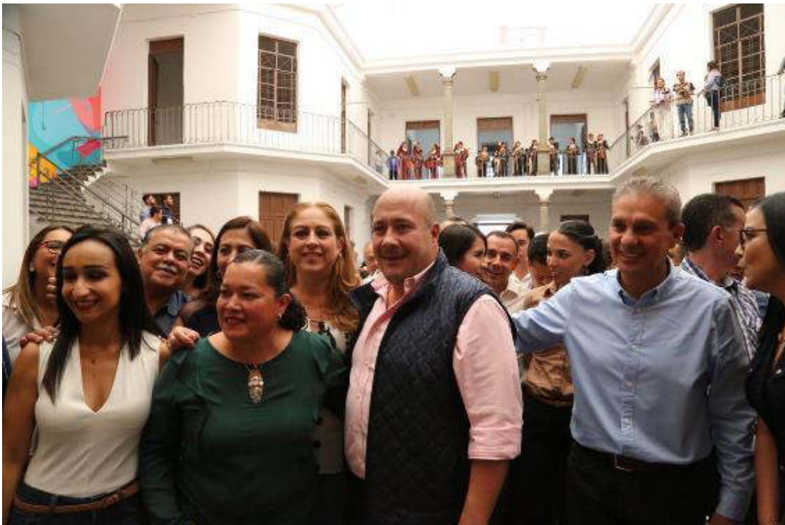
31 DE MARZO DE 2018. VISITA DEL GOBERNADOR ENRIQUE ALFARO