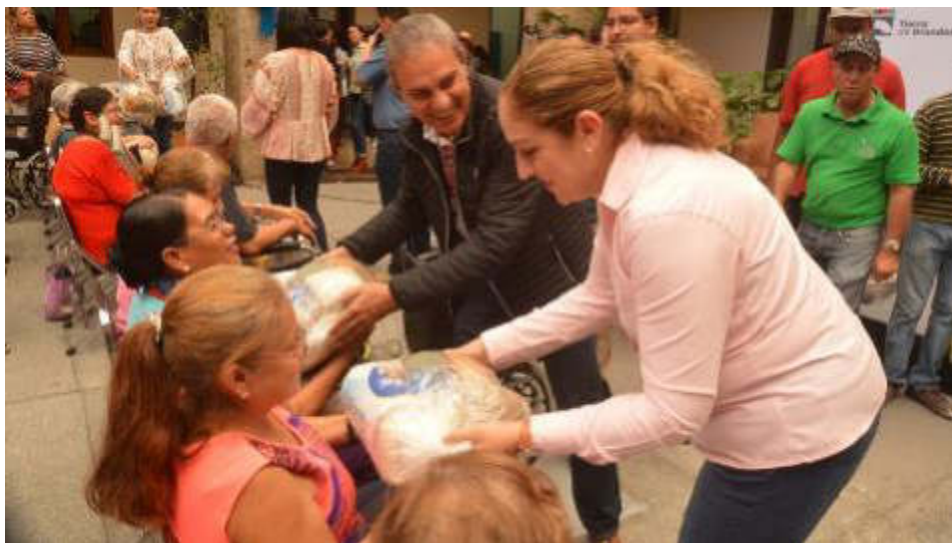
26 DE SEPTIEMBRE 2019