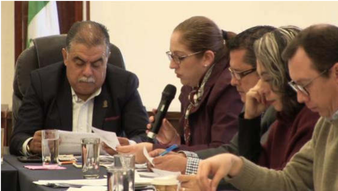
SESION ORDINARIA NO. 02