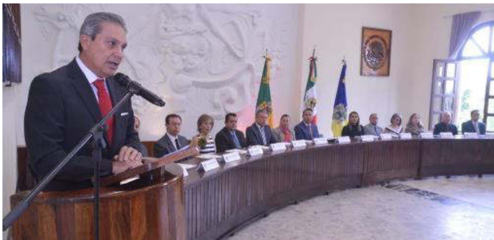
6 DE SEPTIEMBRE 2019