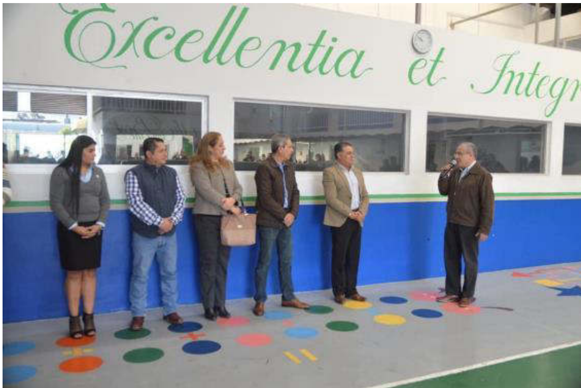
ACTO CIVICO 21 DE ENERO 2019