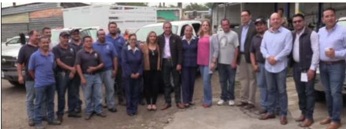
07 DE AGOSTO 2019