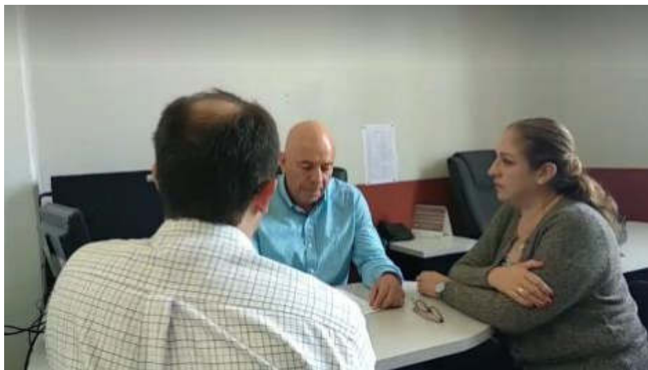
SESION 01 ORDINARIA