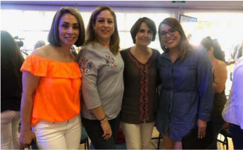
27 DE JULIO 2019