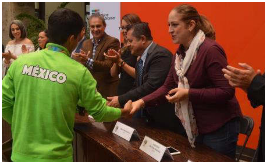
17 DE SEPTIEMBRE 2019