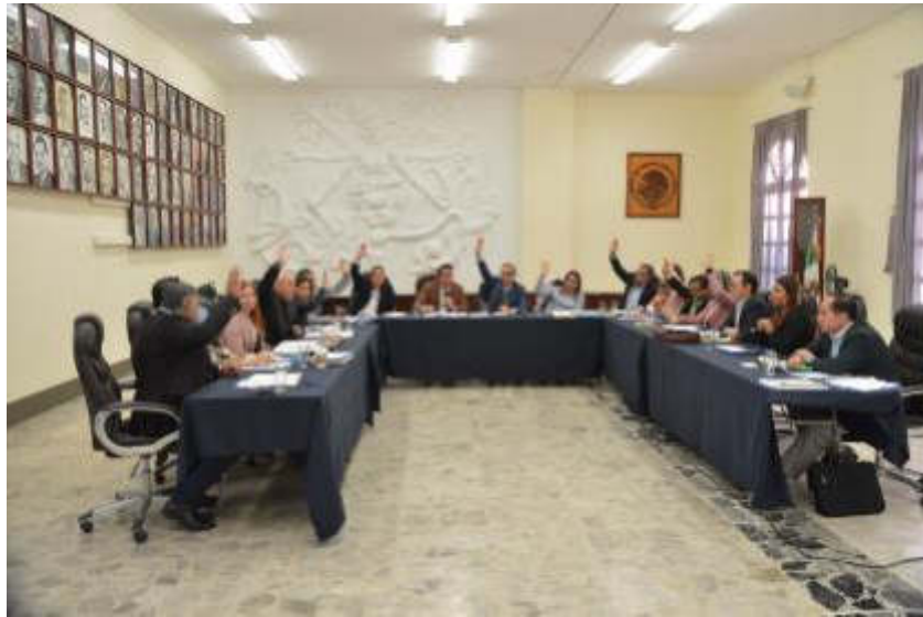
SESION EXTRAORDINARIA NO. 09