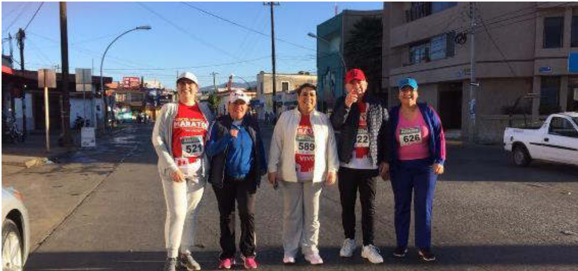
MEDIO MARATON. 27 DE ENERO 2019