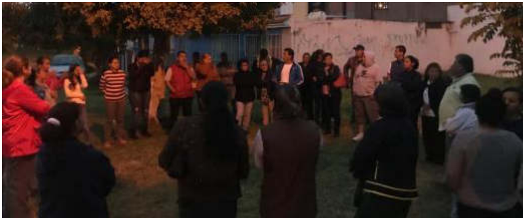
01 DE AGOSTO 2019