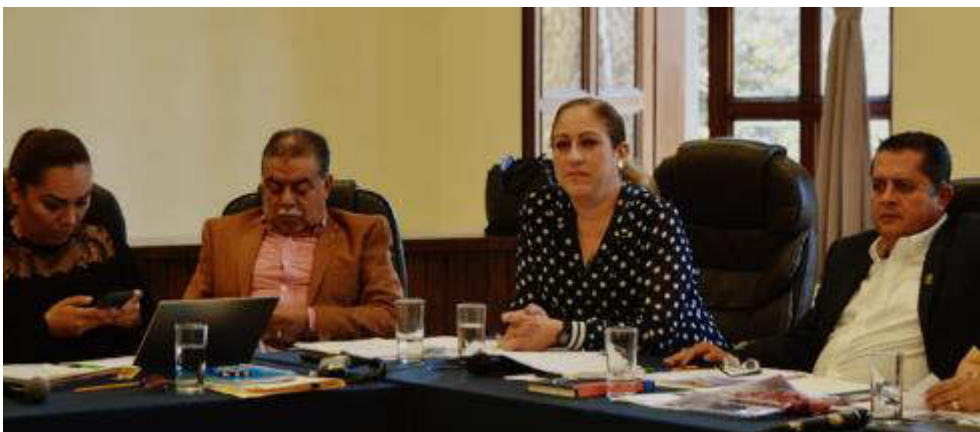
27 DE FEBRERO DE 2019 SESIONES ORDINARIA 04 Y EXTRAORDINARIA 11