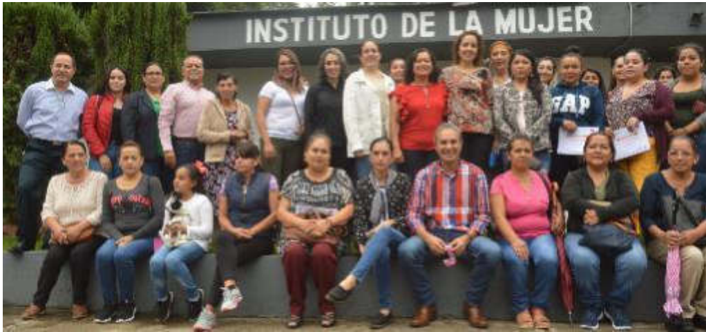
03 DE SEPTIEMBRE 2019