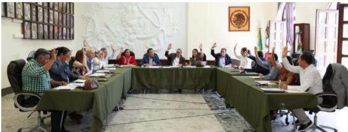
12 DE AGOSTO 2019