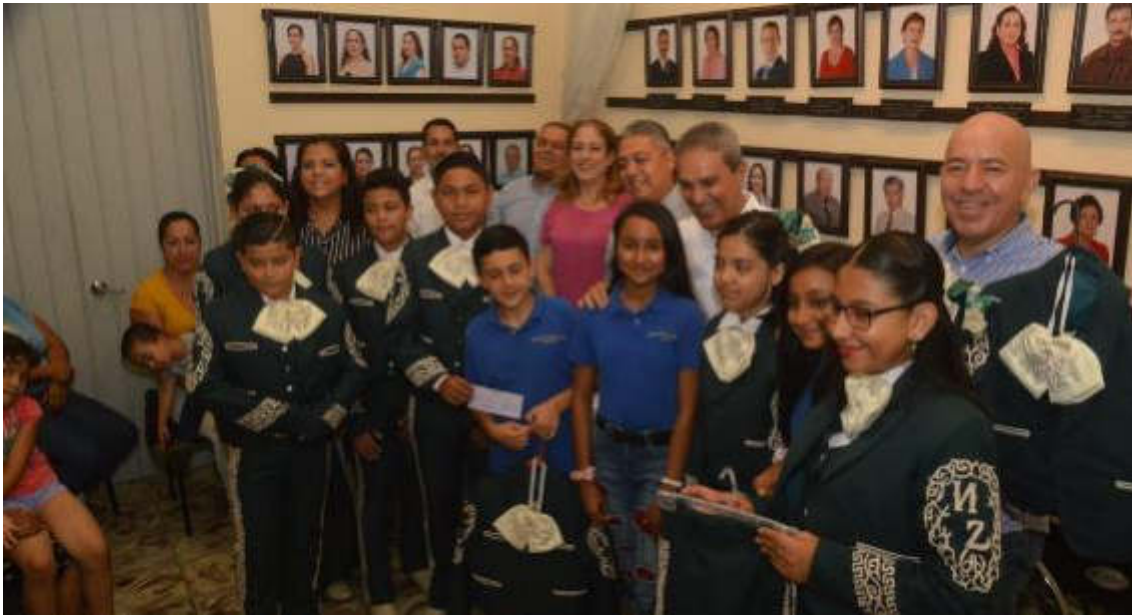
23 DE AGOSTO 2019