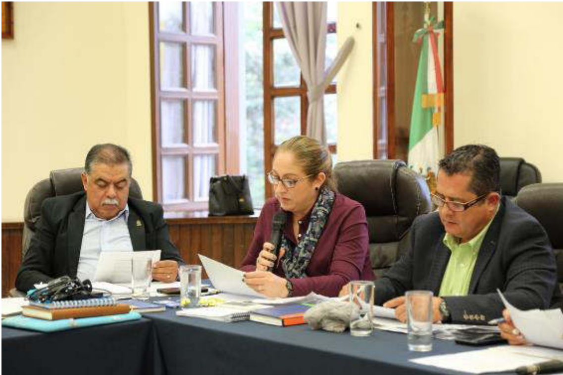
17 DE ENERO DE 2019 SESION ORDINARIA 03