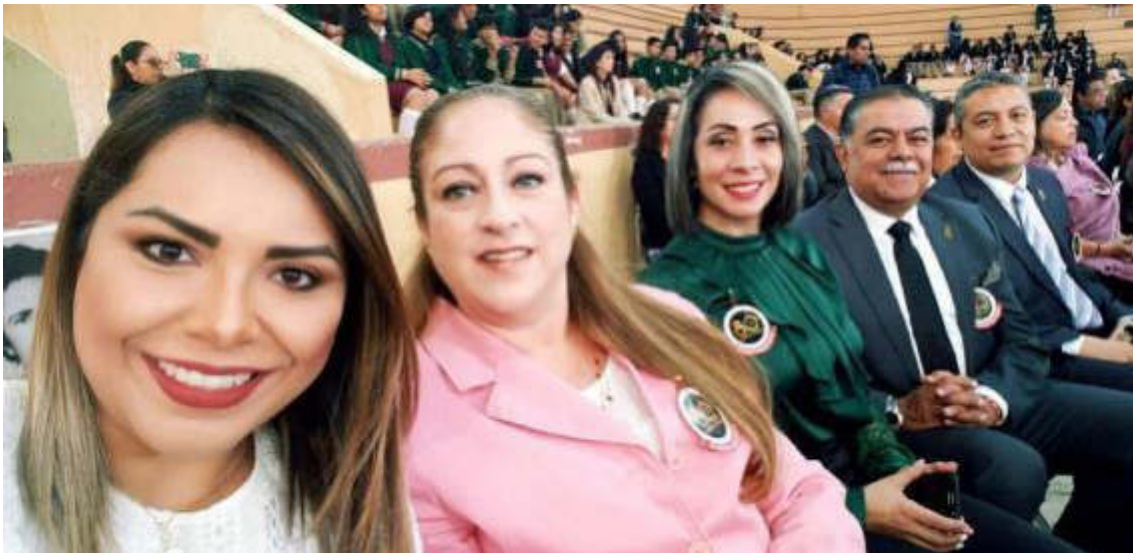
80 ANIVERSARIO DE LA ESCUELA SECUNDARIA BENITO JUAREZ 11 DE FEBRERO 2019