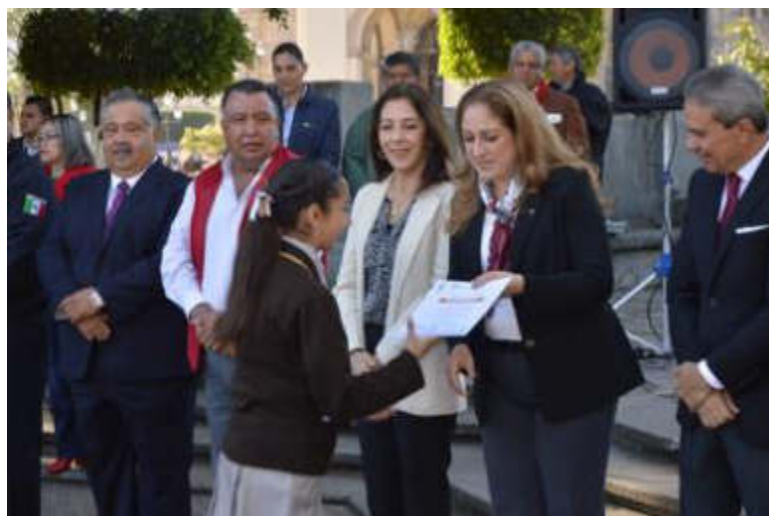
24 DE FEBRERO DE 2019