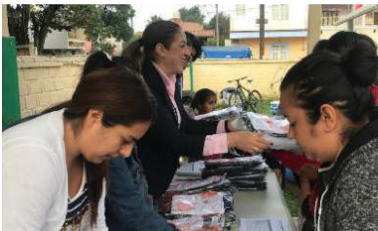
12 DE SEPTIEMBRE 2019