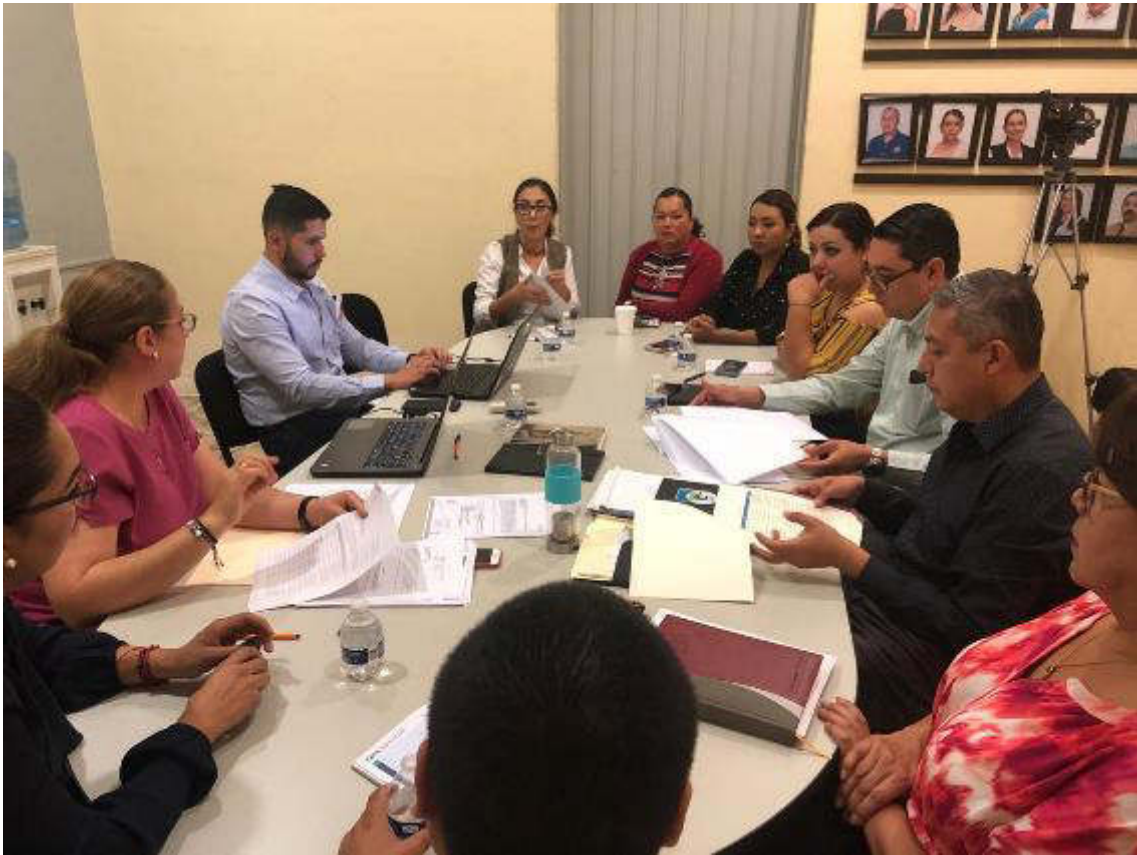
SESION 06 EXTRAORDINARIA 28 DE MARZO DE 2019