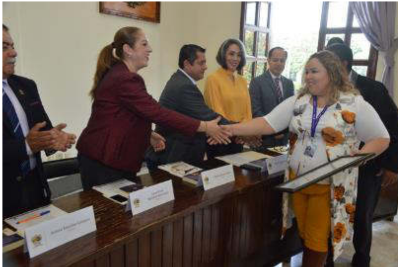
SESION SOLEMNE 01, 07 DE DICIEMBRE DE 2018