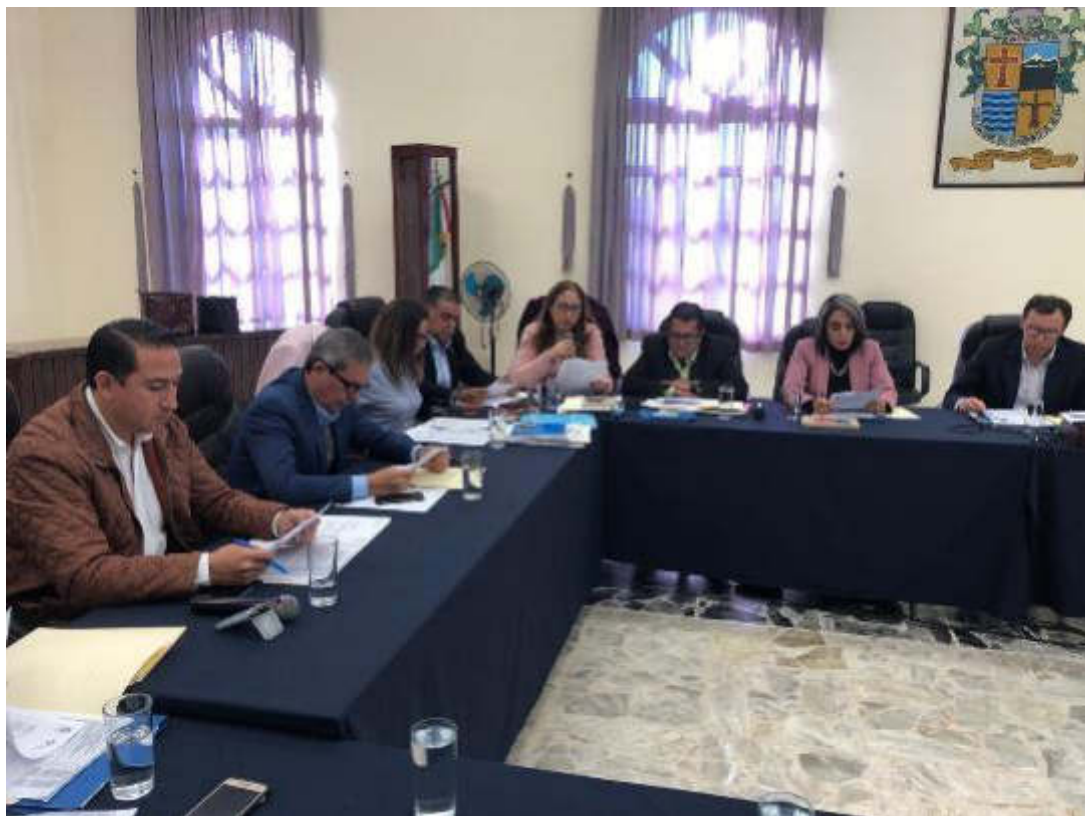
SESION EXTRAORDINARIA NO. 09