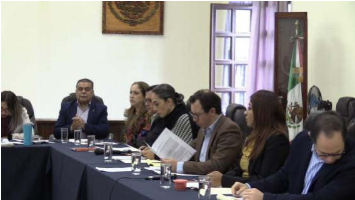
SESION EXTRAORDINARIA NO. 10