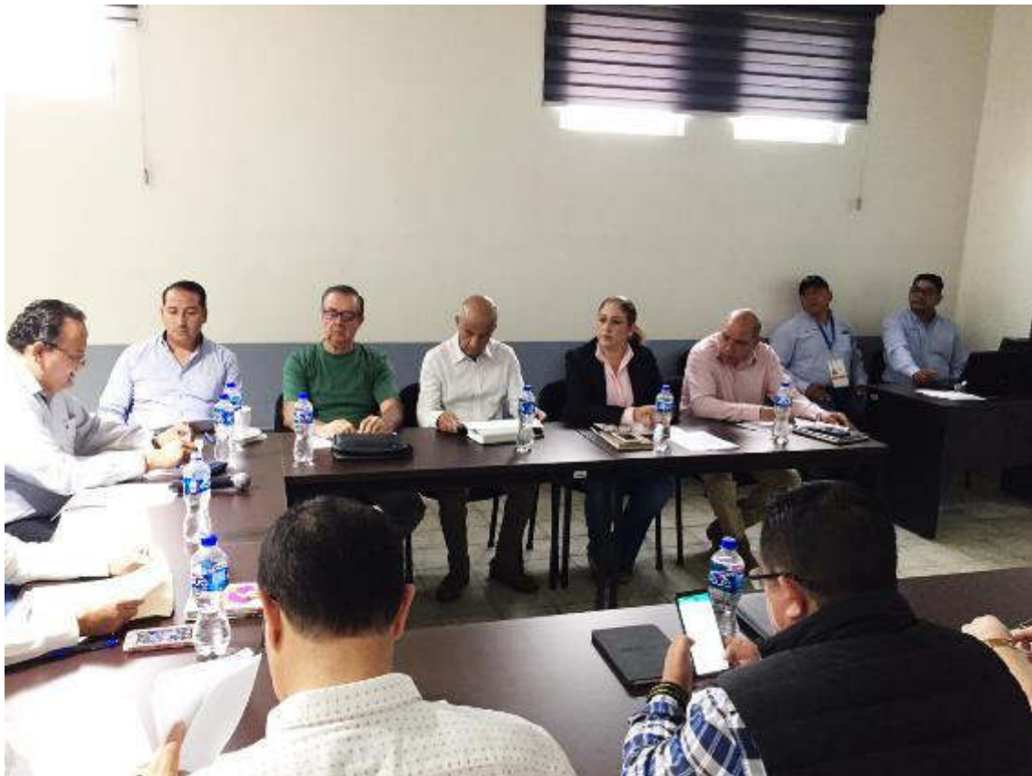
12 DE SEPTIEMBRE