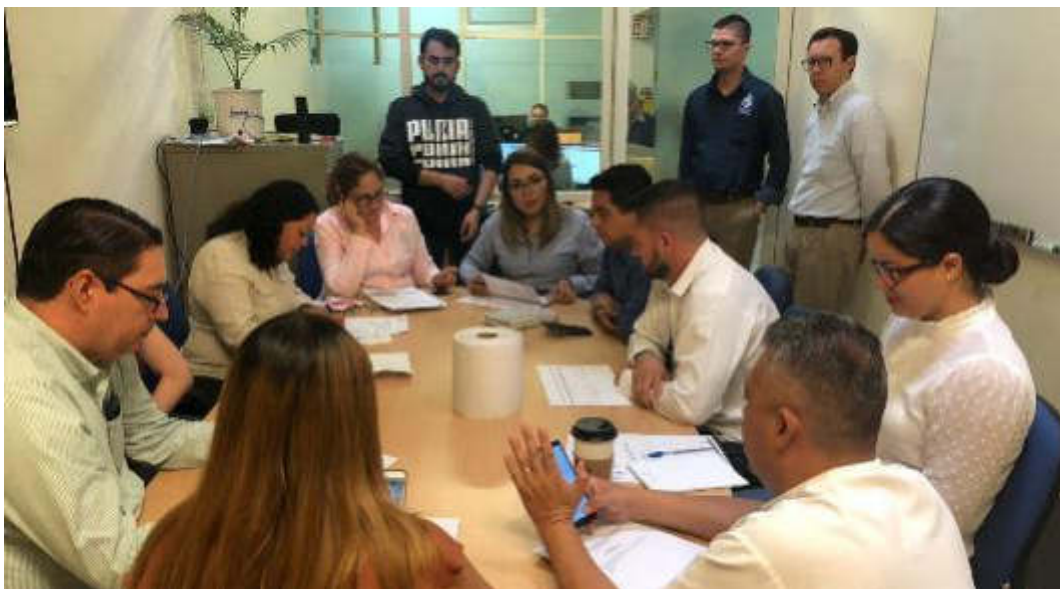
09 DE SEPTIEMBRE