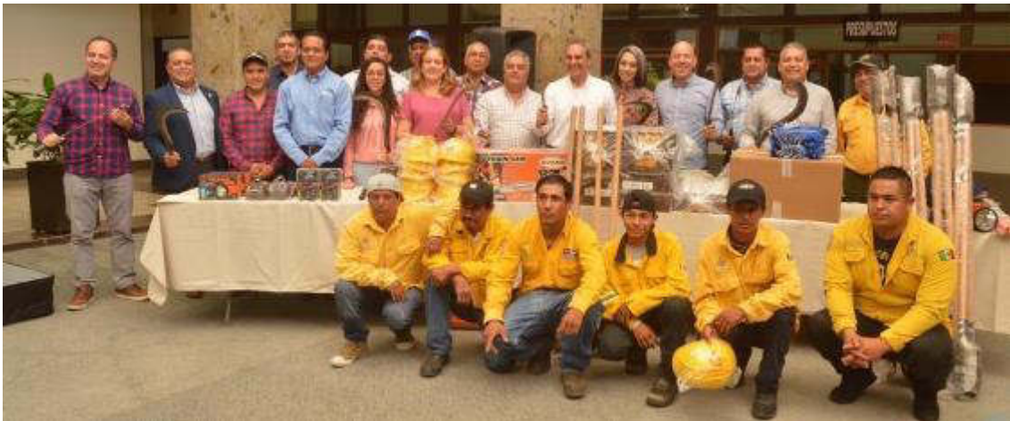
23 DE AGOSTO 2019