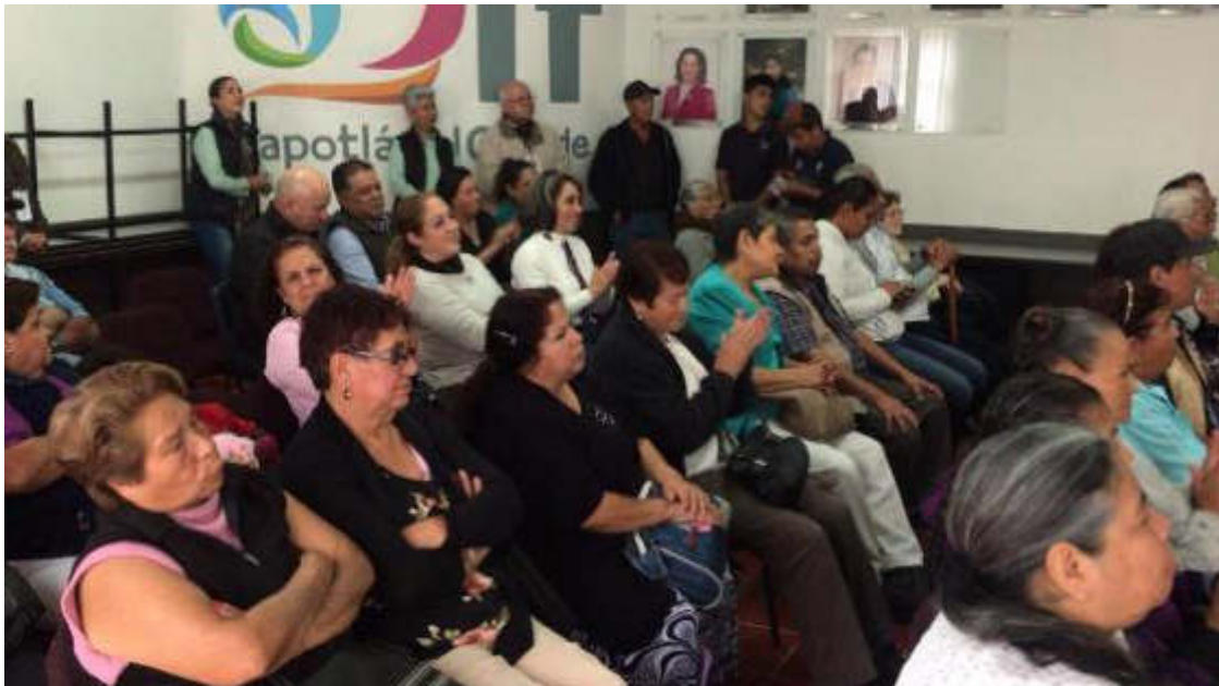
ENTREGA DE APOYOS A ADULTOS MAYORES 18 DE ENERO 2018.