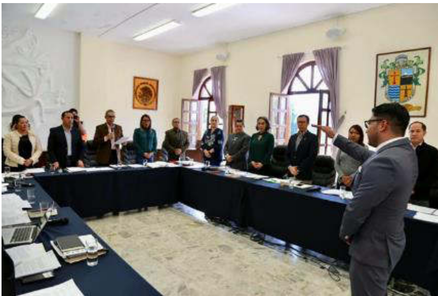
SESION EXTRAORDINARIA 08, 11 DE DICIEMBRE 2018