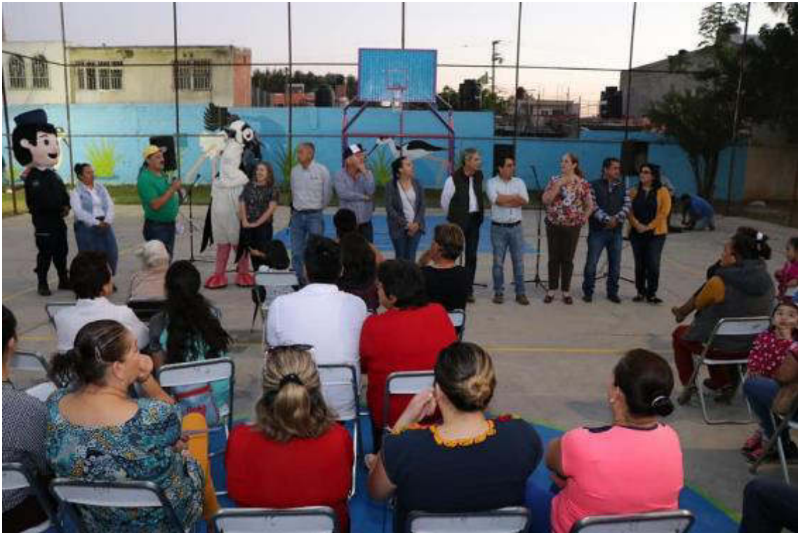
05 DE MARZO DE 2019. INAGURACION DE LOS TRABAJOS REALIZADOS EN LA COLONIA ESCRITORES