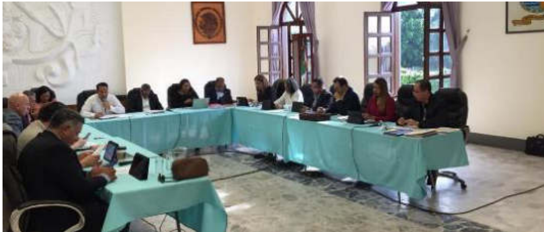
11 DE SEPTIEMBRE 2019