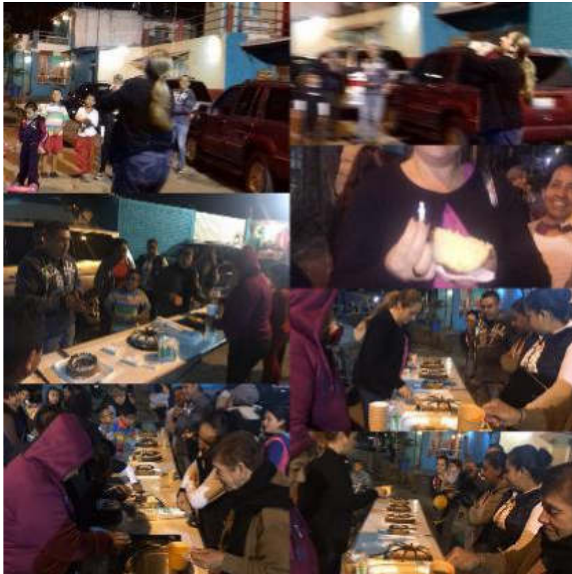
15 DE ENERO 2019. CONVIVENCIA CON VECINOS DE GONZALEZ ORTEGA