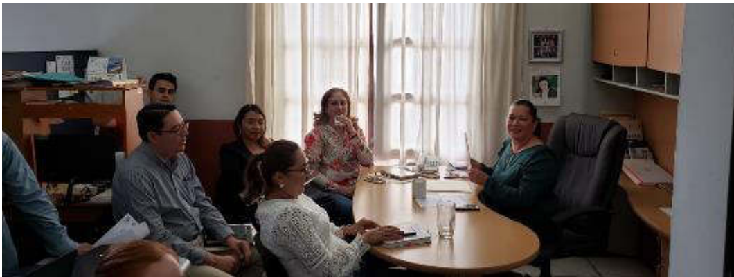
11 DE JULIO