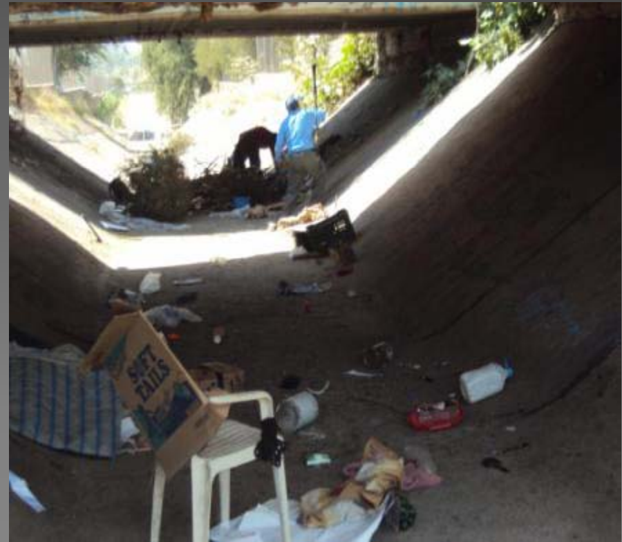
LIMPIEZA DE CANAL DE LA COLONIA CONSTITUYENTES