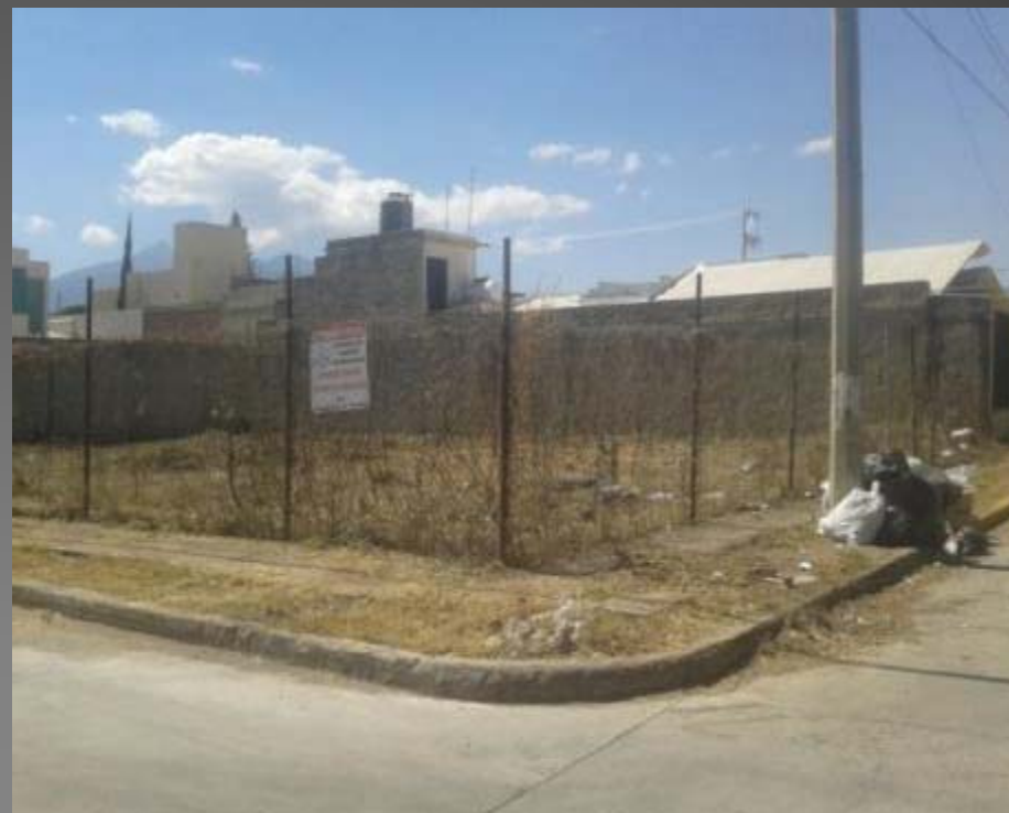
LIMPIEZA DE LOTE CALLE PINO ESQ. ZAUCE DE LA COL. SAN PEDRO