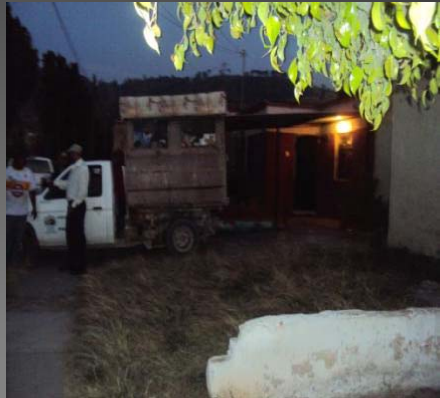
LIMPIEZA DE LA COLONIA SOLIDARIDAD