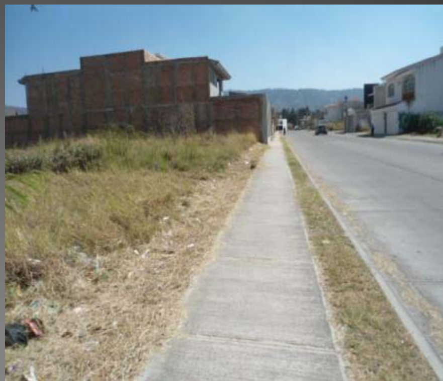
COL. COTO PORTUGAL LIMPIEZA DE BANQUETAS