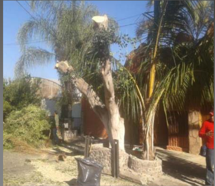
PODA DE LAUREL EN PRIVADA DE MEDELLIN N° 12