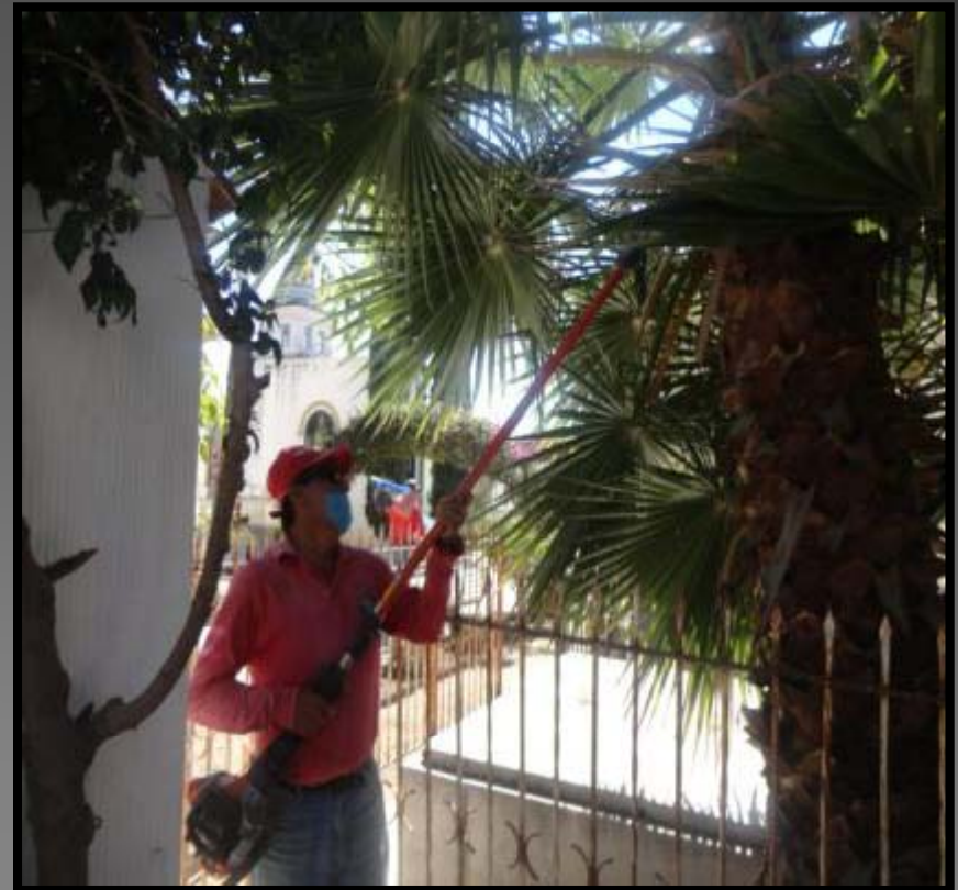
PODA DE PALMERAS DEL CEMENTERIO MUNICIPAL