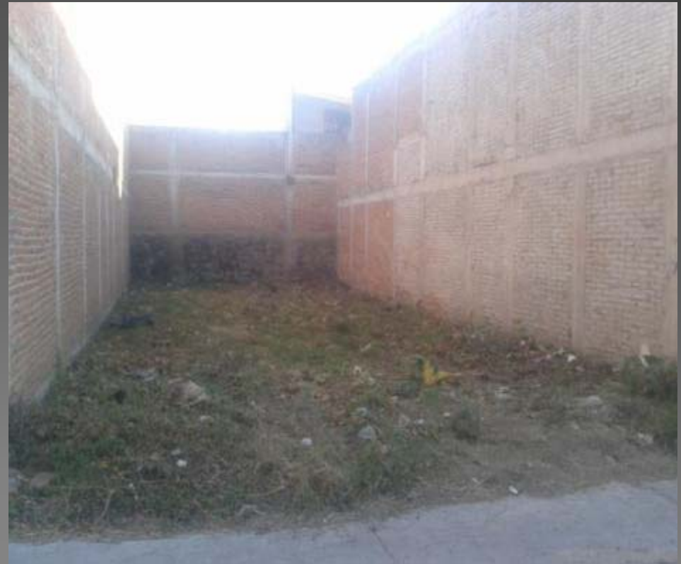
LIMPIEZA DE LOTE EN LA COL. ESQUIPULAS