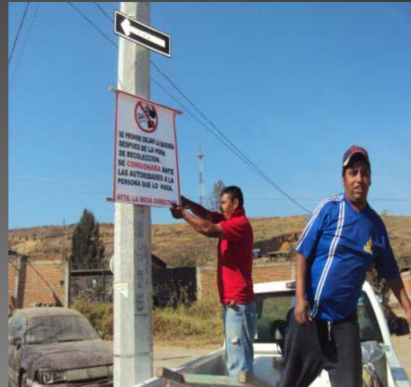
COLOCACION DE LETREROS DE NO TIRAR BASURA COL. OTILIO MONTAÑO