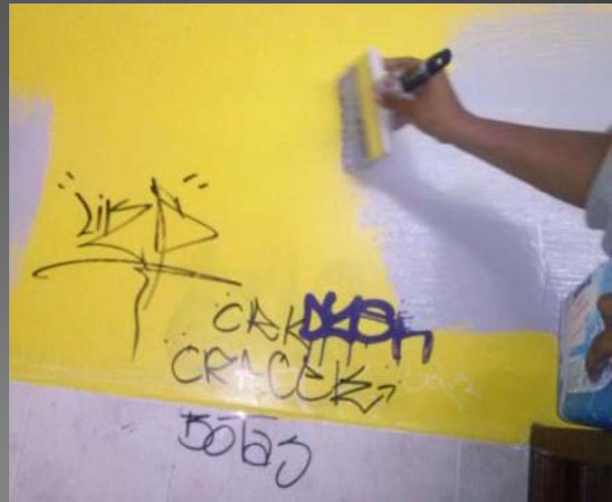
PINTA DE BAÑOS GRAFITEADOS DEL PARQUE ECOLOGICO LAS PEÑAS