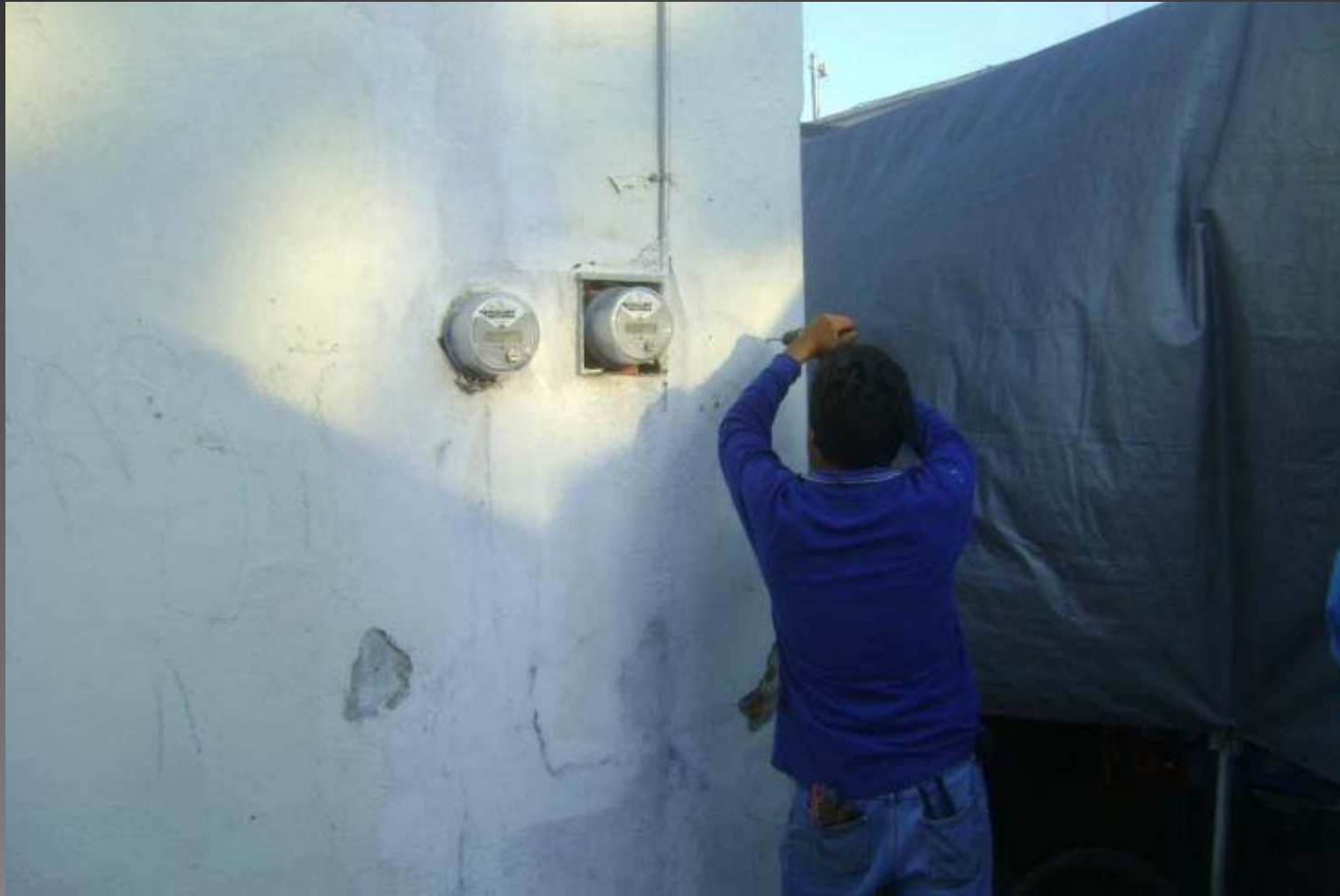
DETENCION DE FALLAS DE UNIDAD DEPORTIVA LAS PEÑAS