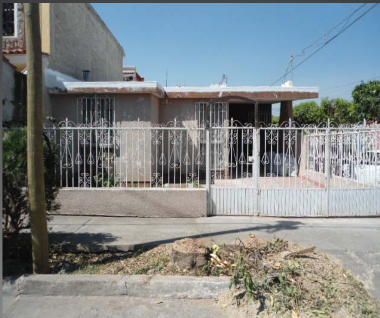
COL. DEL ISSSTE RETIRO DE ARBOL