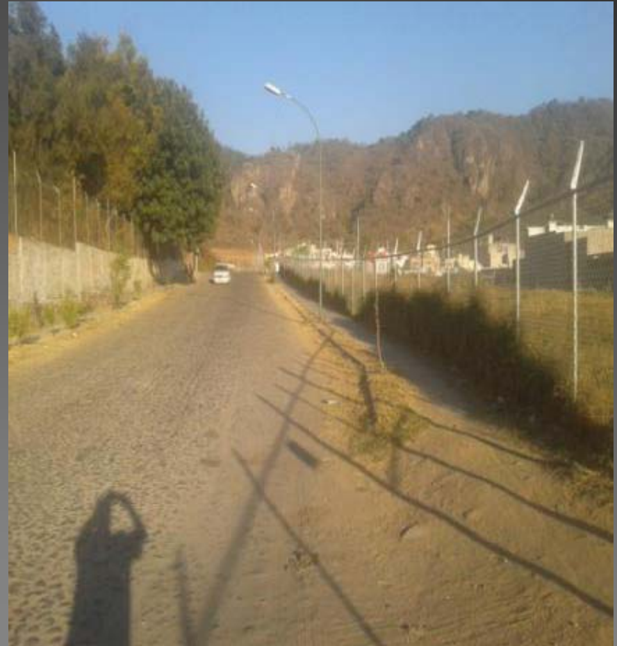
LIMPIEZA DE BANQUETAS CALLE GORDOA