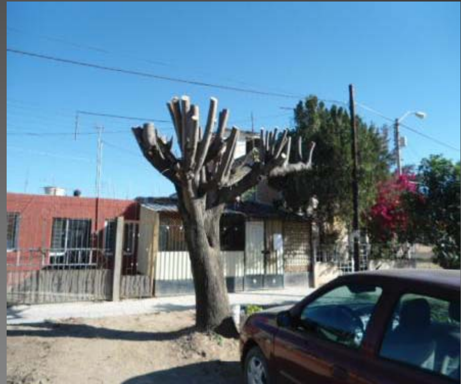
PODA DE ARBOL EN EL ESTACIONAMIENTO COL. PINTORES