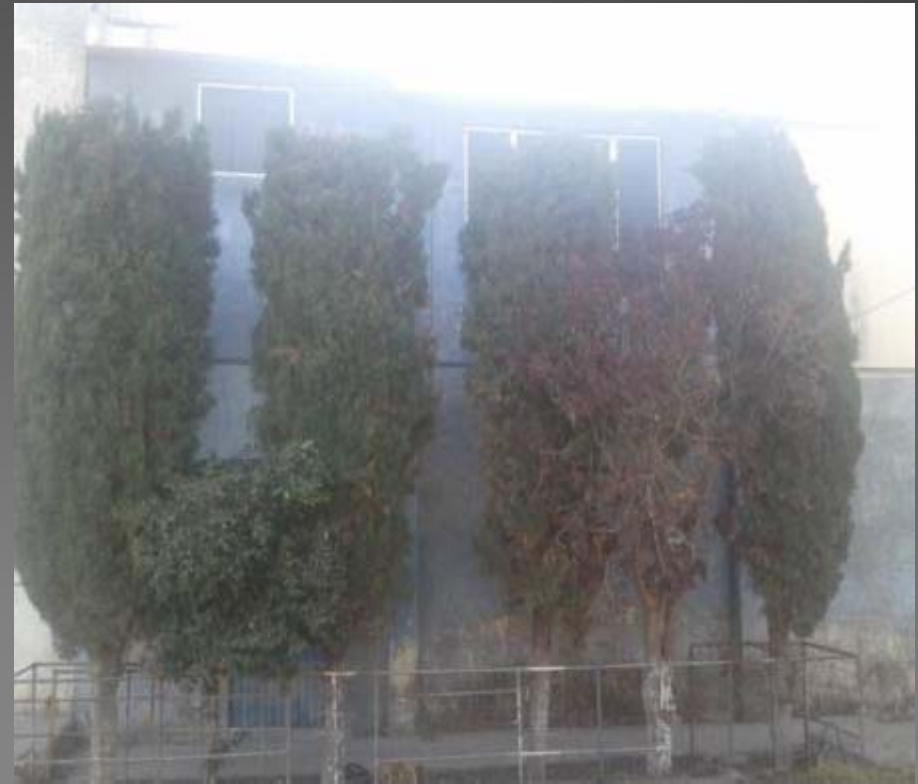
PODA CON EL PELICANO EN EL AREA VERDE DE LA COL. PINTORES