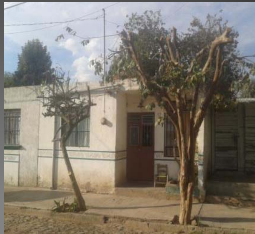
PODA EN AGUSTIN YAÑES No 12 COL. PROVIPO