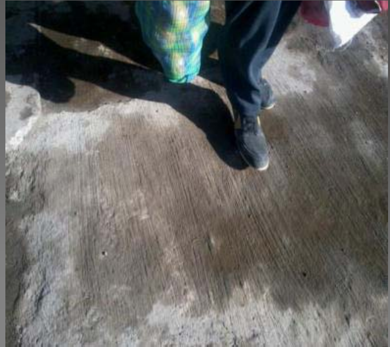
REPARACION DE BANQUETA DEL TIANGUIS