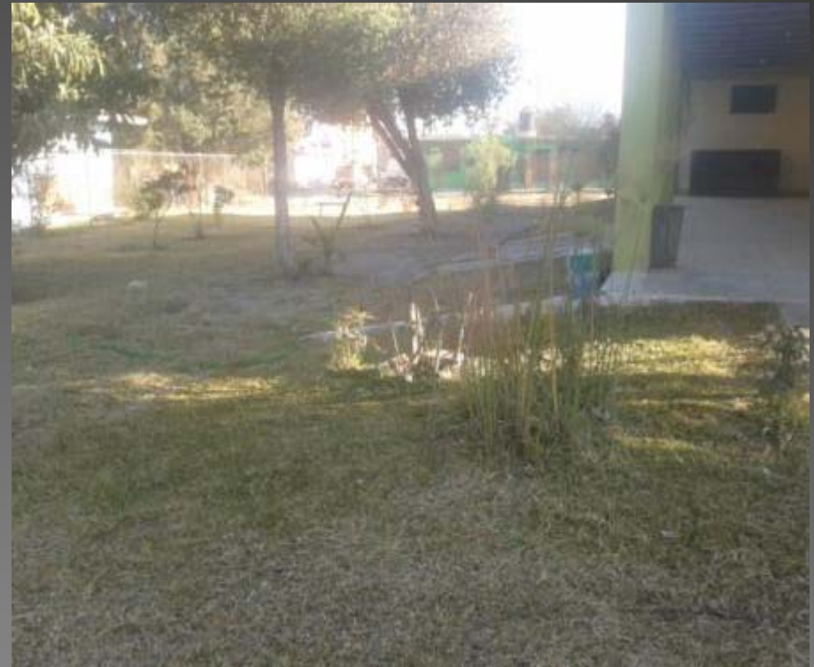
PODA PASTO EN LA CAPILLA DE LA COL. 19 DE SEPTIEMBRE