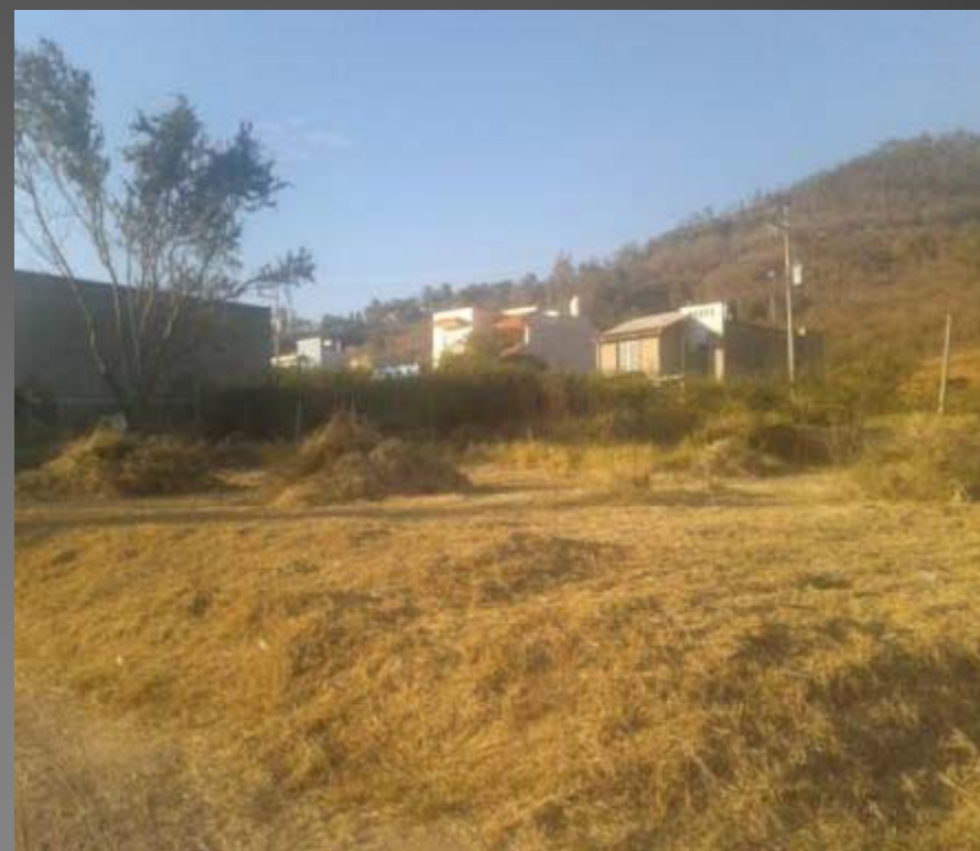
PODA DE PASTO EN LA COL. ACFE ADRA