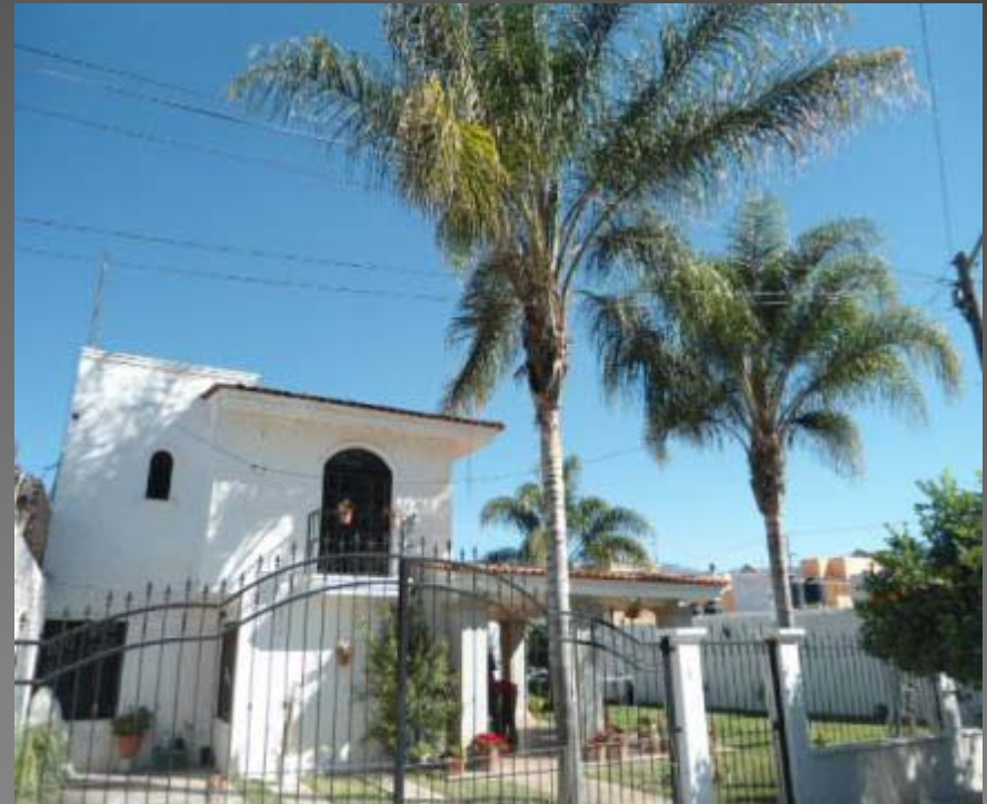
PODA DE PALMAS COL. LA CEBADA CALLE ALAMILLOS Nº 76