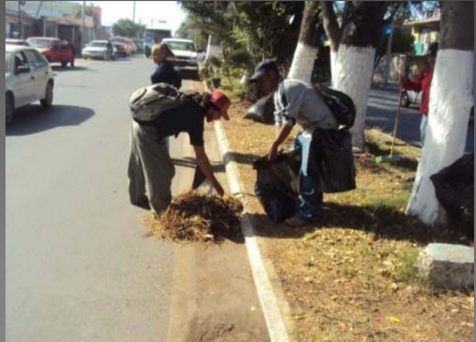
LIMPIEZA AV. CARLOS PAEZ STILL