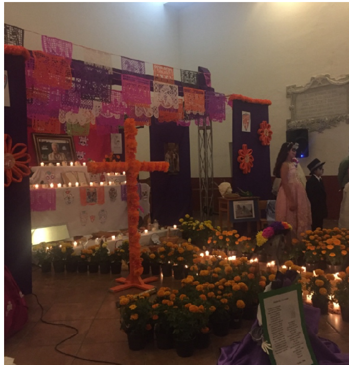
Altar de muertos en sala clemente Orozco de la presidencia