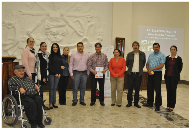
CONVERSATORIO MUNICIPAL "CULTURA DE DISCAPACIDAD. CONSTRUYENDO CIUDADES INCLUSIVAS". EN SALA DE AYUNTAMIENTO.