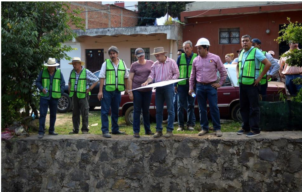
Gira de trabajo por las diversas obras del municipio