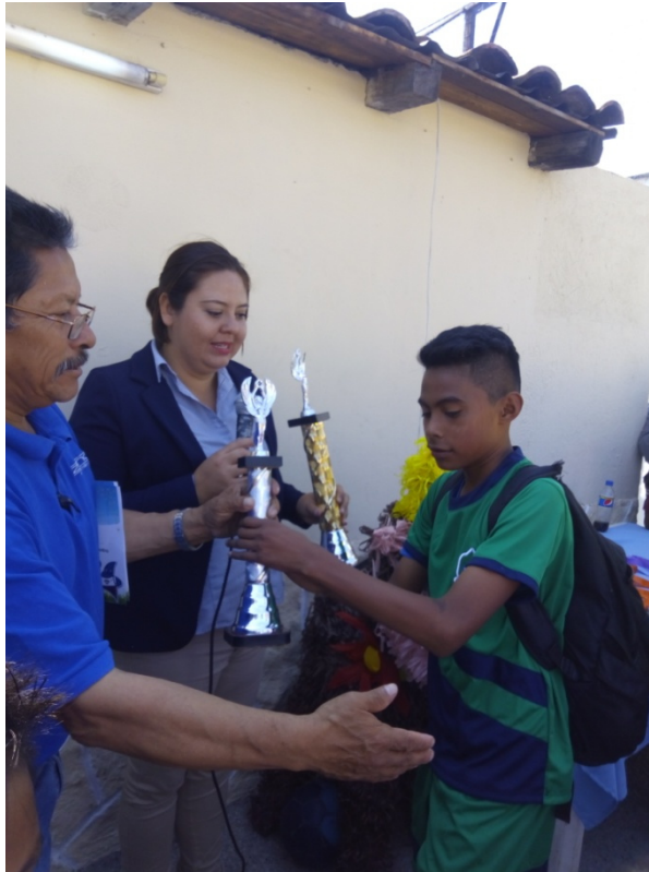
ENTREGA DE TROFEOS "TORNEO DE LAS ESTRELLAS"