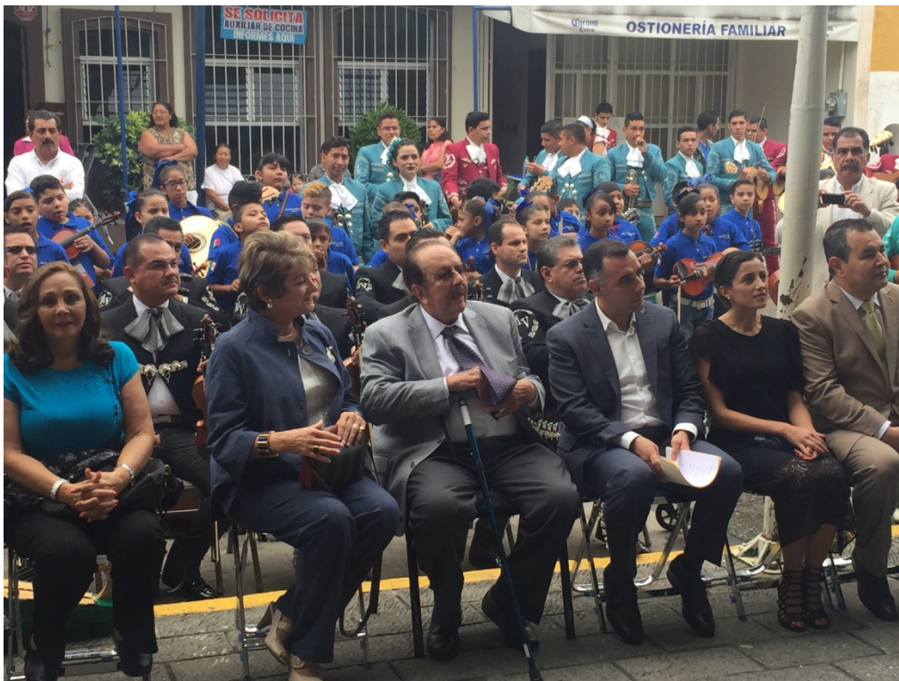
DEVELACION DE LA PLACA DE LA ESCUELA DE LA MUSICA RUBEN FUENTES