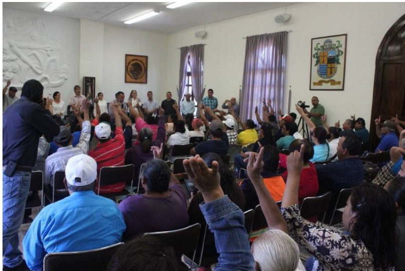
REUNION EN SALA DE AYUNTAMIENTO CON COMERCIANTES AMBULANTES