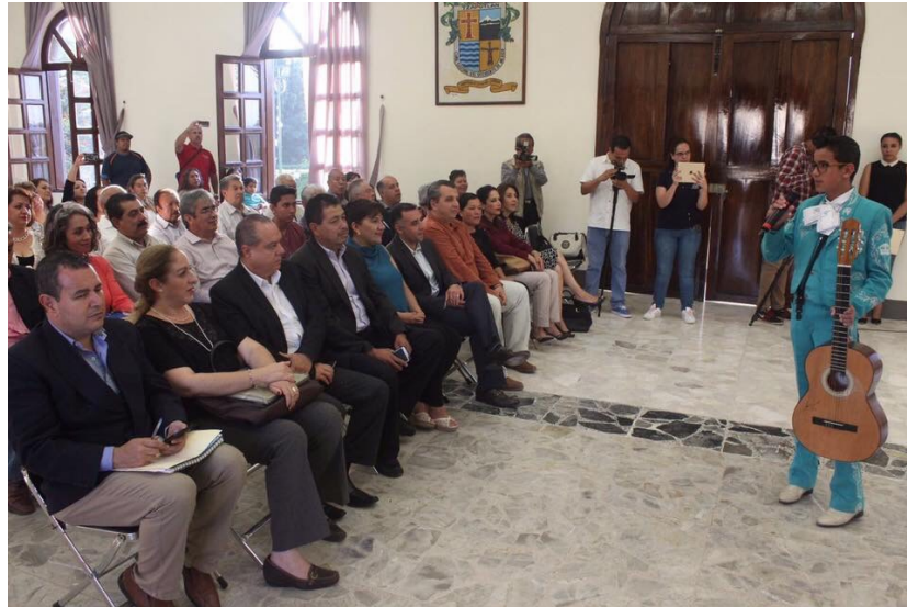
DEVELACION DE LETRAS DORADAS DEL COMPOSITOR RUBEN FUENTES