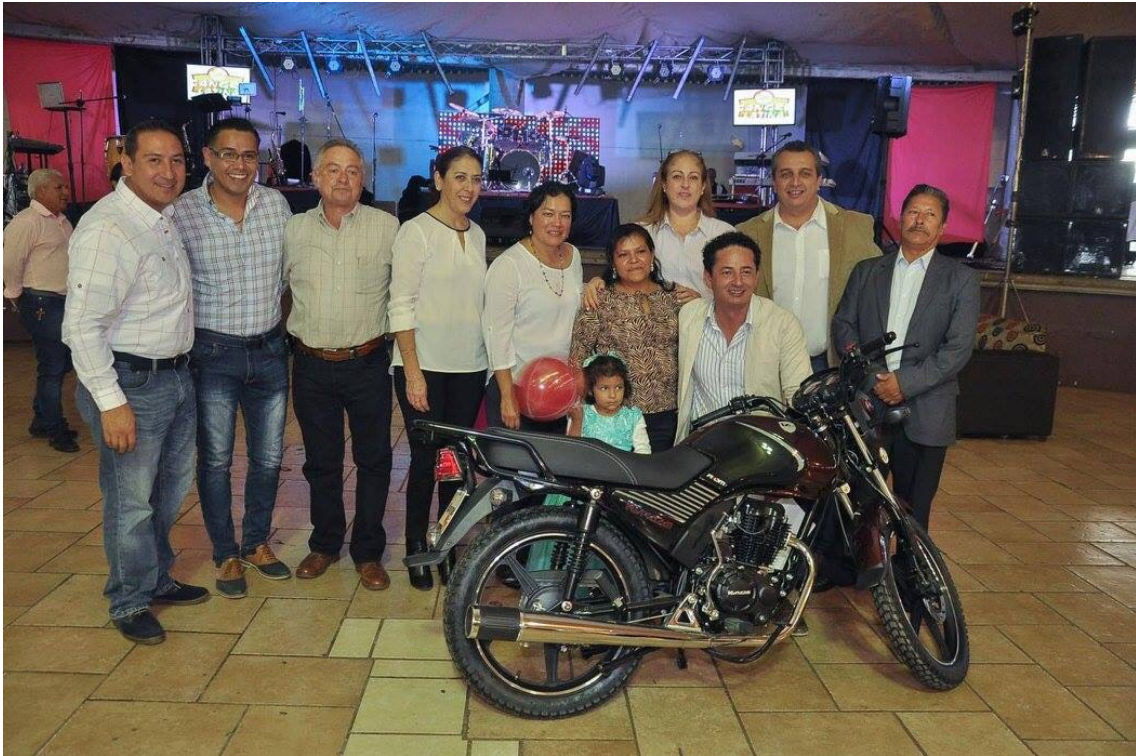
POSADA 2016 DEL AYUNTAMIENTO