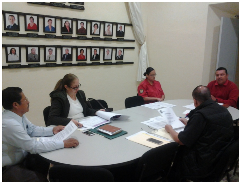
SESION ORDINARIA DE TRANSITO Y PROTECCION CIVIL