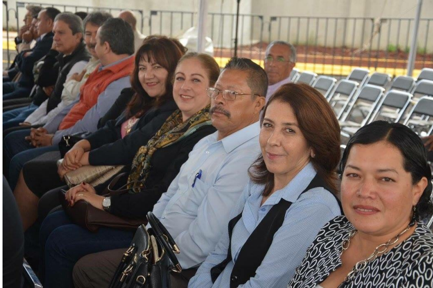
INAUGURACION DE INSTALACIONES DE LA POLICIA ESTATAL