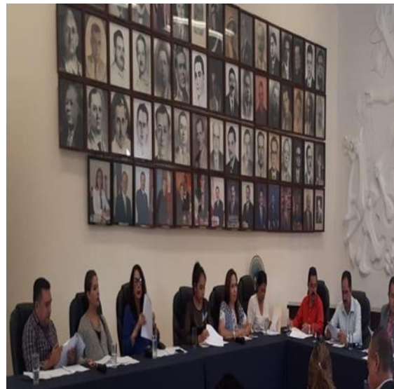
SESIÓN EXTRAORDINARIA NÚMERO 65