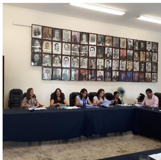
SESIÓN EXTRAORDINARIA NÚMERO 64