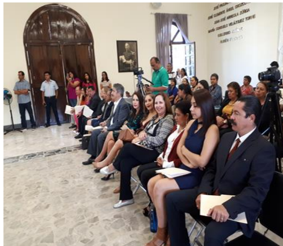
SESIÓN EXTRAORDINARIA 61 CABILDO INFANTIL