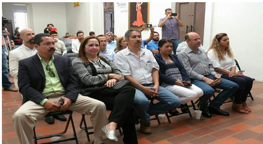
FIRMA DEL CONVENIO DE COLABORACIÓN CON LA ASOCIACIÓN MEXICANA DE TURISMO DE AVENTURA Y ECOTURISMO A.C., PARA FAVORECER LA INVERSIÓN DE EMPRESAS Y NEGOCIOS DEDICADOS AL TURISMO DE AVENTURA.