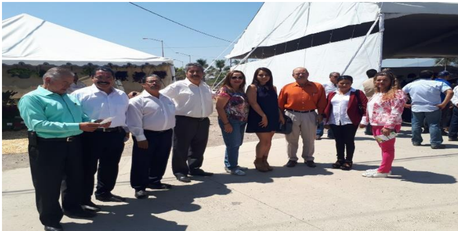
INAUGURACIÓN DE LA 11 ONCEAVA “EXPO AGRICOLA JALISCO”, IMPULSANDO EL DESARROLLO AGROALIMENTARIO DE ZAPOTLÁN EL GRANDE, JALISCO.