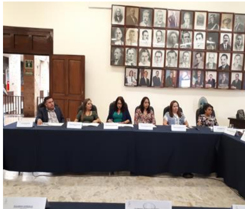
SESIÓN EXTRAORDINARIA 60