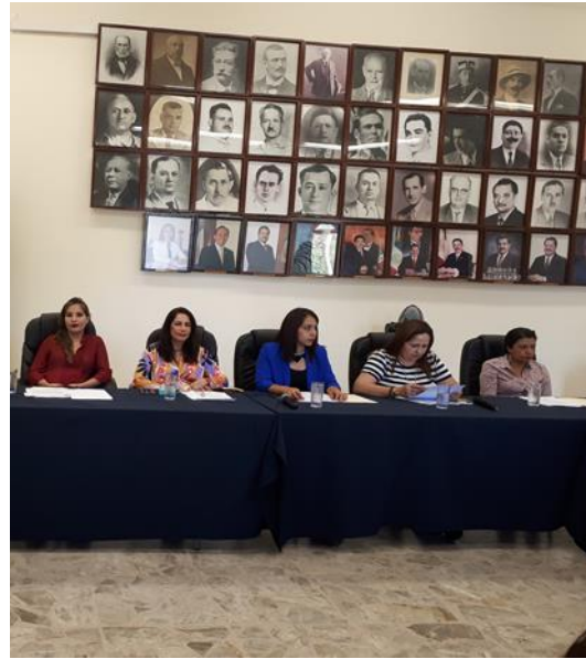
SESIÓN EXTRAORDINARIA 63