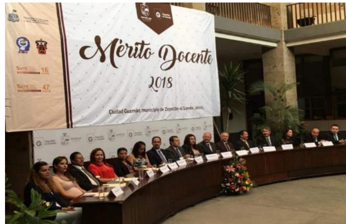
SESIÓN SOLEMNTE DE AYUNTAMIENTO NÚMERO 11