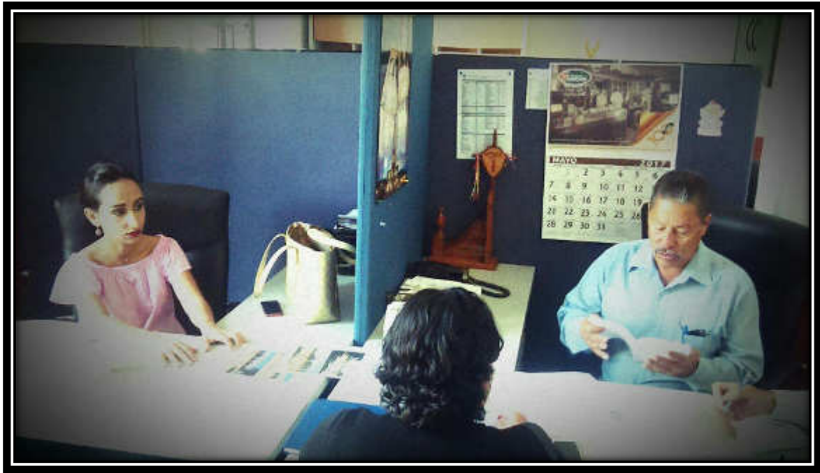
MÉRITO DOCENTE 2017 Fecha: 11 de Mayo del Año 2017.