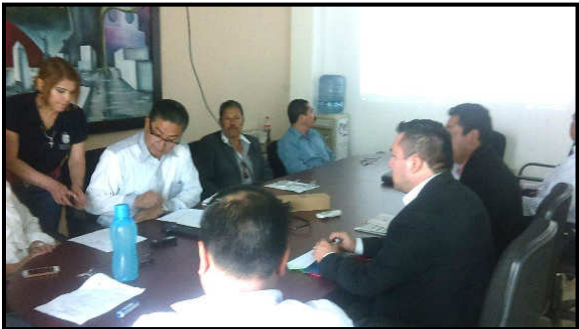
SESIÓN ORDINARIA DE LA COMISIÓN EDILICIA DE TRANSITO Y PROTECCIÓN CIVIL, PARA TRATAR ASUNTOS VARIOS RELACIONADOS DE LA MATERIA.