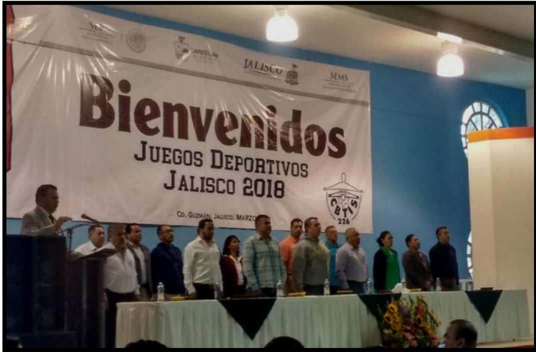
21 de Marzo de 2018 Juegos Deportivos Ahora de la UEMSTIS, en su 4° Edición