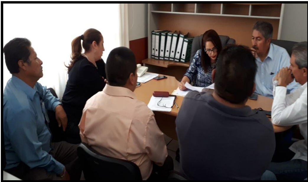
Sesión Ordinaria No. 3 del 28 de Febrero de 2018