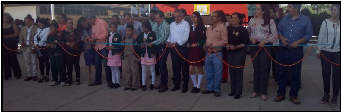
08 de Marzo de 2018 Inauguración de Domo Secundaria Benito Juárez