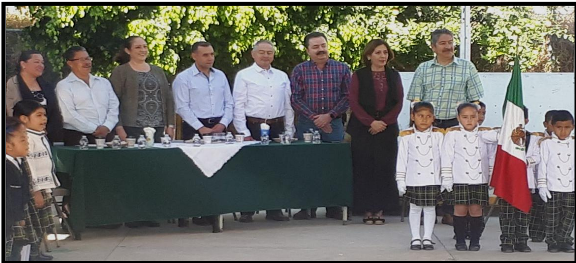
06 de Marzo Inauguración de Domo en el Kinder Amado Nervo en la Colonia Insurgentes.