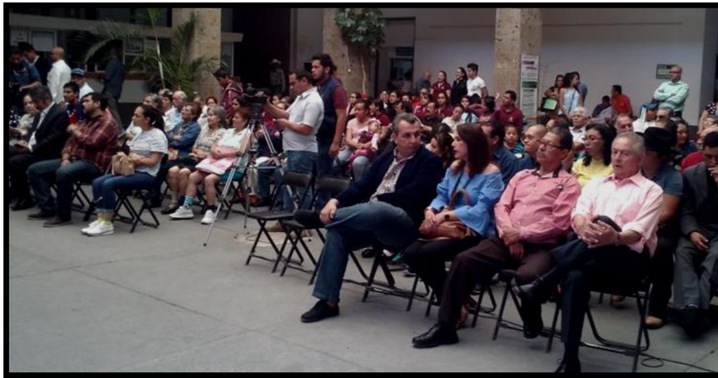
21 de Marzo de 2018, Dia Mundial del Síndrome de Down