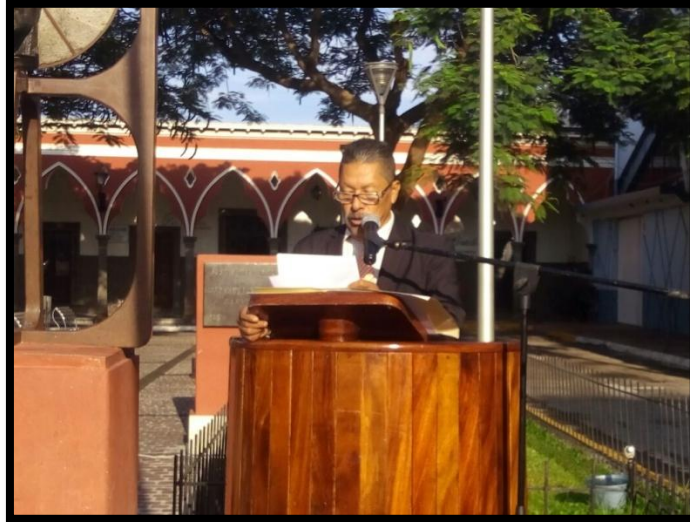
Regidor presidente de la comisión edilicia permanente de deportes, recreación y atención a la juventud 2018.