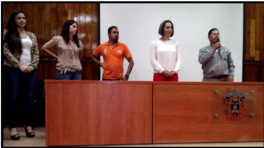
07 de Marzo De 2018 Entrega de Mochilas con Útiles a Jóvenes de Secundaria de la Escuela de Canotaje de Alto Rendimiento Dentro de las Instalaciones del Cusur.