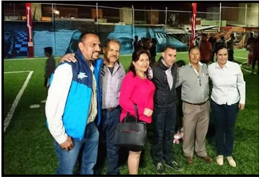
Inauguración de Parque en la Colonia el Nogal