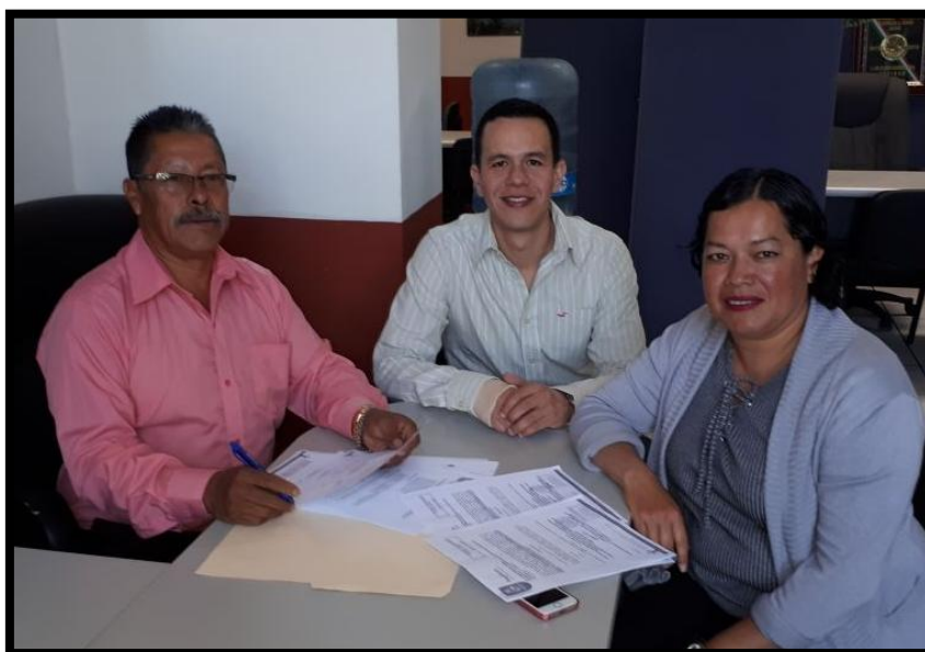
Sesión Ordinaria de 09 de Enero de 2018