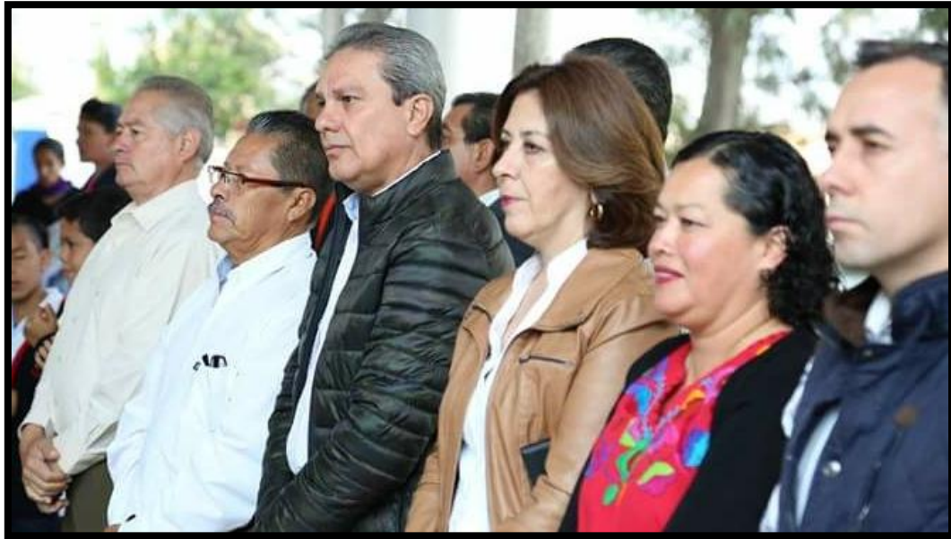
05 de Marzo de 2018 Inaguracion de Domo Escolar en la Primaria "Ricardo Flores Magon".