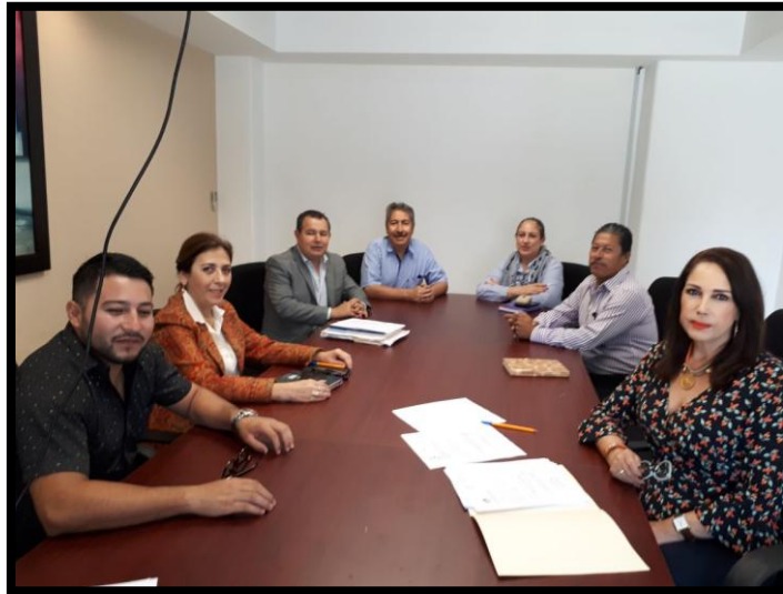
Sesión Ordinaria No. 4 del 01 de Marzo de 2018