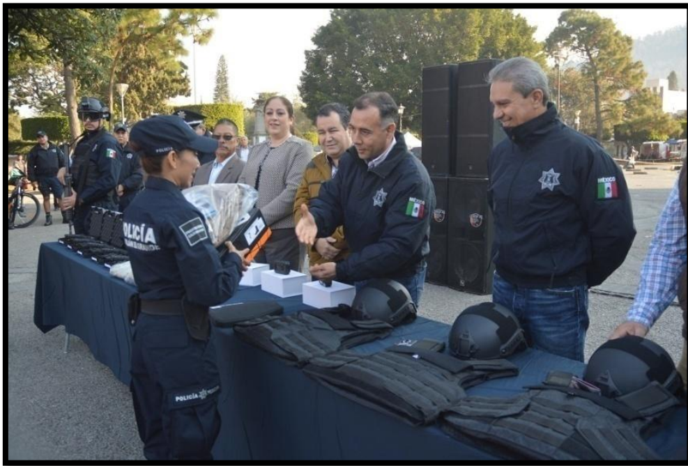
Día del Policía 02 de Enero de 2018.