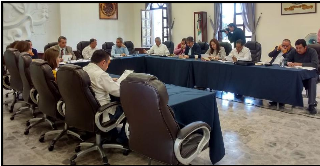
Sesión Pública Extraordinaria de Ayuntamiento No. 58