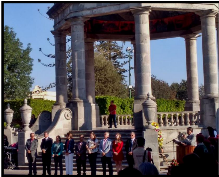
21 de Marzo de 2018, 212° aniversario del Natalicio de Don Benito Juárez García