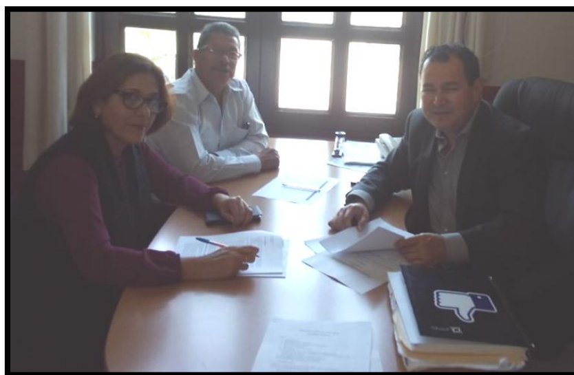
Sesión Ordinaria de 06 de Marzo de 2018.