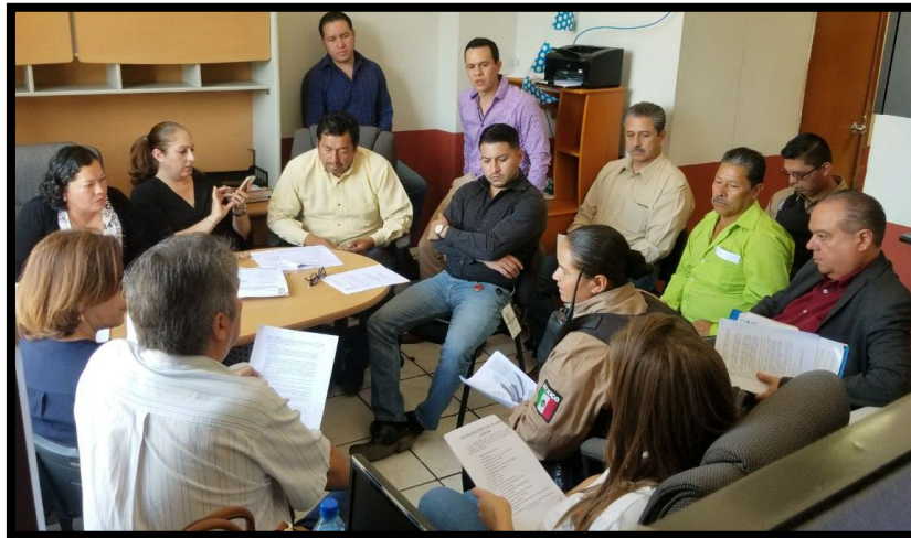
Sesión Ordinaria de 16 de Marzo de 2018.