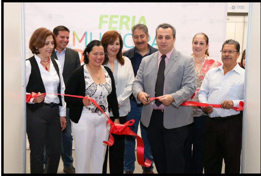
Feria Municipal de Empleo Municipal 23 de Febrero de 2018.