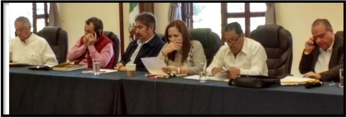
Sesión Pública Extraordinaria de Ayuntamiento No. 57