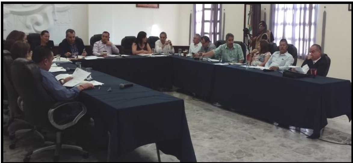
Sesión Pública Extraordinaria de Ayuntamiento No. 56