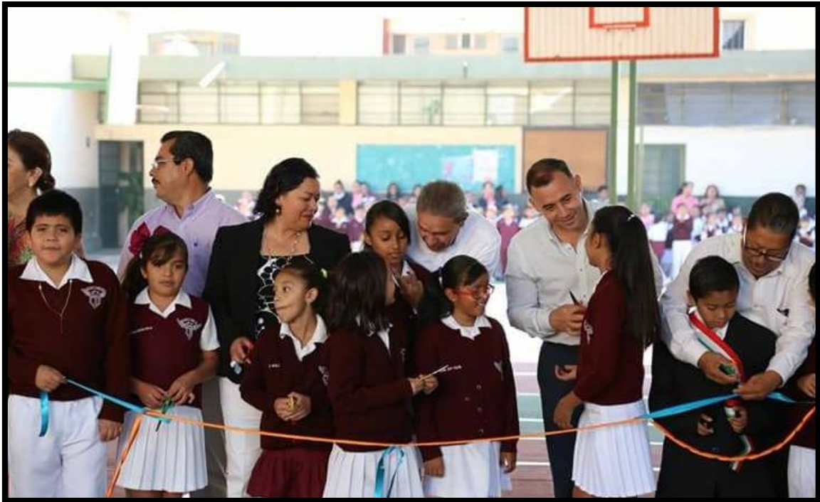
Inauguración de Domo en Escuela Primaria "José Clemente Orozco"