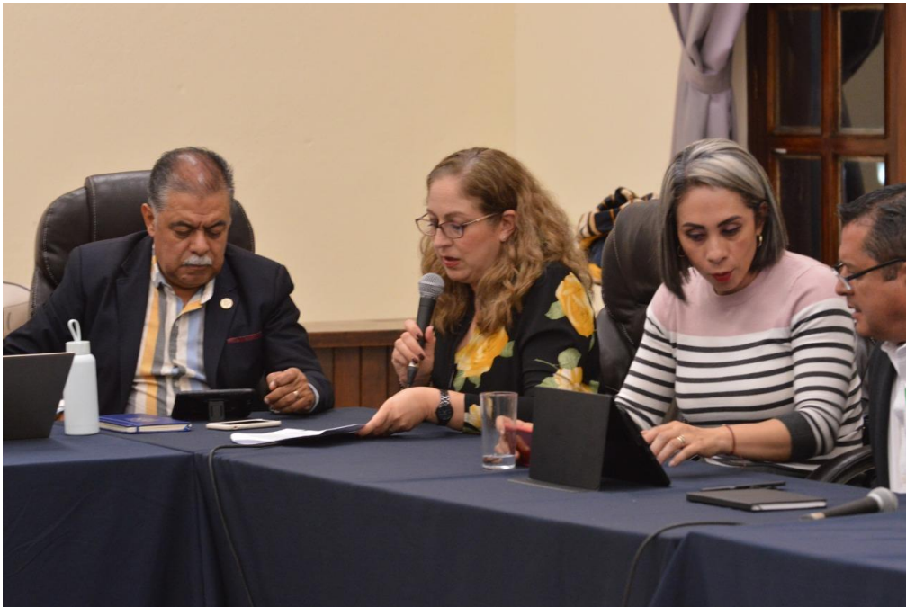
29 DE OCTUBRE 2019