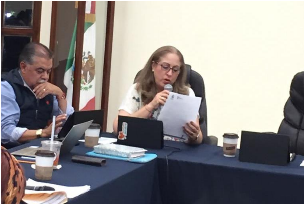
13 DE NOVIEMBRE 2019