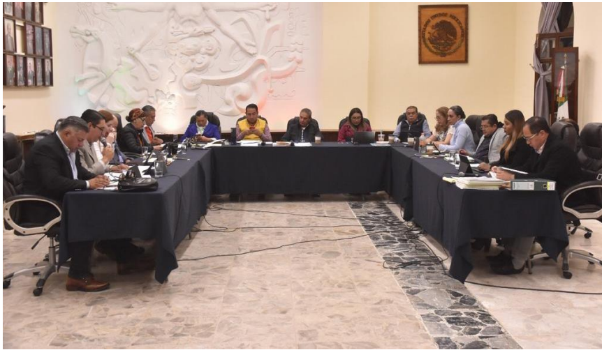
13 DE NOVIEMBRE 2019