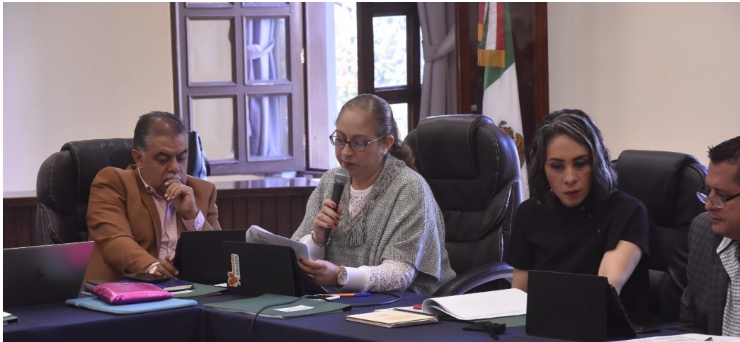
25 DE NOVIEMBRE 2019