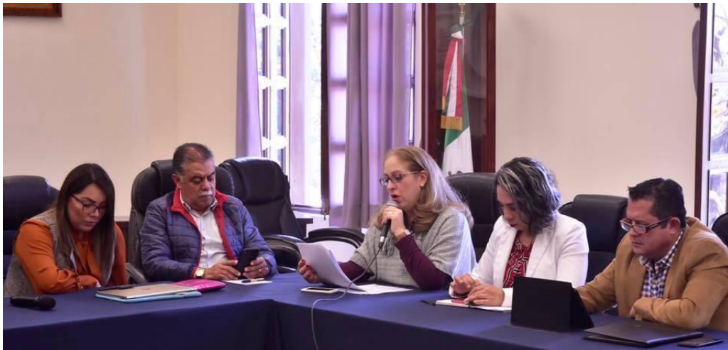
05 DE DICIEMBRE 2019