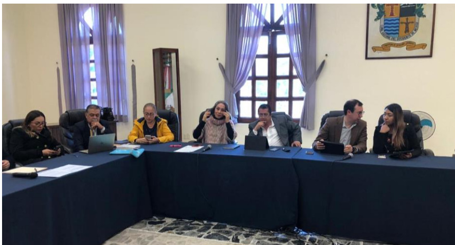
17 DE DICIEMBRE 2019