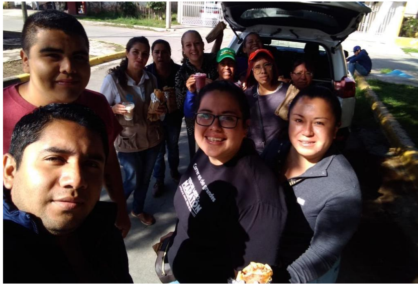
14 DE NOVIEMBRE 2019