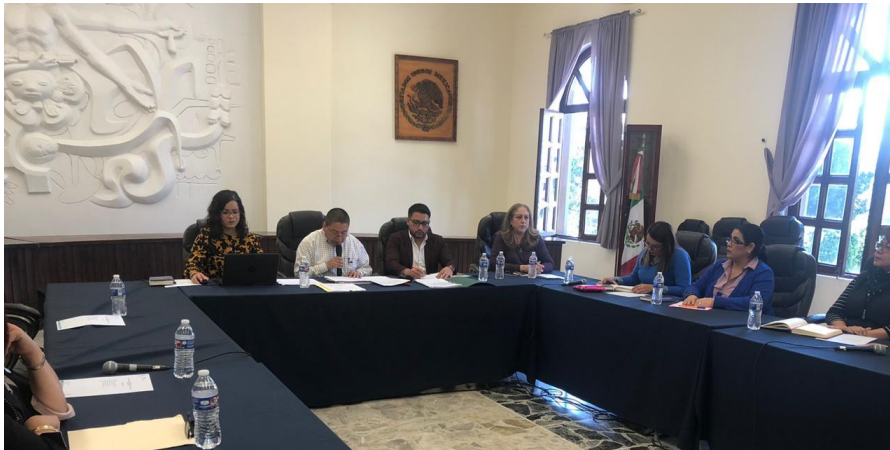
28 DE NOVIEMBRE 2019