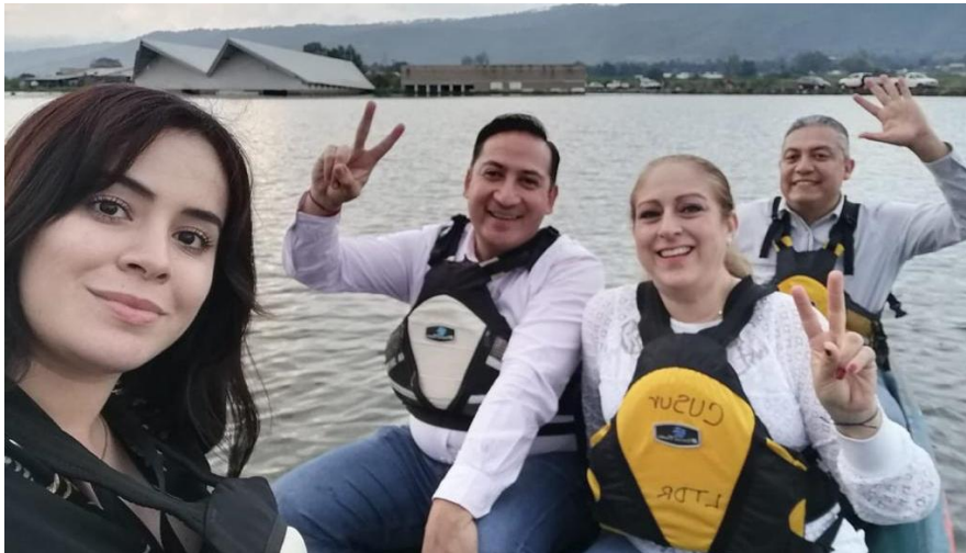
25 DE NOVIEMBRE 2019