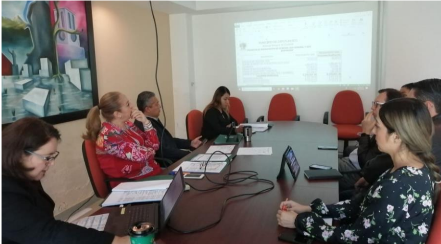
09 DE DICIEMBRE 2019