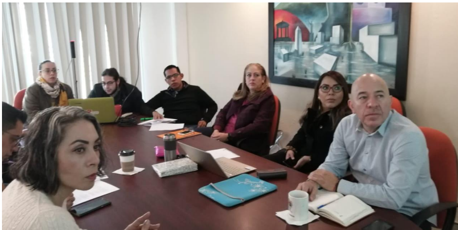
12 DE DICIEMBRE 2019