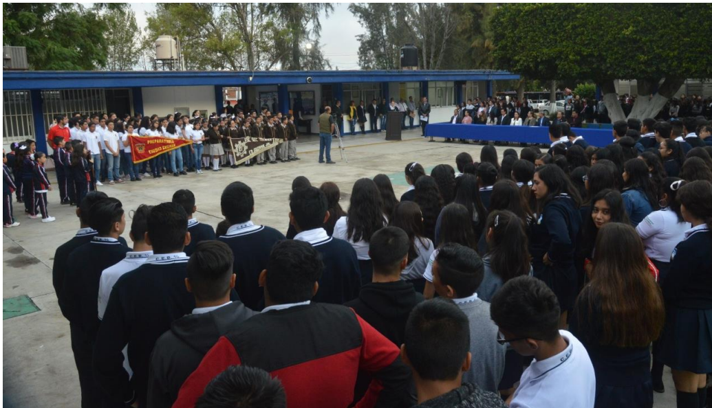
03 DE OCTUBRE 2019