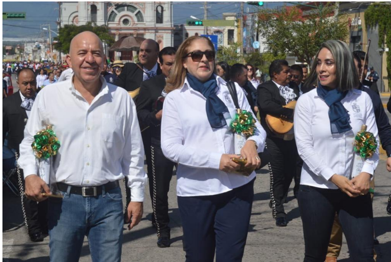
11 DE OCTUBRE 2019