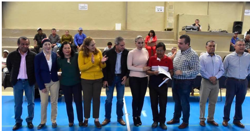
19 DE DICIEMBRE 2019