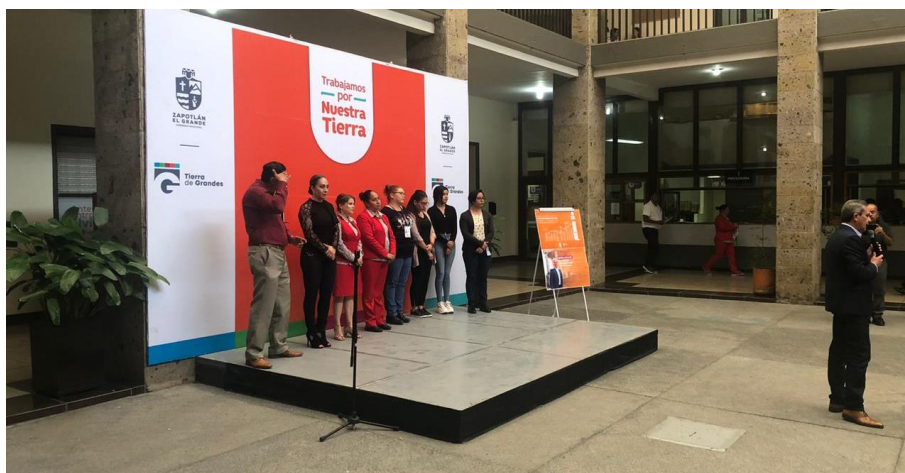
20 DE NOVIEMBRE 2019