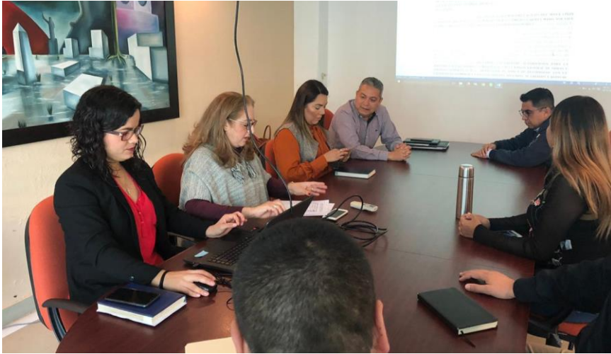
05 DE DICIEMBRE 2019