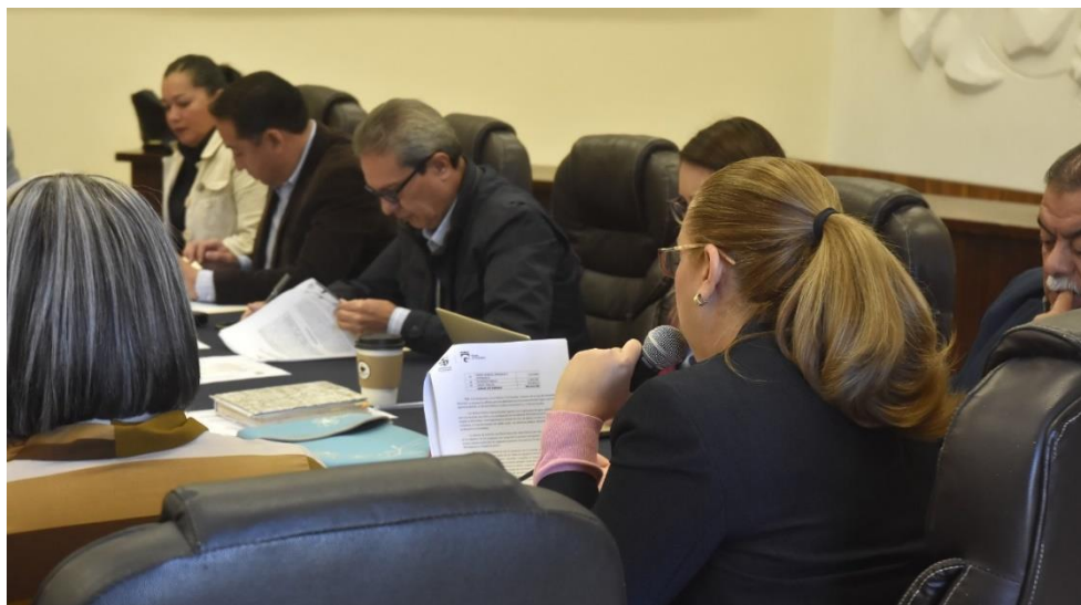
11 DE DICIEMBRE 2019