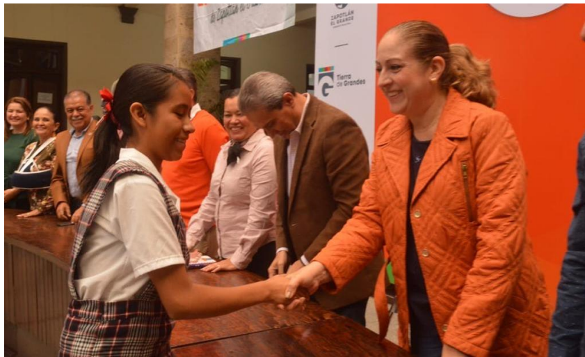
08 DE OCTUBRE 2019