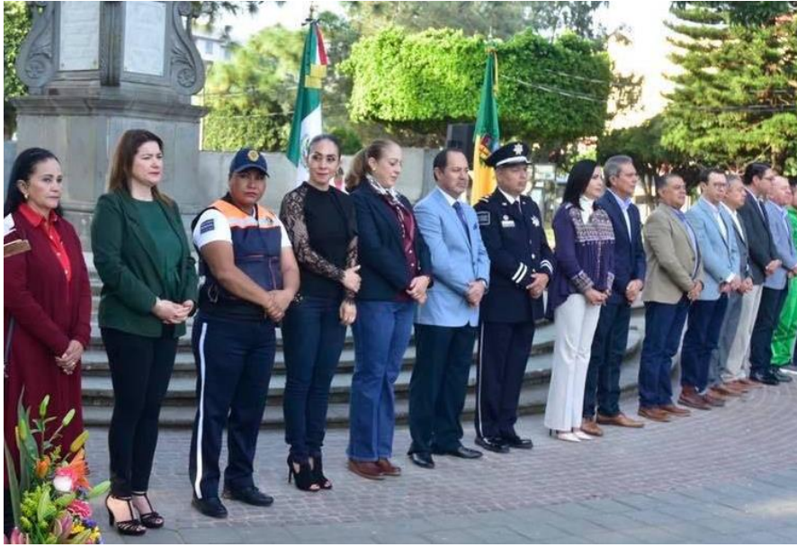
20 DE NOVIEMBRE 2019