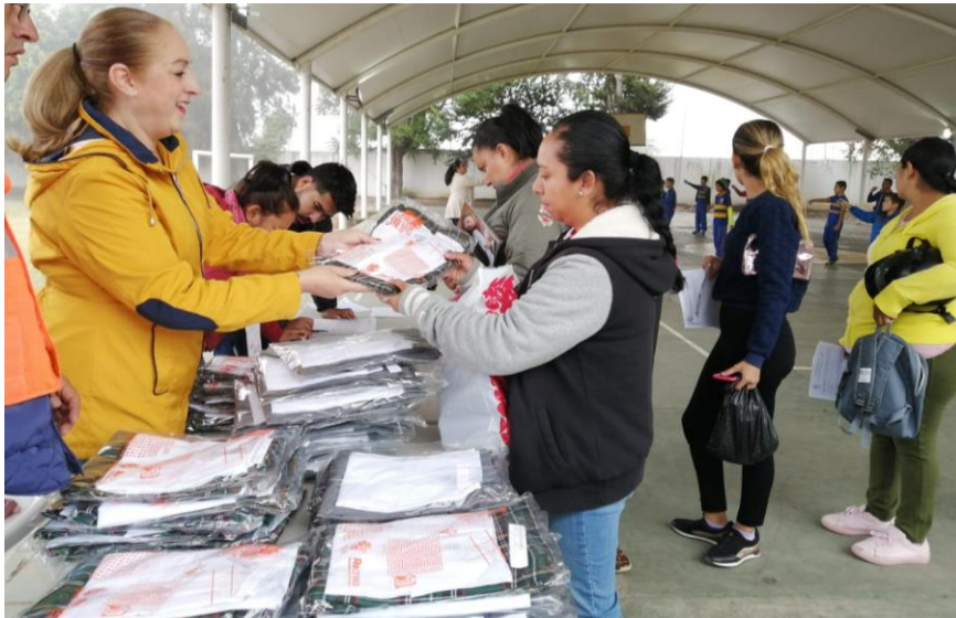
17 DE DICIEMBRE 2019