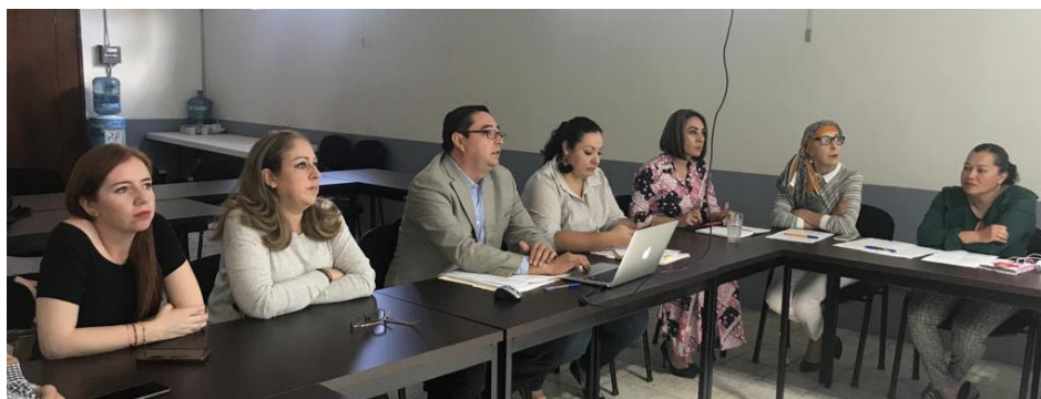
04 DE NOVIEMBRE 2019