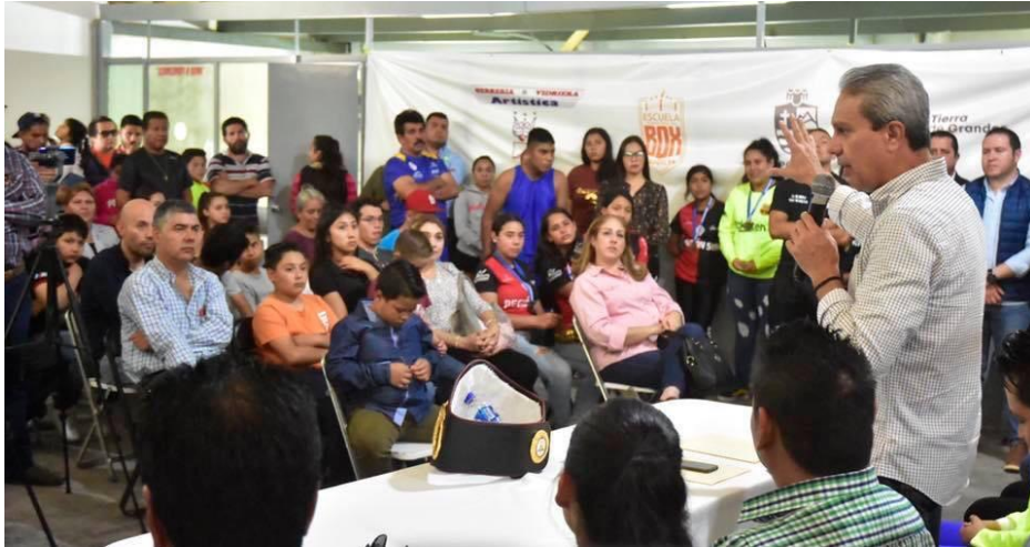
21 DE NOVIEMBRE 2019