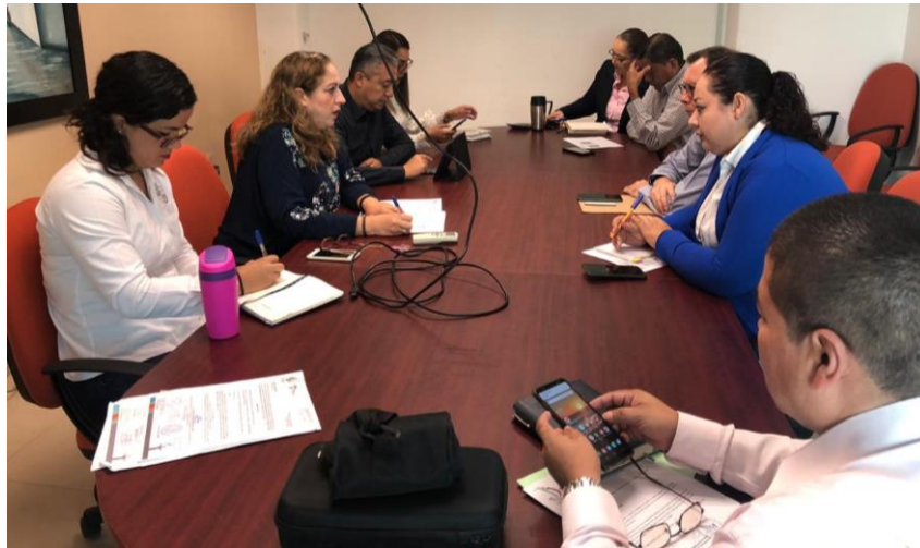
28 DE OCTUBRE 2019