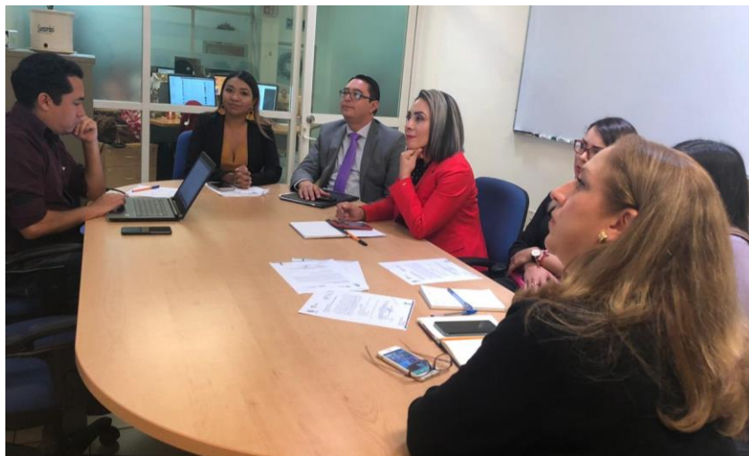
04 DE DICIEMBRE 2019