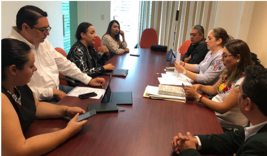
15 DE OCTUBRE 2019