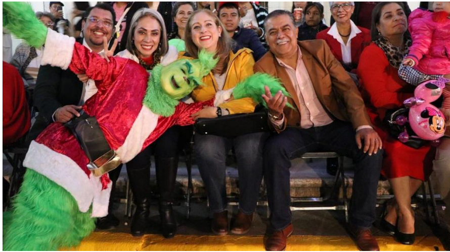
14 DE DICIEMBRE 2019