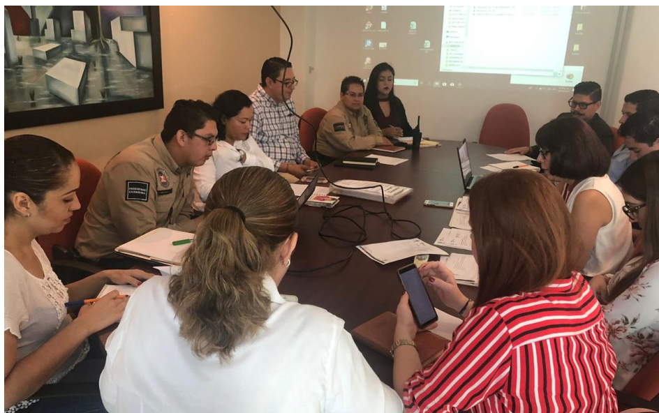
07 DE OCTUBRE 2019