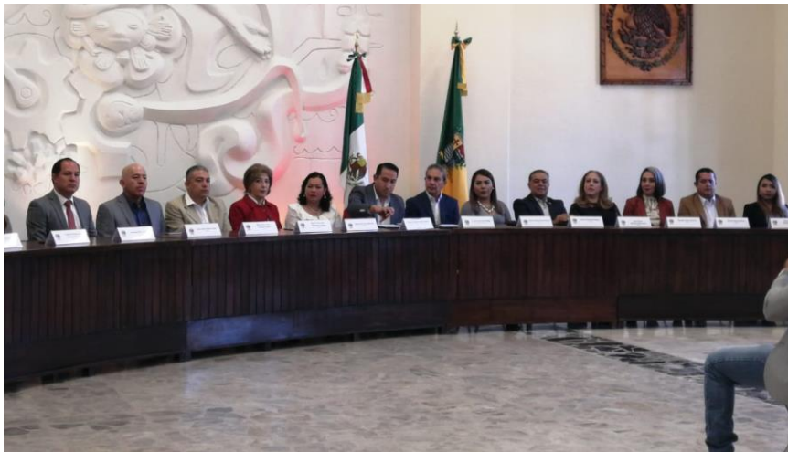
21 DE NOVIEMBRE 2019