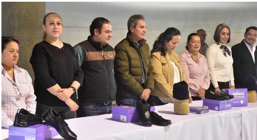
03 DE DICIEMBRE 2019