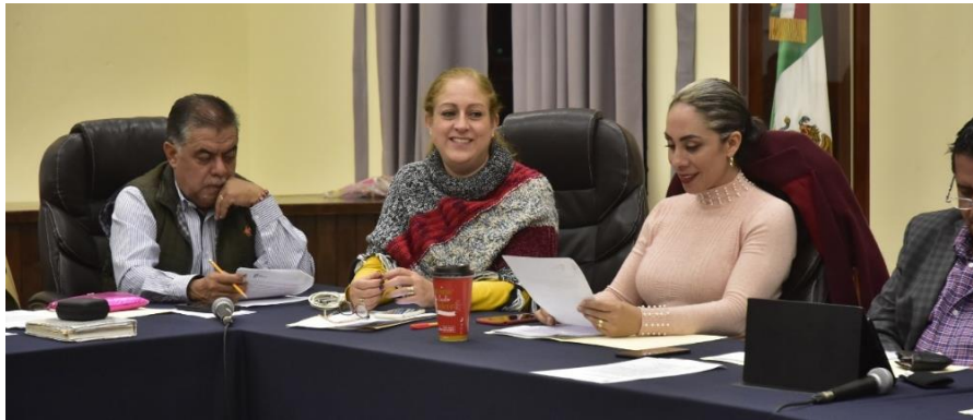
18 DE DICIEMBRE 2019