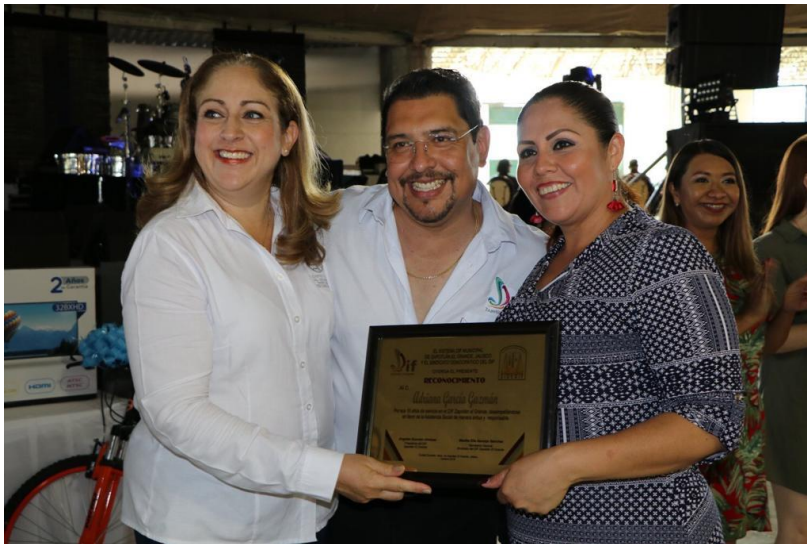
11 DE OCTUBRE 2019