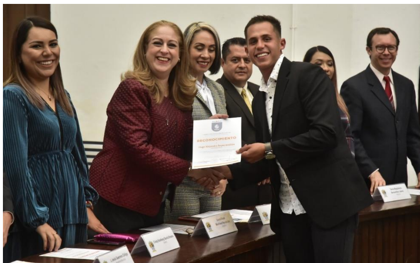
20 DE DICIEMBRE 2019