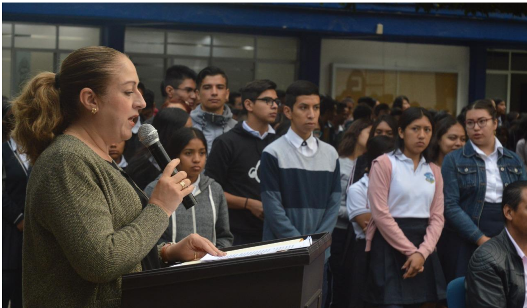
03 DE OCTUBRE 2019