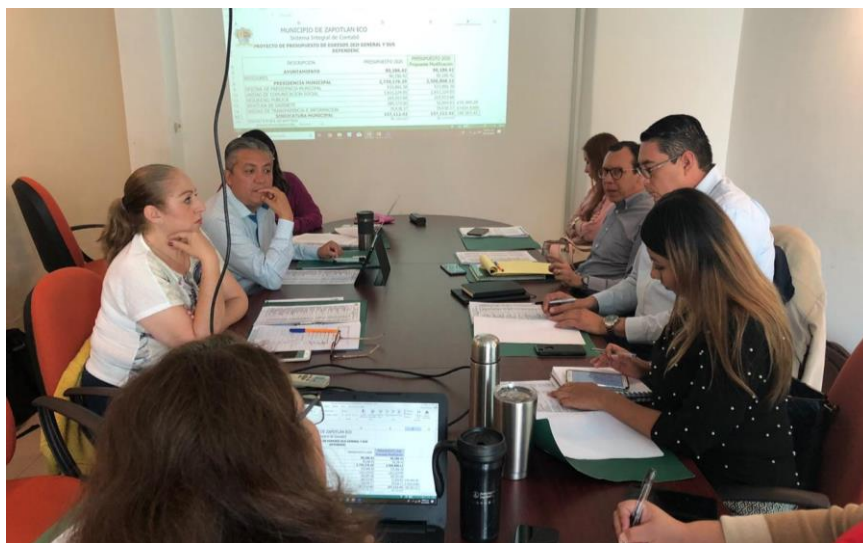
03 DE DICIEMBRE 2019