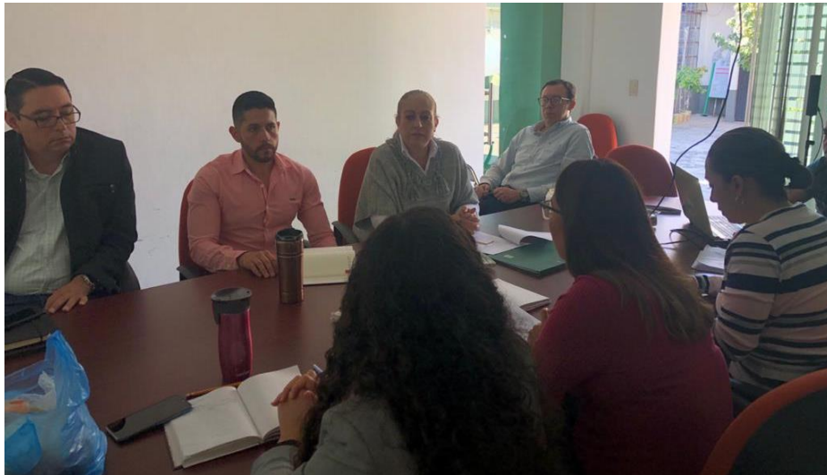
06 DE DICIEMBRE 2019