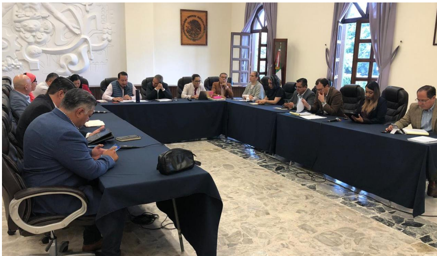
25 DE NOVIEMBRE 2019