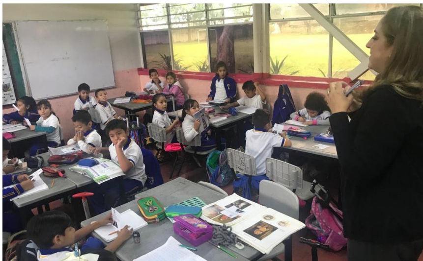
13 DE NOVIEMBRE 2019