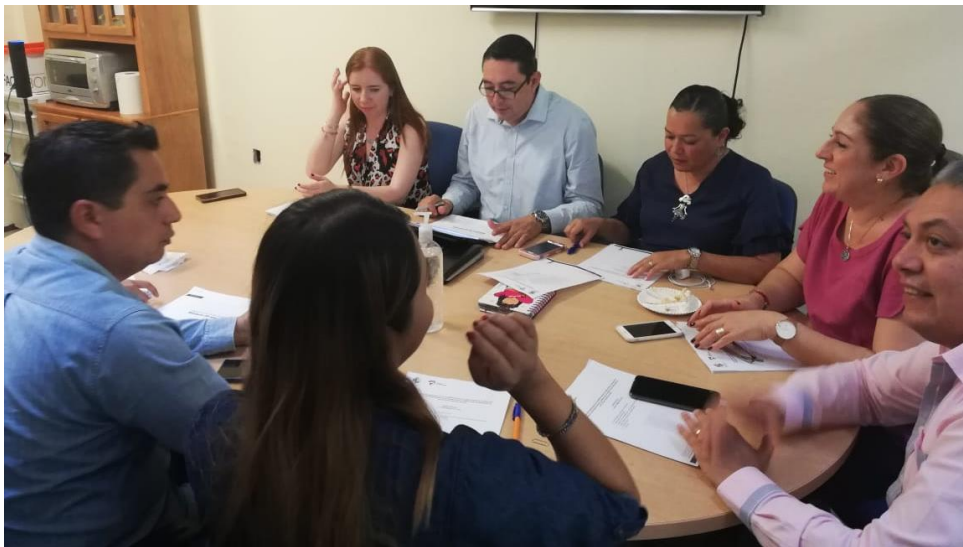
14 DE OCTUBRE 2019