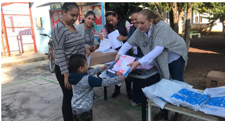
06 DE DICIEMBRE 2019