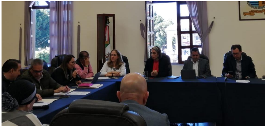
13 DE DICIEMBRE 2019