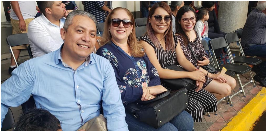
05 DE OCTUBRE 2019