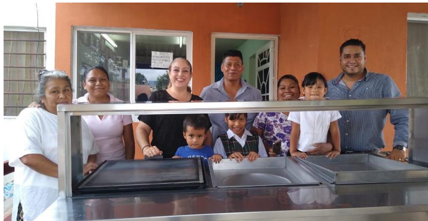
30 DE OCTUBRE 2019