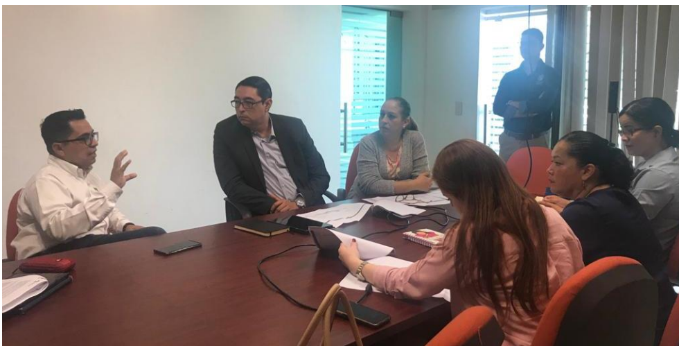
11 DE NOVIEMBRE 2019