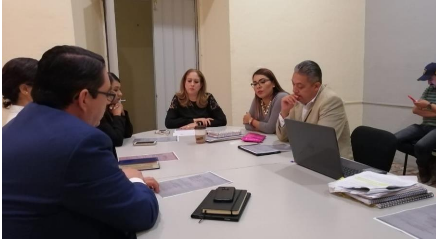
21 DE NOVIEMBRE 2019