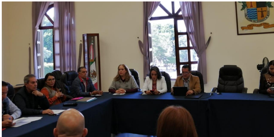
05 DE DICIEMBRE 2019