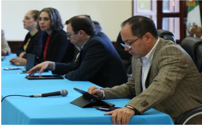
10 DE OCTUBRE 2019