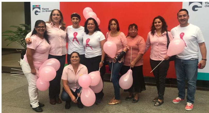
18 DE OCTUBRE 2019