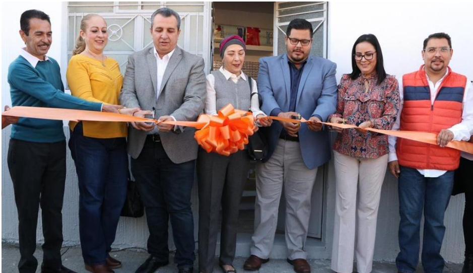
02 DE DICIEMBRE 2019