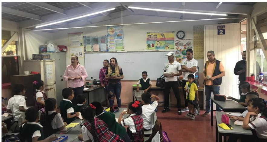
29 DE NOVIEMBRE 2019