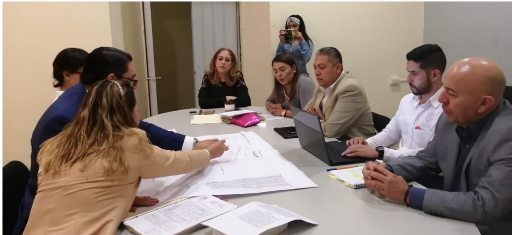
21 DE NOVIEMBRE 2019