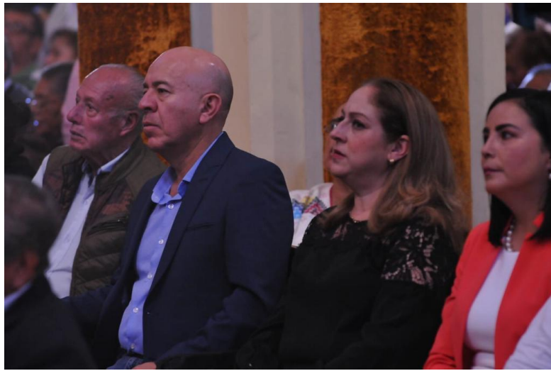
22 DE OCTUBRE 2019