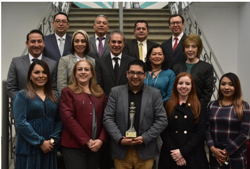
20 DE DICIEMBRE 2019