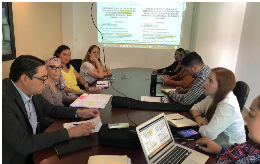
02 DE OCTUBRE 2019