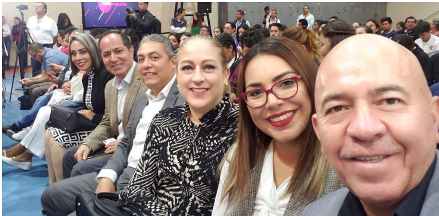
14 DE NOVIEMBRE 2019