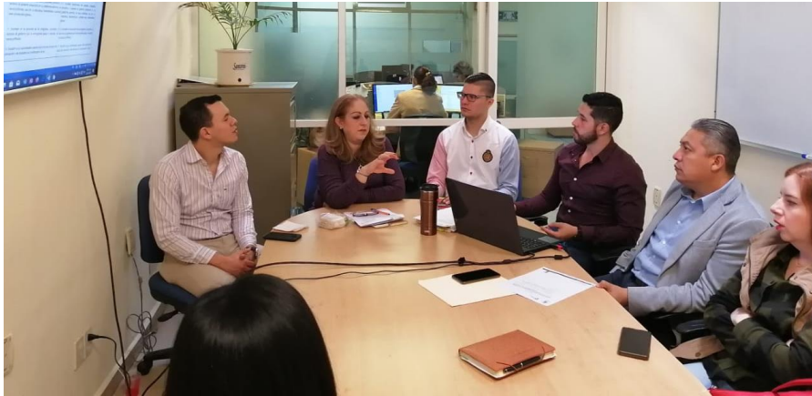
28 DE NOVIEMBRE 2019