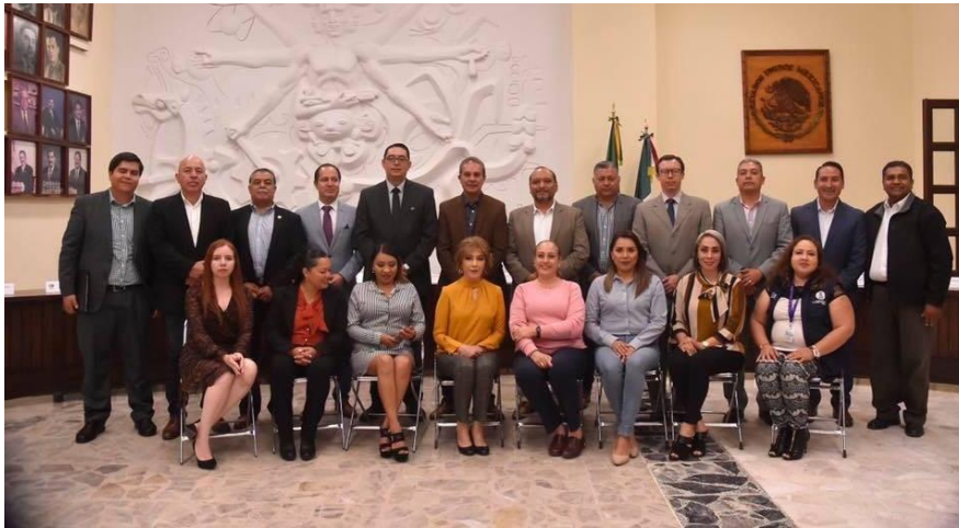
11 DE DICIEMBRE 2019