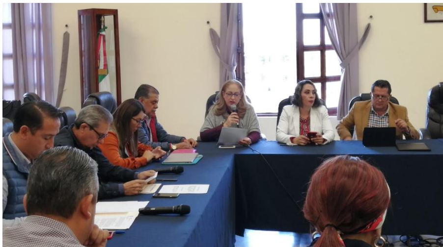
05 DE DICIEMBRE 2019