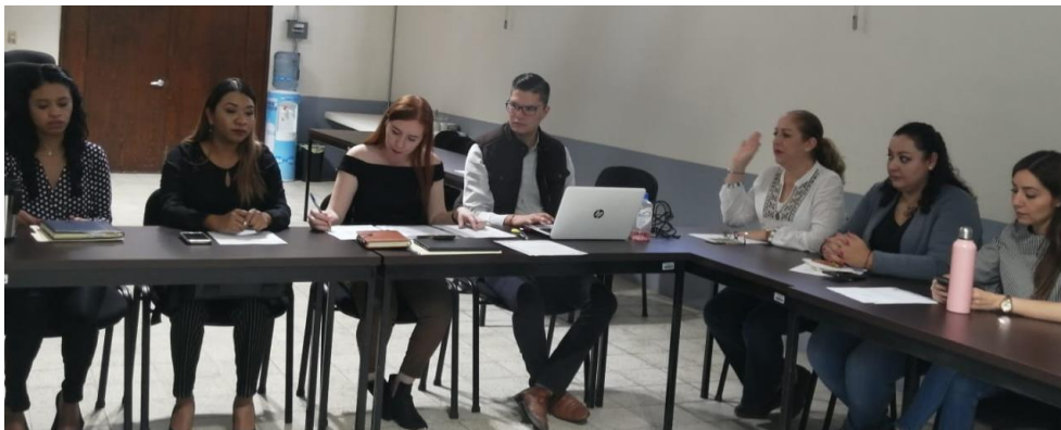
26 DE NOVIEMBRE 2019