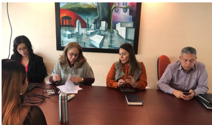
05 DE DICIEMBRE 2019