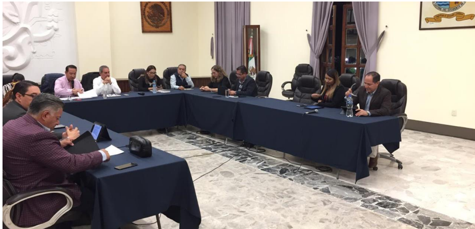
16 DE OCTUBRE 2019