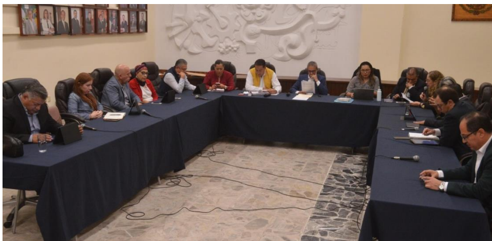
29 DE OCTUBRE 2019