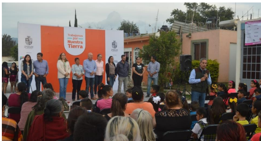
09 DE OCTUBRE 2019