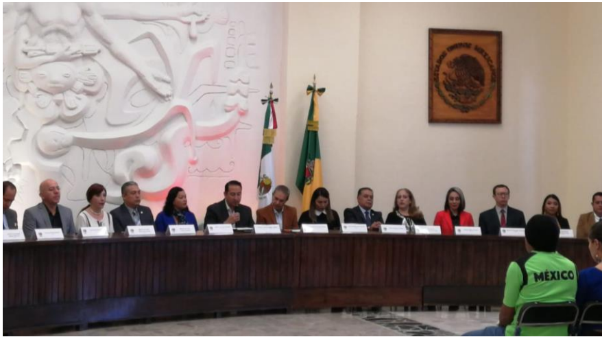
04 DE DICIEMBRE 2019