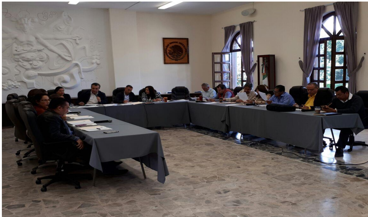
SESION EXTRAORDINARIA DE AYUNTAMIENTO No. 48 DE FECHA: 01 DE NOVIEMBRE DEL 2017.