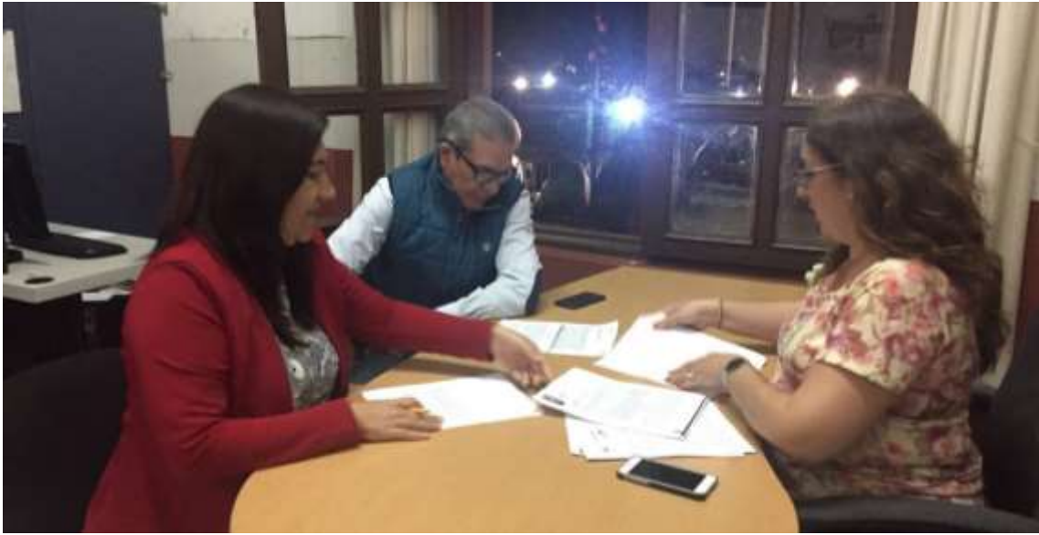
21 DE NOVIEMBRE DE 2107. SESION EXTRAORDINARIA