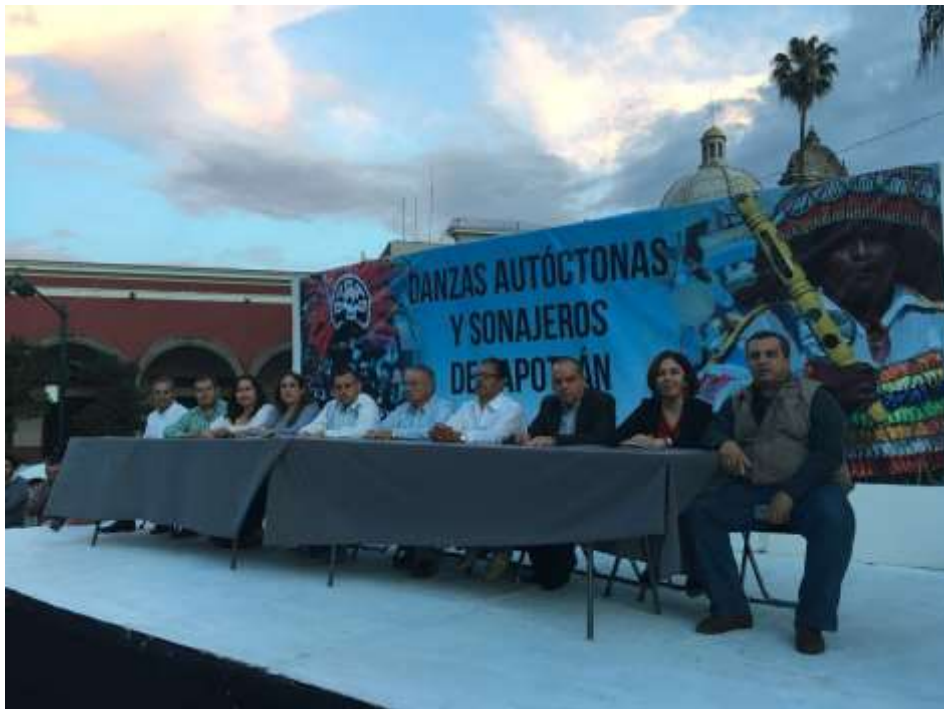
12 DE OCTUBRE. DIA DEL SONAJERO.