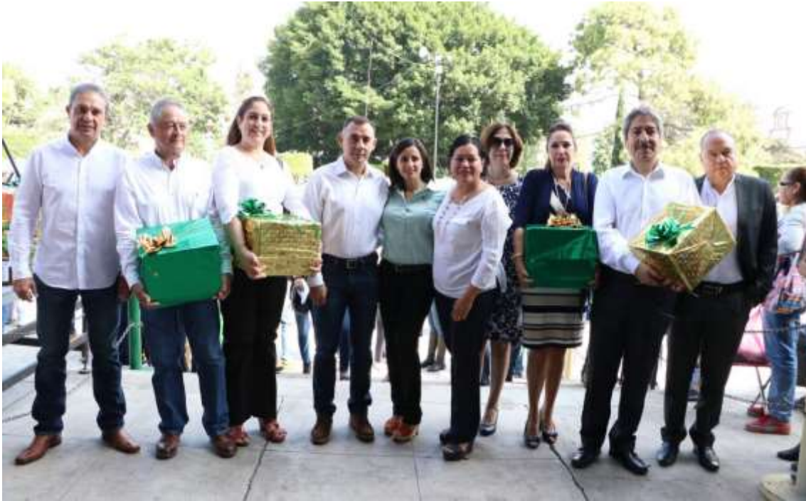
13 DE OCTUBRE. PEREGRINACION H. AYUNTAMIENTO