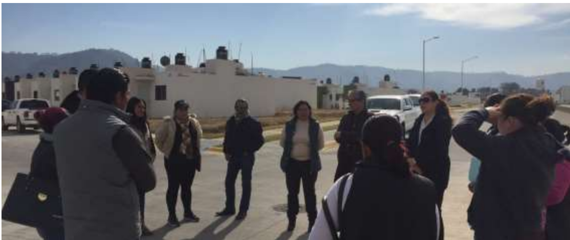
REUNION CON VECINOS DE LA COLONIA CAMICHINES, NUEVA LUZ, FRACCIONAMIENTO GANTE.