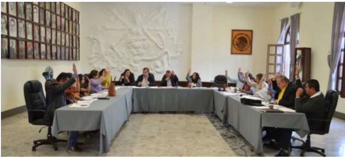
01 DE NOVIEMBRE. SESIÓN EXTRAORDINARIA NO. 48