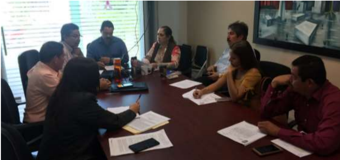
06 NOVIEMBRE 2017. SESION ORDINARIA.