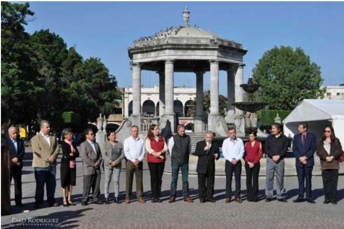
23 DE NOVIEMBRE. ENTREGA DE AMBULANCIA A LA CRUZ ROJA COLECTA 2017.