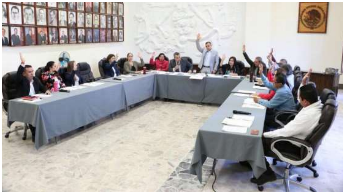
09 DE NOVIEMBRE DE 2017. SESIÓN ORDINARIA NO. 20