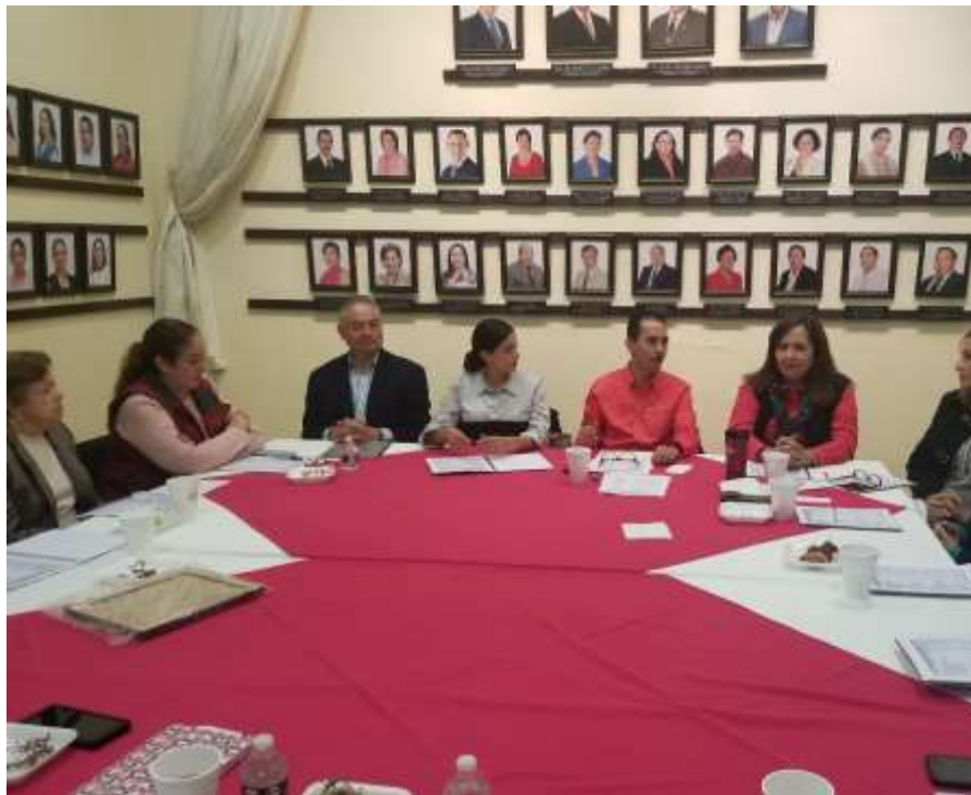
14 DE DICIEMBRE 2017, SEGUNDA SESIÓ ORDINARIA DEL OPD ESTACIONÓMETROS