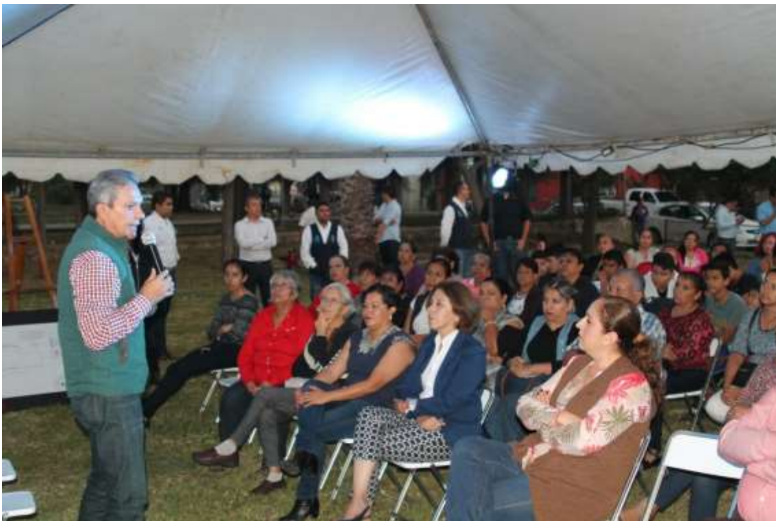
07 DE NOVIEMBRE. PRIMERA PIEDRA PARQUE EL NOGAL.