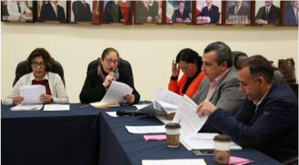
15 DE DICIEMBRE DE 2017. SESION EXTRAORDINARIA NO. 51 Y NO. 52