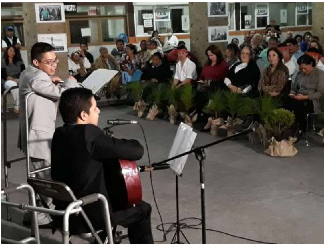
03 DE DICIEMBRE. CLAUSURA DE LA SEMANA CONMEMORACION DIA INTERNACIONAL DE LAS PERSONAS CON DISCAPACIDAD