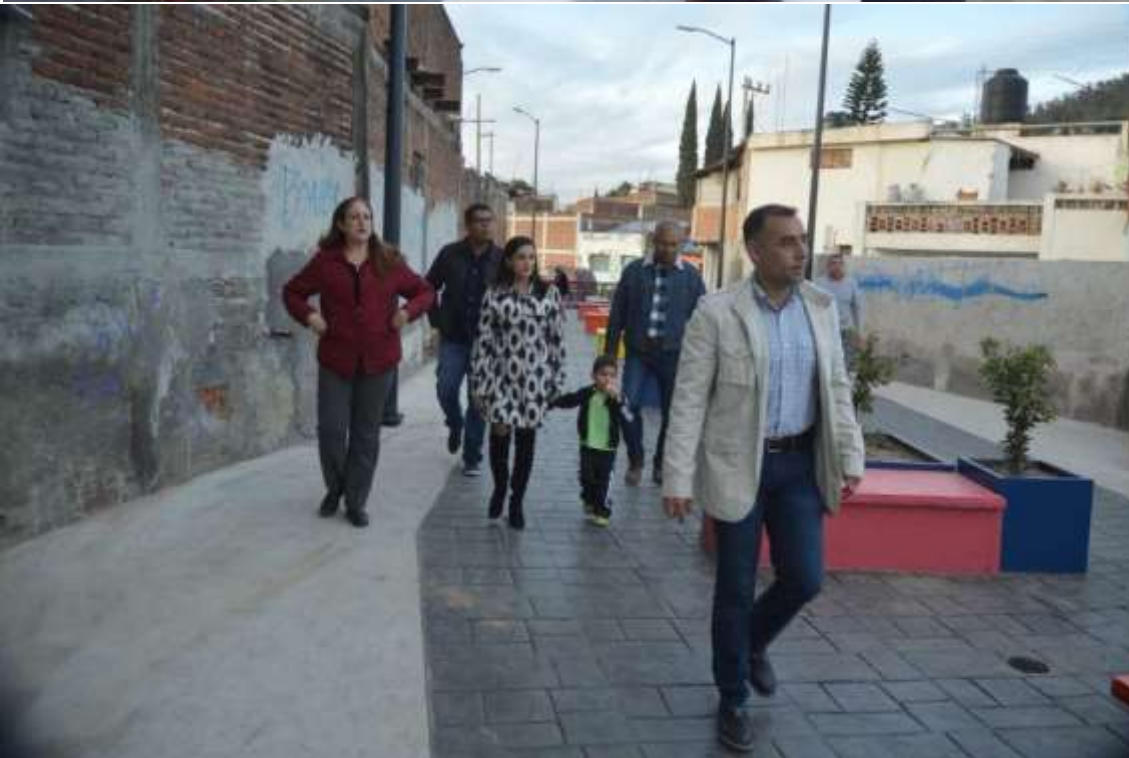
26 DE DICIEMBRE 2017. INAGURACION PARQUE LINEAL ARROYO LOS GUAYABOS.