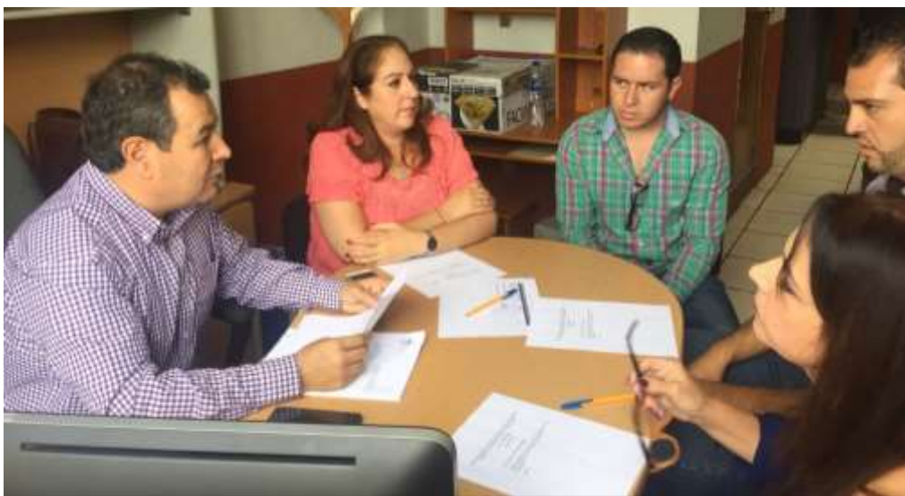
30 DE OCTUBRE DE 2017. SESION ORDINARIA.