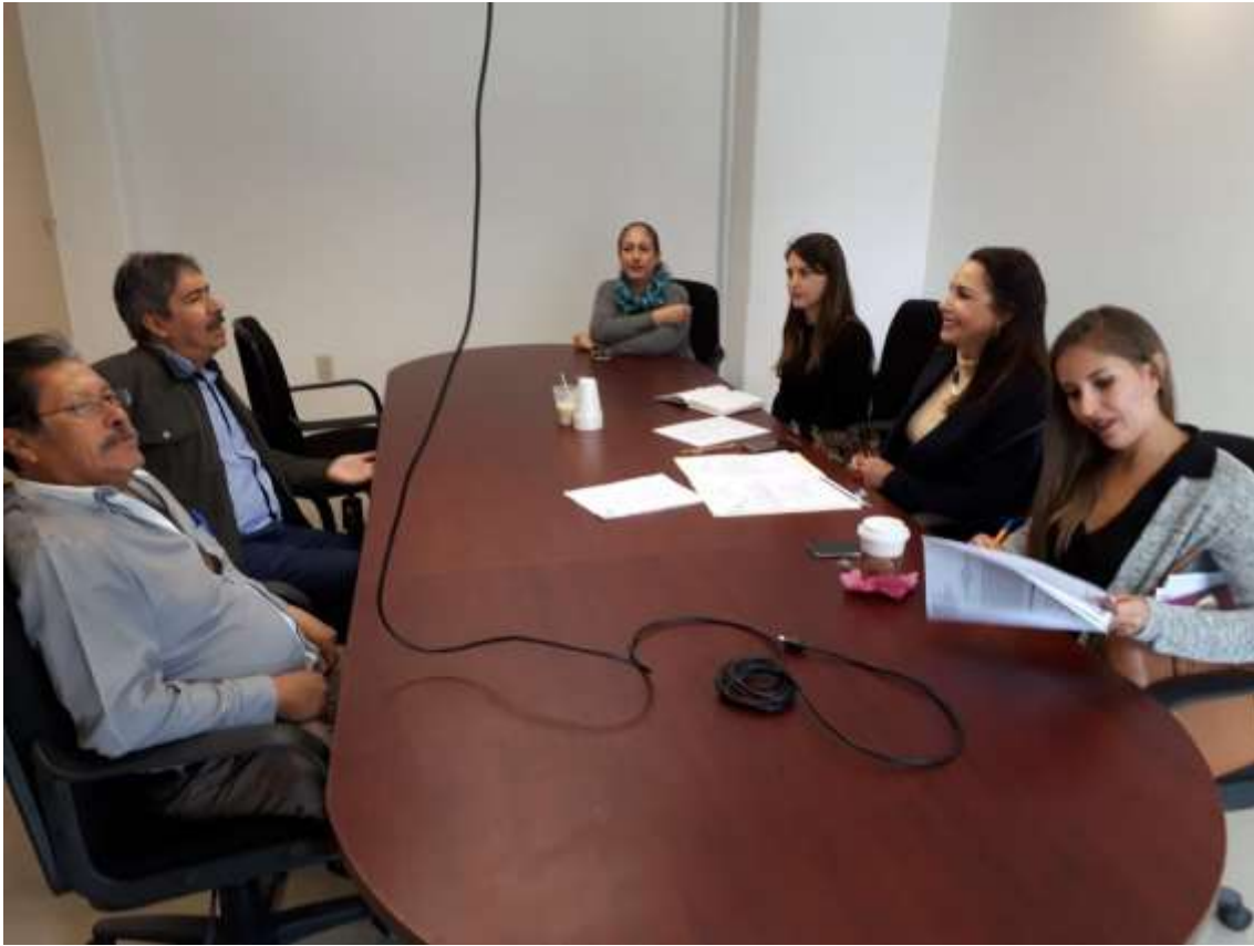
22 DE DICIEMBRE. SESION ORDINARIA.