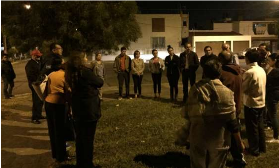
22 DE NOVIEMBRE REUNION CON VECINOS DE MANSIONES DEL REAL