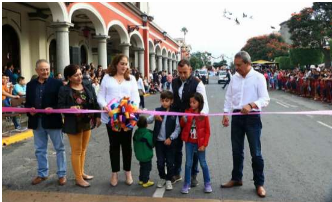
07 DE OCTUBRE. DESFILE INAGURAL FERIA ZAPOTLAN 2017