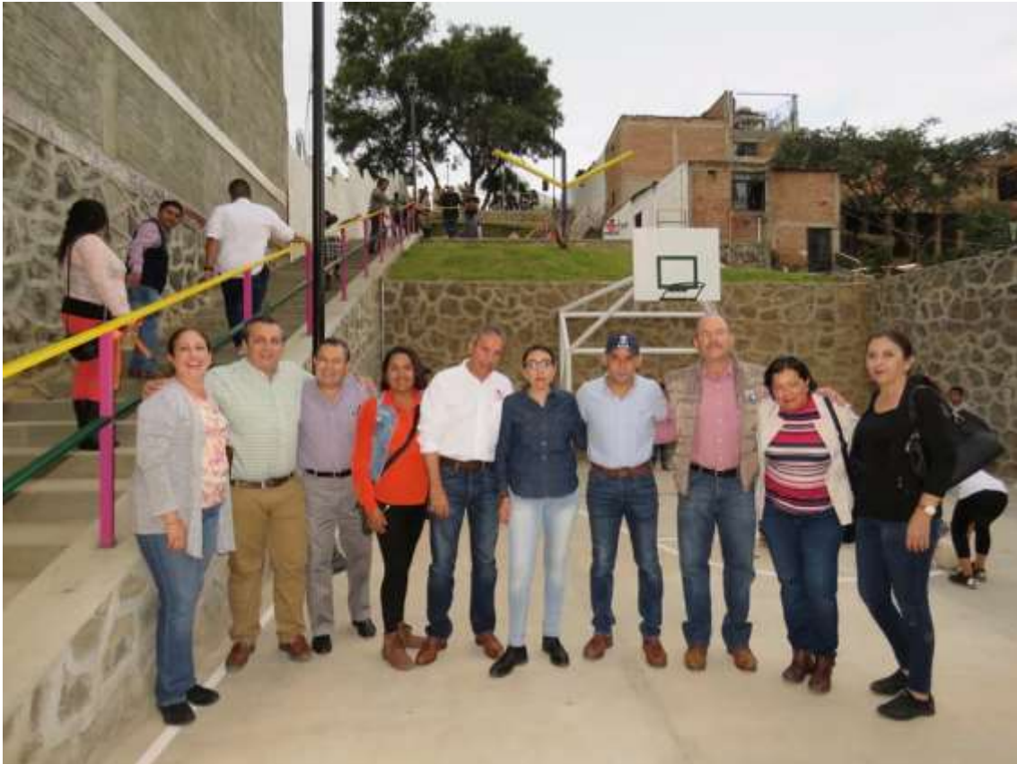
24 DE OCTUBRE. INAGURACION DE PARQUE DE LA CRUZ BLANCA