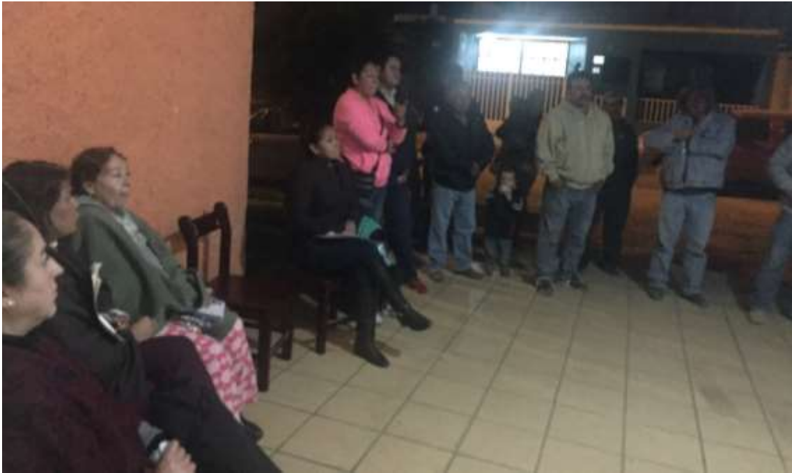
REUNION CON VECINOS DEL FRACCIONAMIENTO INSURGENTES.