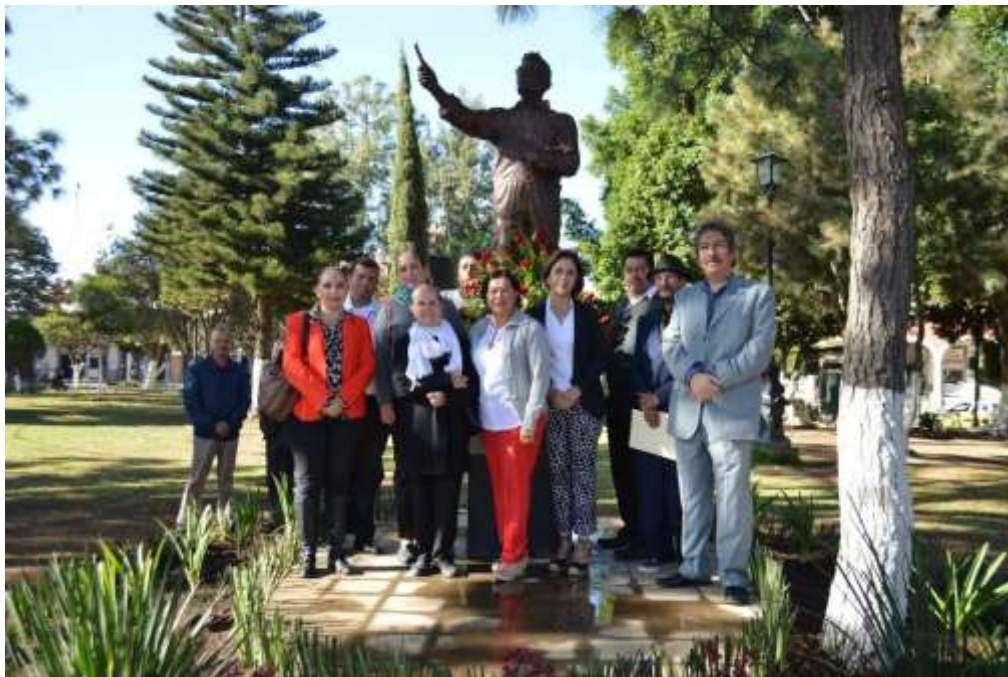
23 DE NOVIEMBRE. ANIVERSARIO DEL NATALICIO DEL MURALISTA ZAPOTLENSE JOSE CLEMENTE OROZCO.