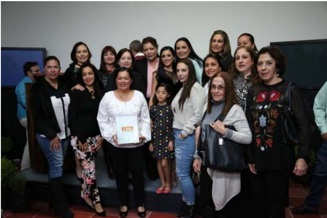
INFORME DE ACTIVIDADES DIF.