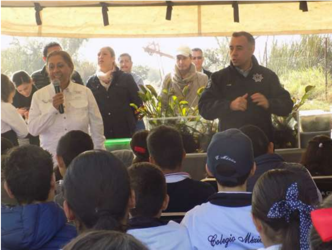
01 DE DICIEMBRE. LAGUNA DE ZAPOTLAN