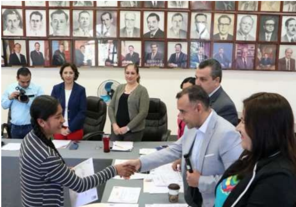
09 DE NOVIEMBRE DE 2017. SESIÓN ORDINARIA NO. 20