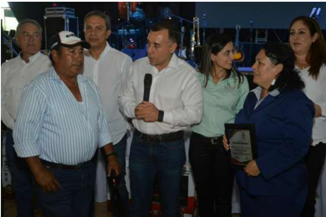
13 DE OCTUBRE. COMIDA DEL SERVIDOR PUBLICO 2017.