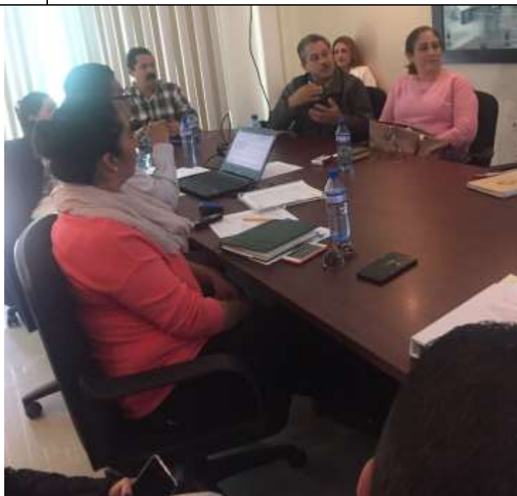
24 DE NOVIEMBRE 2017. TRIGÉSIMA SEGUNDA SESIÓN ORDINARIA