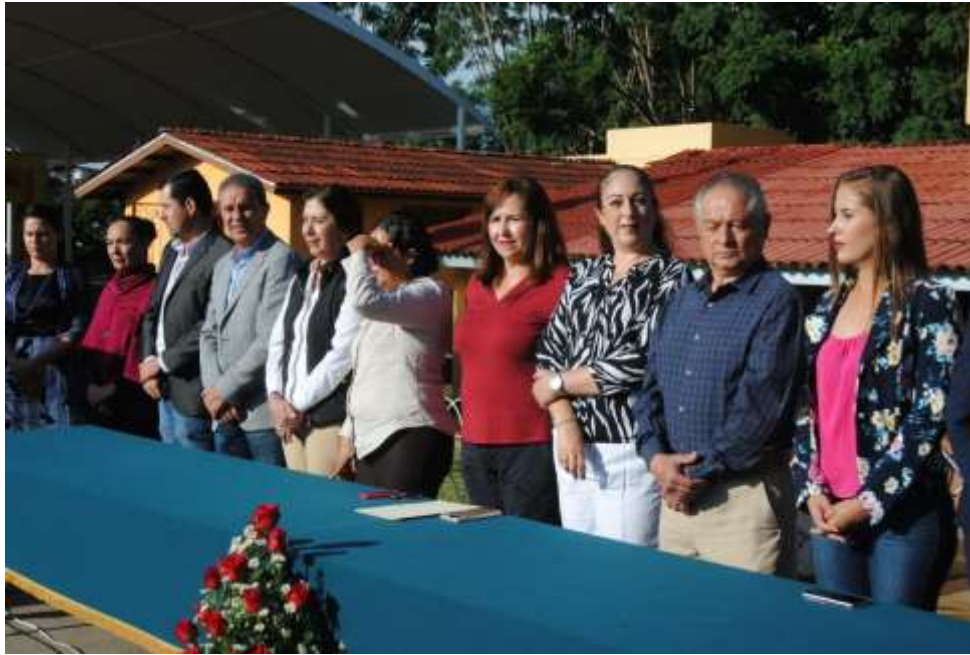
03 OCTUBRE DE 2017. 228º ANIVERSARIO DEL NATALICIO DEL INSURGENTE JOSE FRANCISCO GORDIANO GUZMÁN.