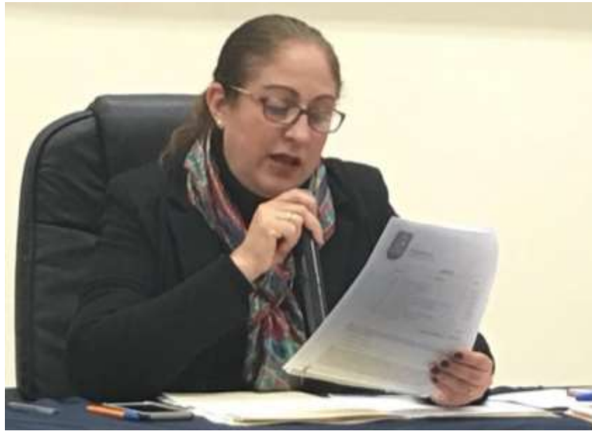
15 DE DICIEMBRE 2017. SESIÓN EXTRAORDINARIA NO. 51 y NO. 52