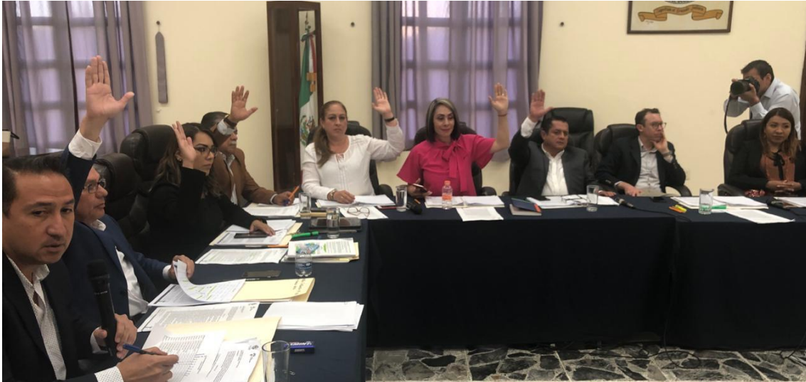
25 DE MARZO, SESION ORDINARIA 05