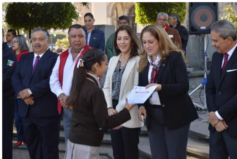
24 DE FEBRERO DE 2019