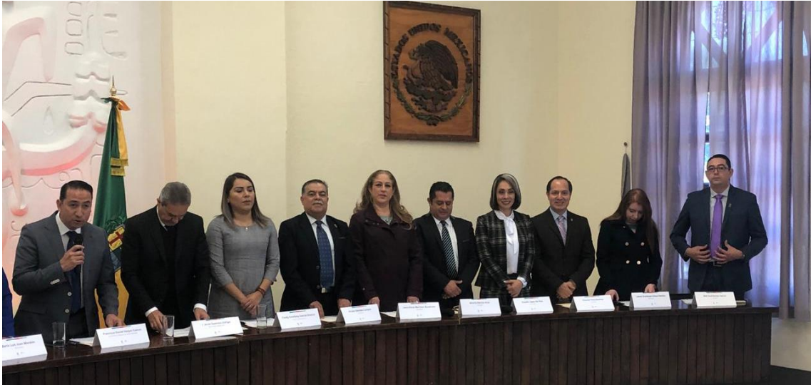
04 DE ENERO DE 2019. SESION SOLEMNE NO. 02