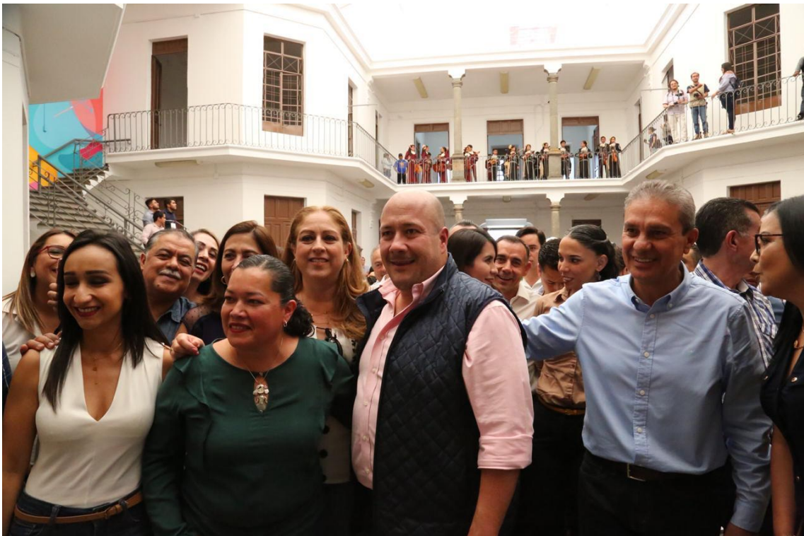
31 DE MARZO DE 2018. VISITA DEL GOBERNADOR ENRIQUE ALFARO