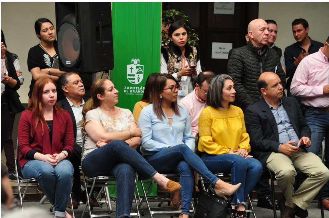
26 DE FEBRERO DE 2019. DIA NACIONAL POR LA INCLUSIÓN LABORAL