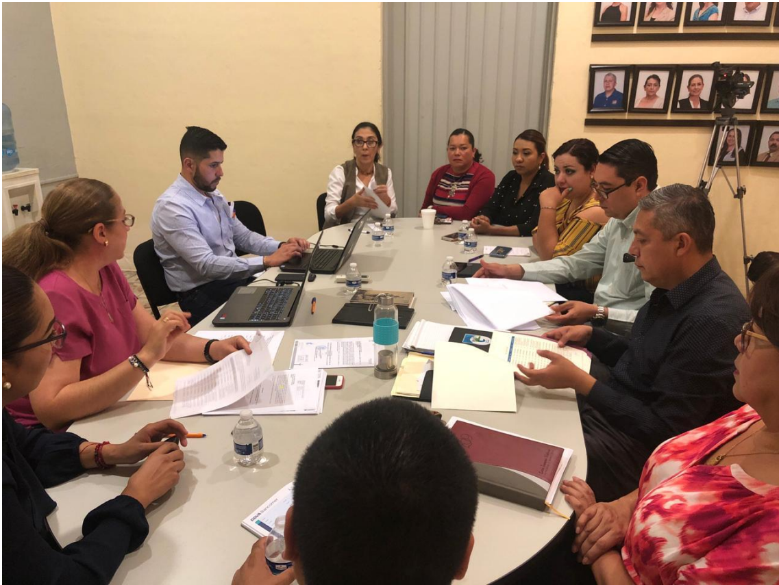
SESION 06 EXTRAORDINARIA 28 DE MARZO DE 2019