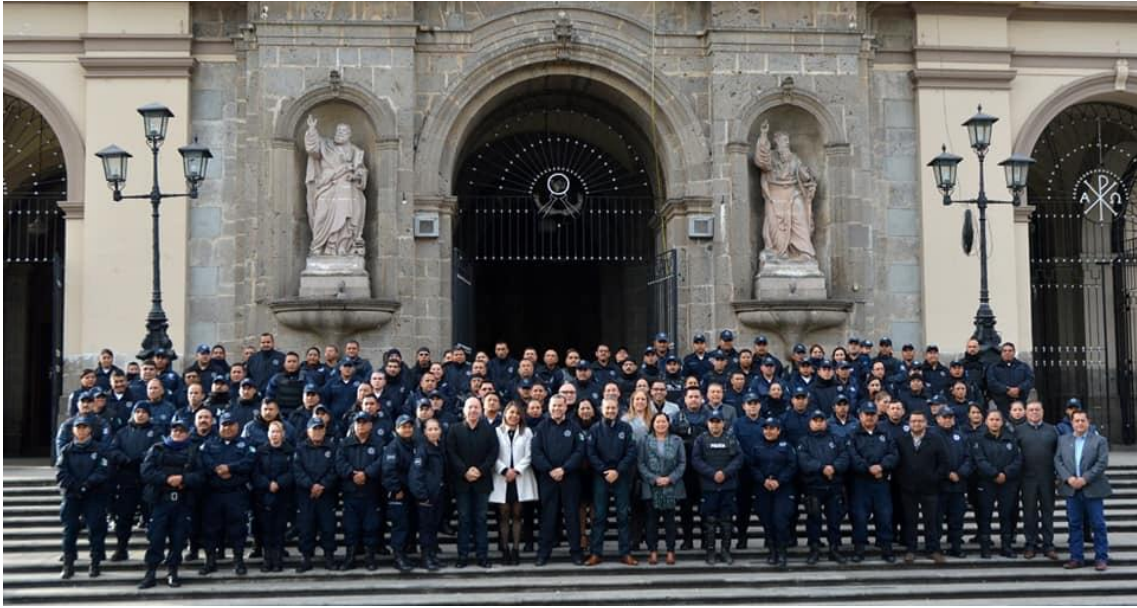
02 DE ENERO DIA DEL POLICIA