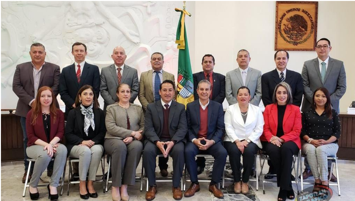
SESION SOLEMNE 03. 28 DE ENERO DE 2019