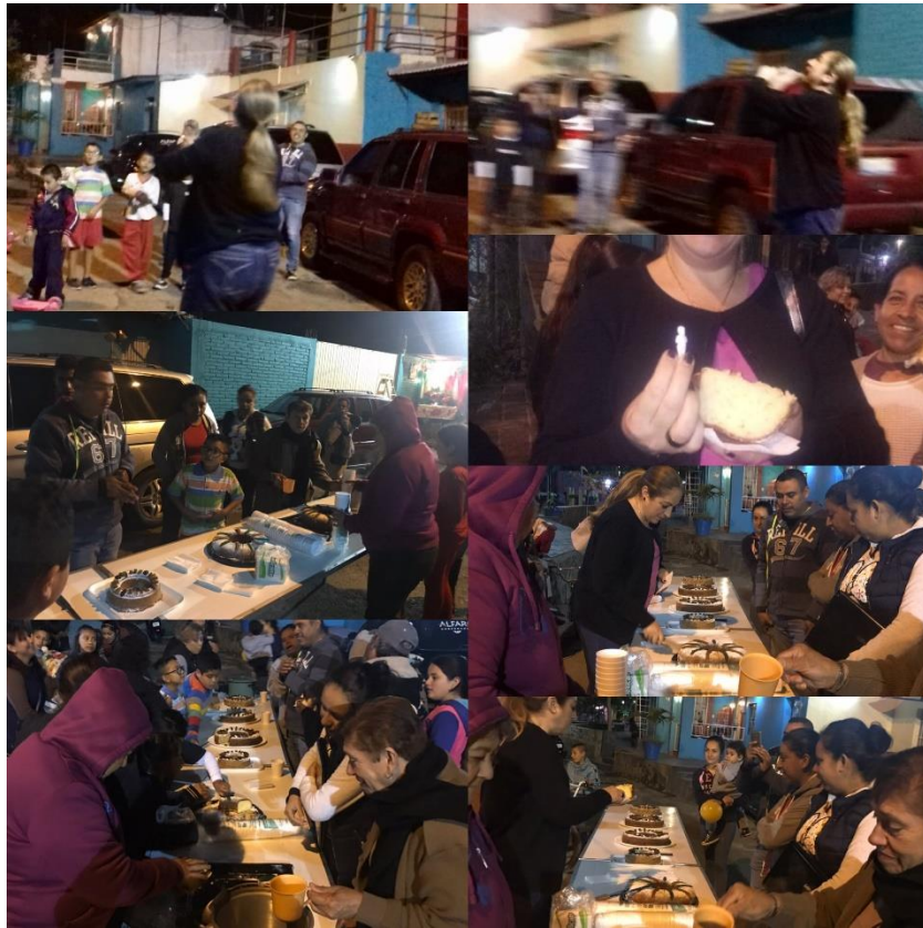
15 DE ENERO 2019. CONVIVENCIA CON VECINOS DE GONZALEZ ORTEGA