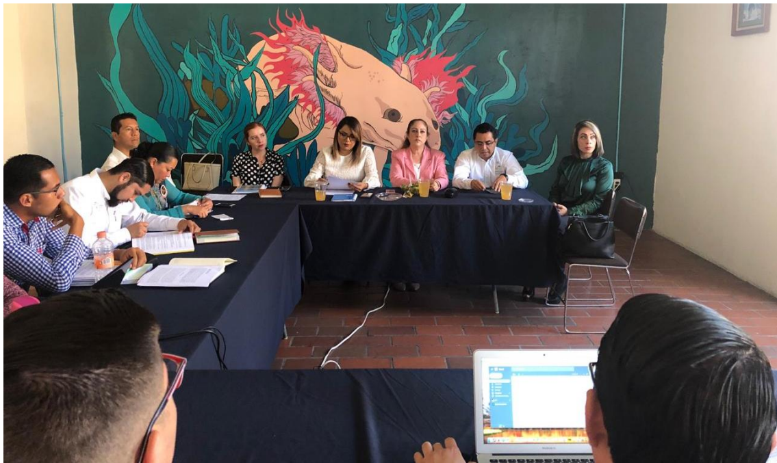
11 DE FEBRERO 2019