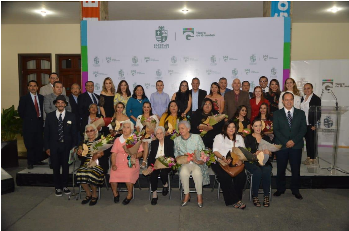
RECONOCIMIENTO A LA MUJER ZAPOTLENSE 12 DE MARZO DE 2019