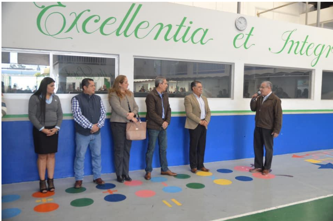
ACTO CIVICO 21 DE ENERO 2019