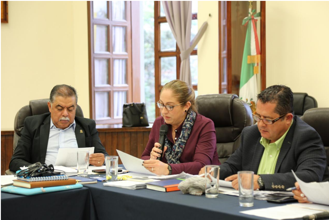
17 DE ENERO DE 2019 SESION ORDINARIA 03