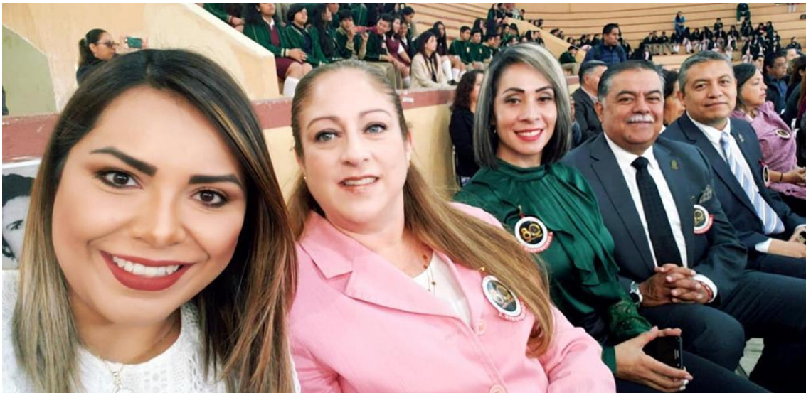
80 ANIVERSARIO DE LA ESCUELA SECUNDARIA BENITO JUAREZ 11 DE FEBRERO 2019