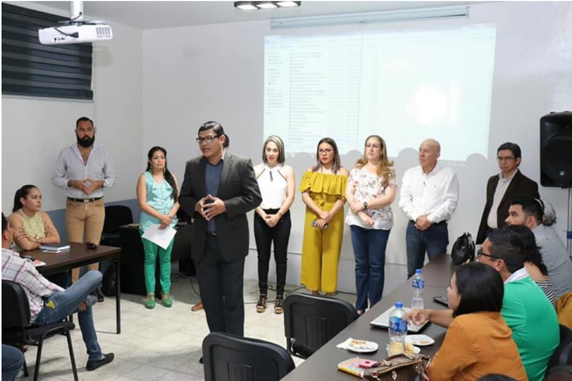
08 DE MARZO 2019. INICIO DEL DIPLOMADO DE TRANSPARENCIA