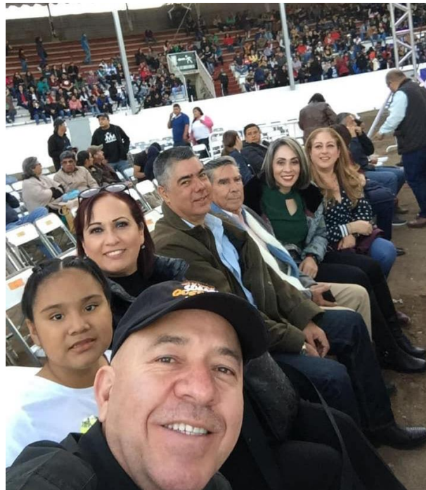
26 DE ENERO 2019 FUNCION DE BOX ESTELAR EN ZAPOTLAN