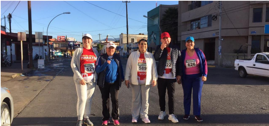
MEDIO MARATON. 27 DE ENERO 2019