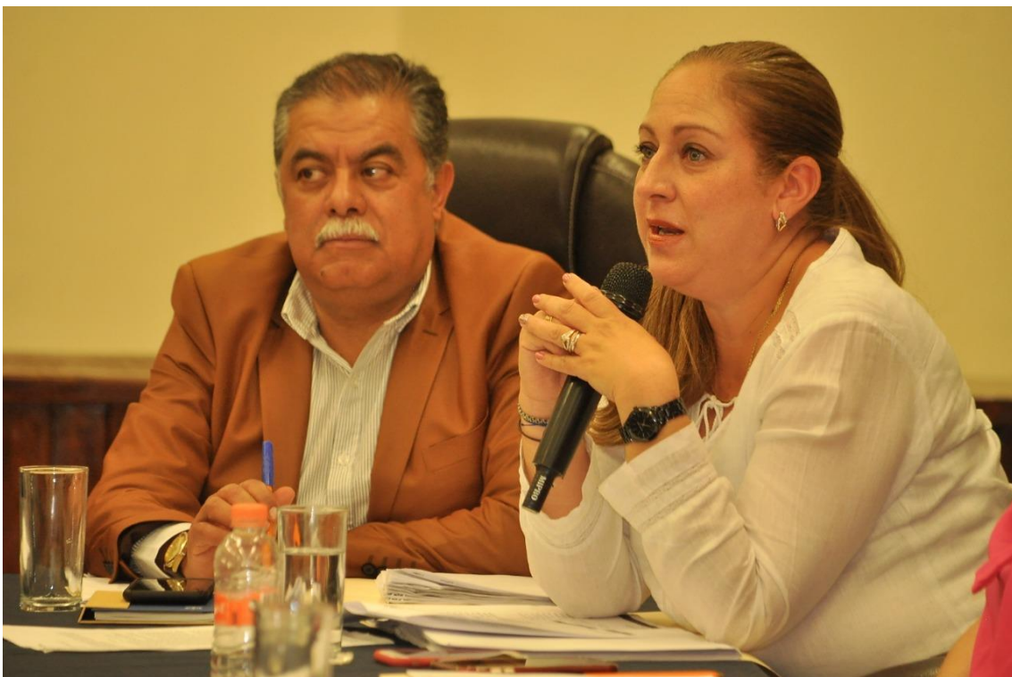
22 DE MARZO DE 2019