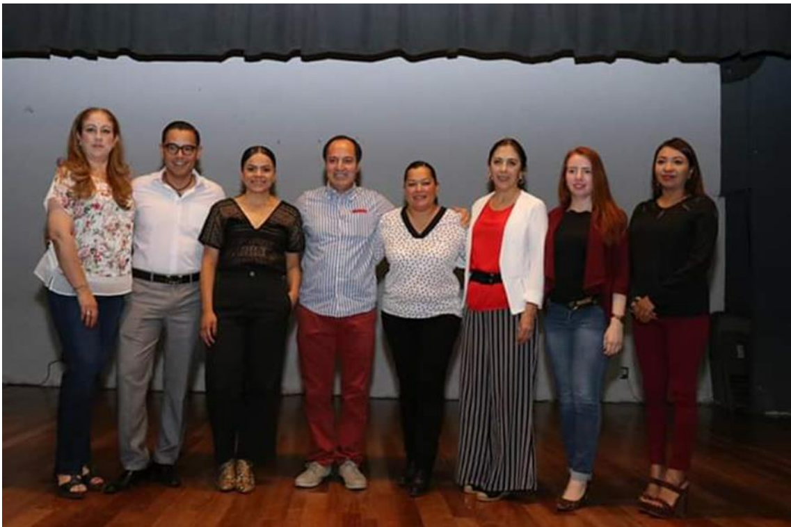
08 DE MARZO CONFERENCIA