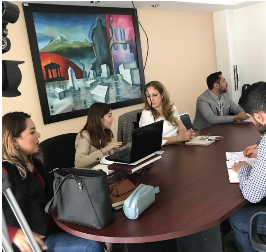
05 DE FEBRERO DE 2019.