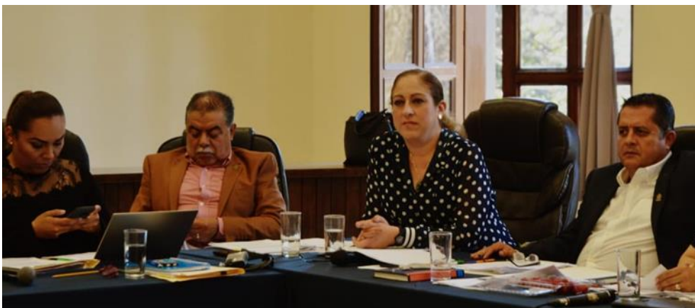
27 DE FEBRERO DE 2019 SESIONES ORDINARIA 04 Y EXTRAORDINARIA 11