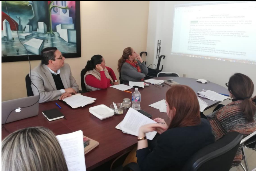
29 DE ENERO DE 2019