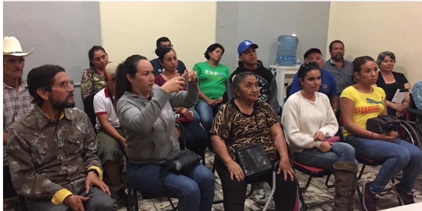
ENTREGA DE APOYOS OPD ESTACIONOMETROS 08 DE FEBRERO 2019