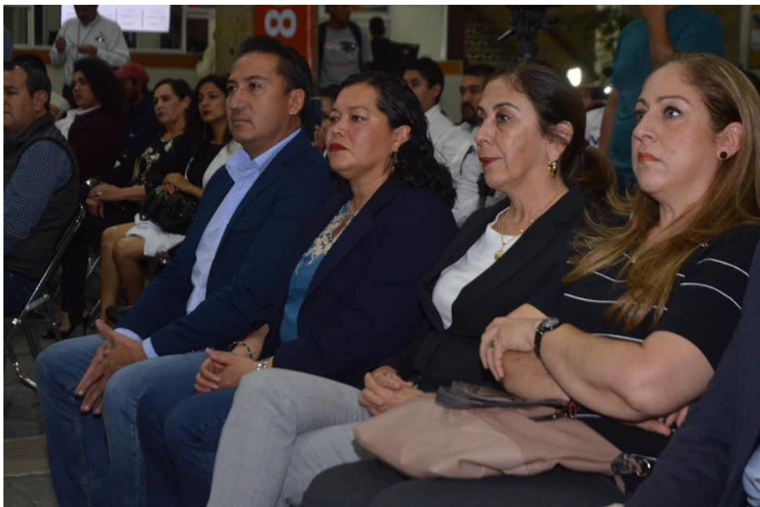
21 DE ENERO DE 2019. FIRMA DE CONVENIO HEMODIALISIS