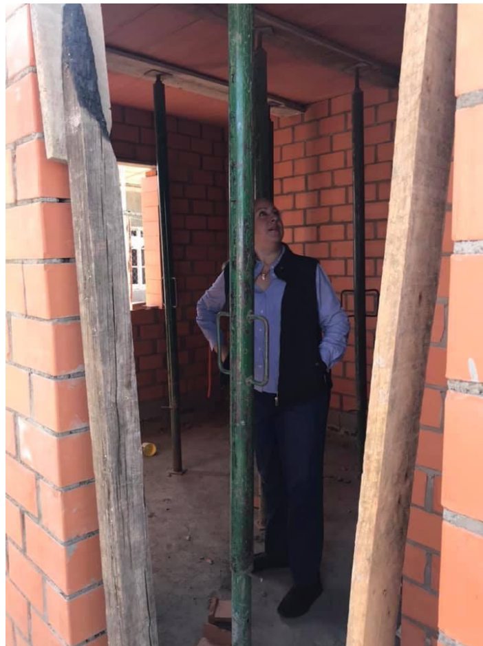
SUPERVISION DE OBRAS 09 DE ENERO 2019