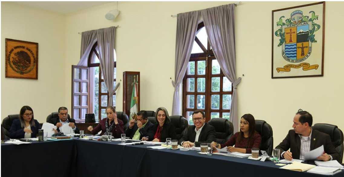
17 DE ENERO 2019 SESION ORDINARIA 03