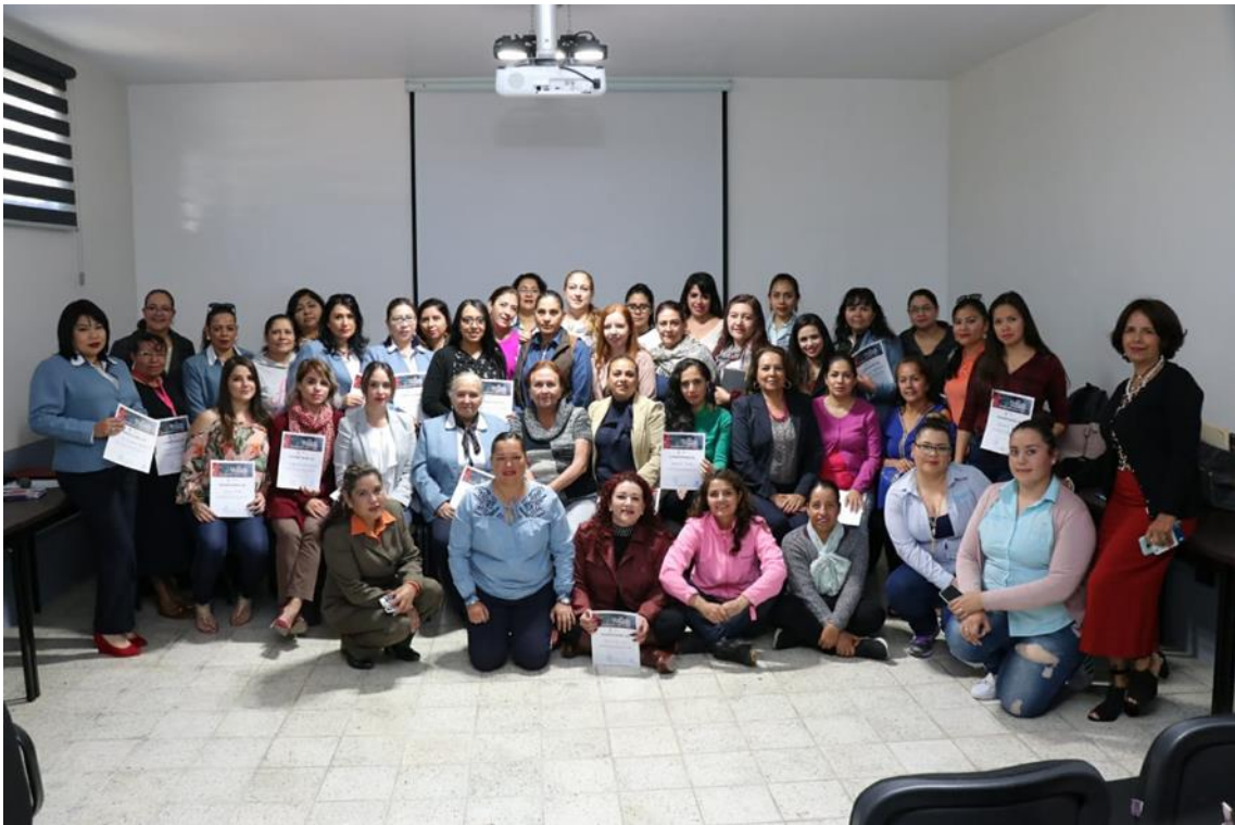
14 DE FEBRERO DE 2019. DOCUMENTAL CON EL INE