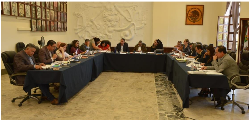
27 DE FEBRERO DE 2019 SESIONES ORDINARIA 04 Y EXTRAORDINARIA 11