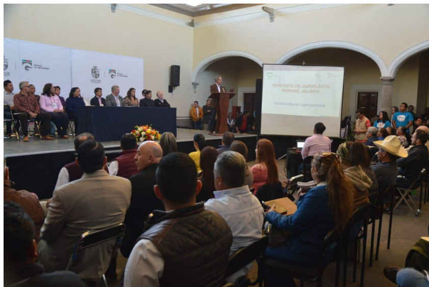
29 DE ENERO 2019 INSTALACION DE COMITÉ DE PLANEACION