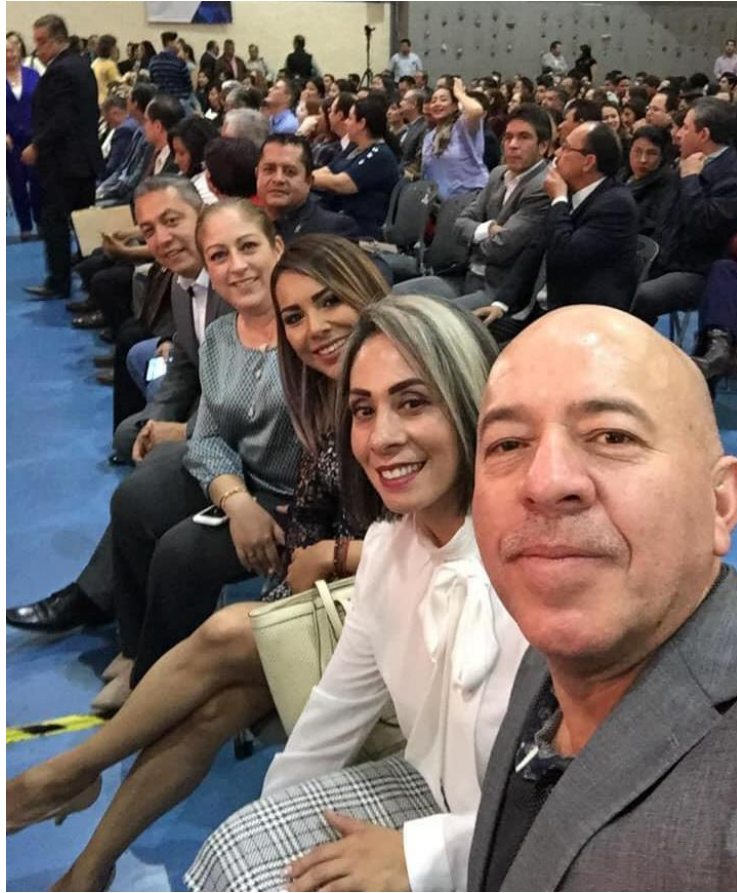
INFORME DEL RECTOR DEL CUSUR 24 DE ENERO DE 2017