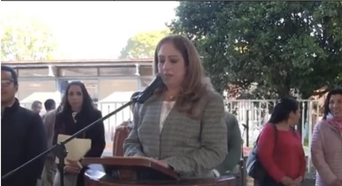
05 DE FEBRERO DE 2019