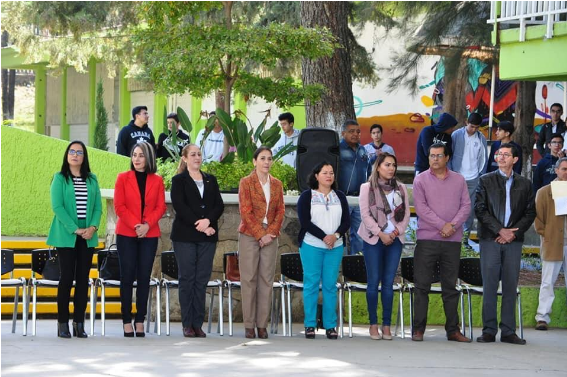
19 DE FEBRERO DE 2019 INAGURACION DEL DOMO DEL CBTIS 226