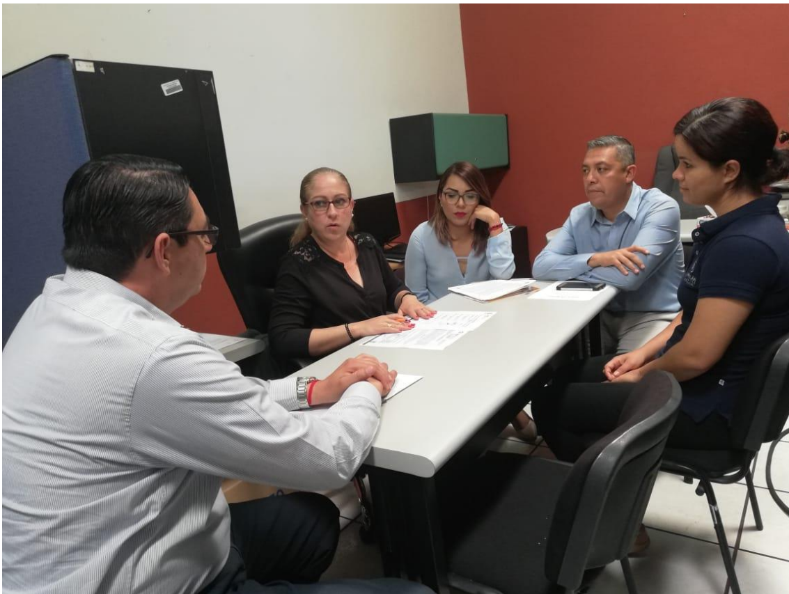
SESION NO. 05 EXTRAORDINARIA 22 DE MARZO DE 2019