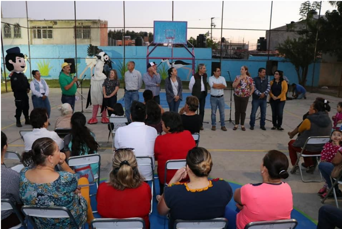
05 DE MARZO DE 2019. INAGURACION DE LOS TRABAJOS REALIZADOS EN LA COLONIA ESCRITORES