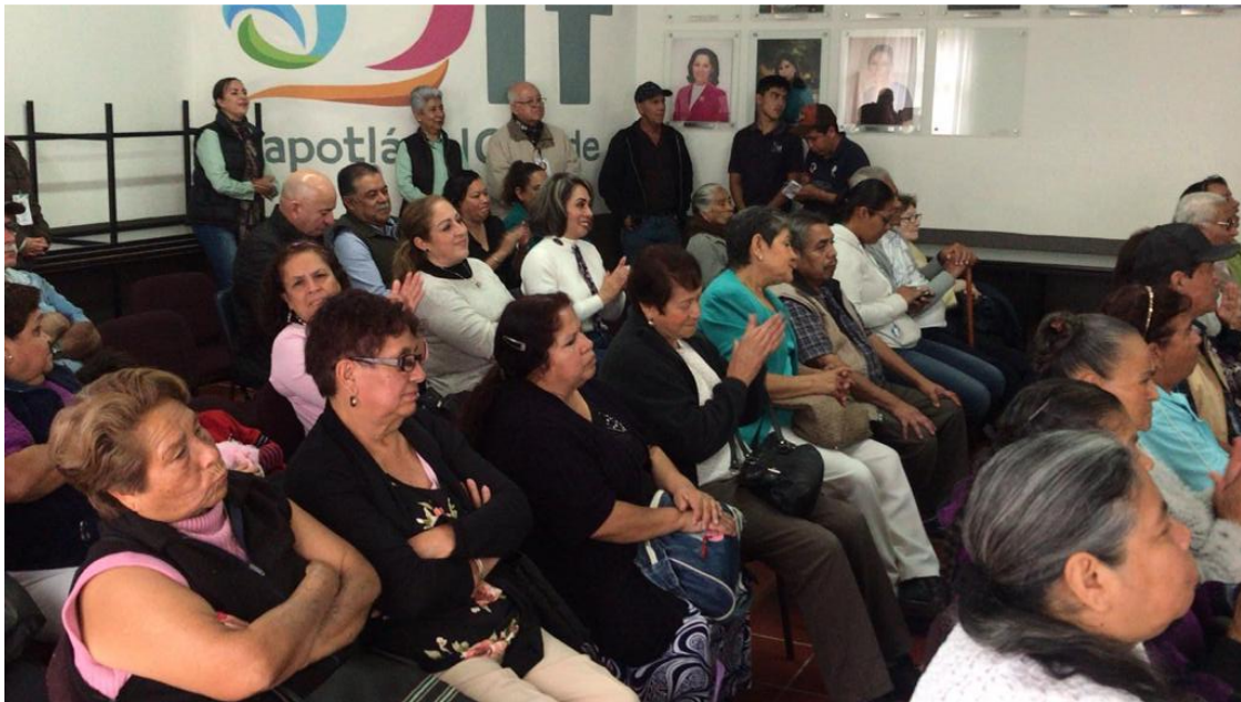
ENTREGA DE APOYOS A ADULTOS MAYORES 18 DE ENERO 2018.