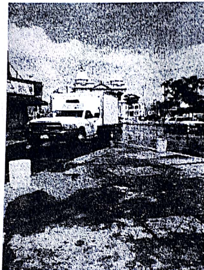
Banqueta con terminado de filo ubicada en la bifurcación hacia la calle Constitución

VIII. En este sentido, me permito señalar que de conformidad a las disposiciones legales aplicables, corresponde al ayuntamiento la regulación de la prestación de los servicios públicos, así como brindar a la ciudadanía un entorno adecuado para la movilidad de manera segura, por lo que resulta viable realizar la modificación al terminado en la estructura de ambas banquetas, lo que permitiría circular de manera más segura por ambas direcciones de dicha avenida.