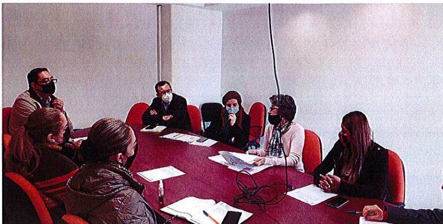
Sesión Pública Ordinaria de Ayuntamiento No. 20 y Sesión Pública Extraordinaria de Ayuntamiento No. 96.